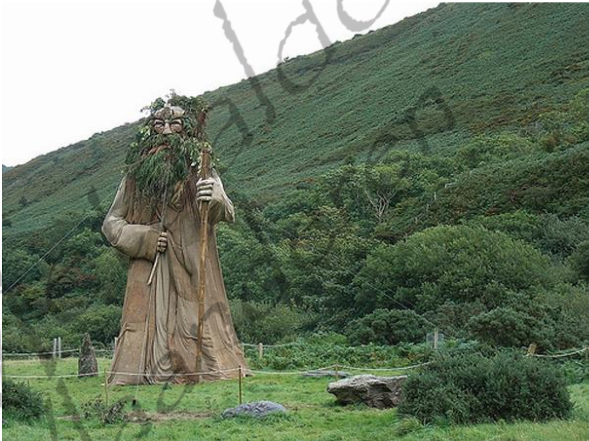
Beeld van Manannan op het eiland Man (Tholt-y-Will).

Toen wonnen de Tuatha. Op de grond lagen evenveel verslagen Fomori als er sterren waren onder de hemel, zandkorrels in de zee, sneeuwvlokken in de lucht, dauwdruppels op gras of golven tijdens een storm.