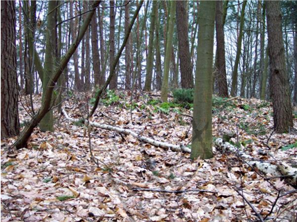
Een tumulus in Court-Saint-Etienne