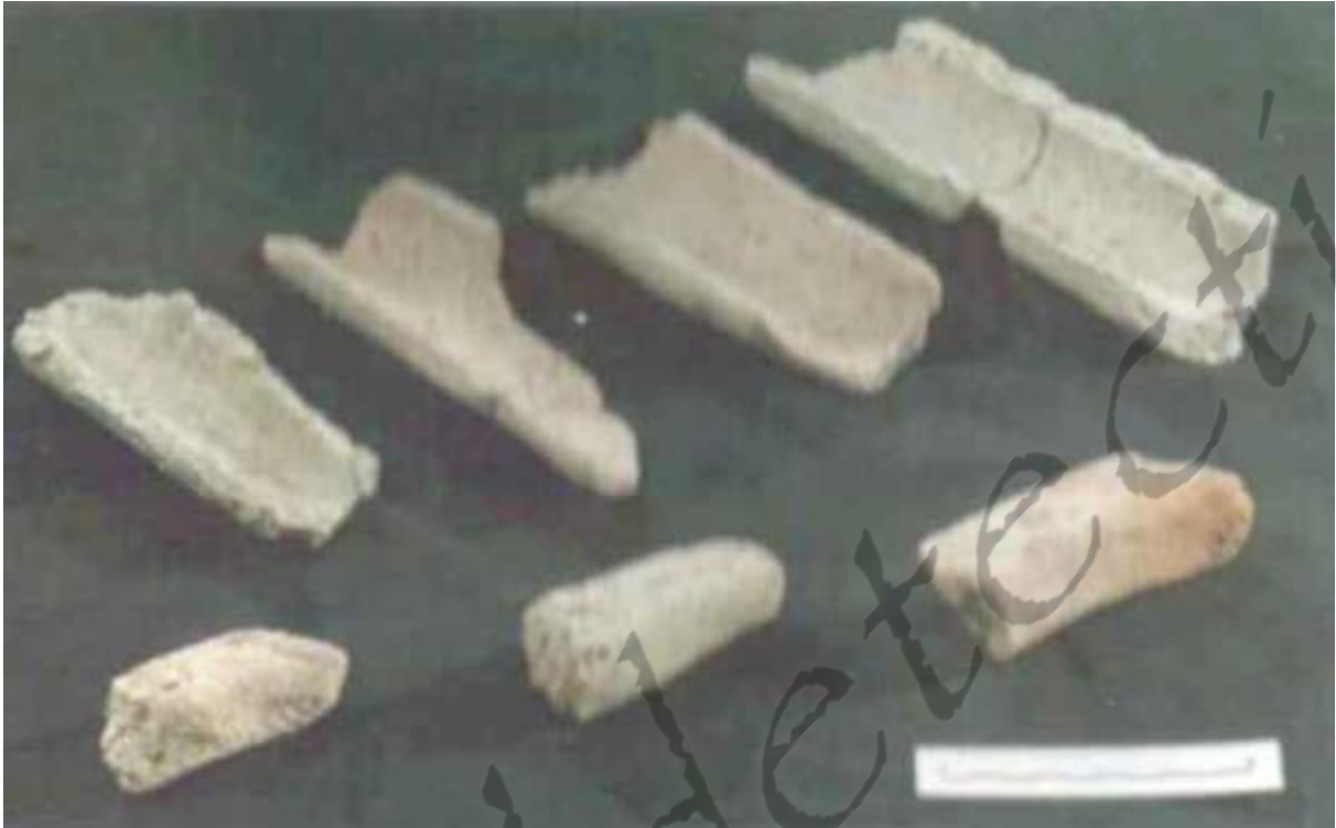
Fragmenten van zoutcontainers zoals ze werden teruggevonden in Nederland en Vlaanderen - Deze werden teruggevonden in de Nederlandse plaats Oss

Verscheidene onderzoekers veronderstellen dat de vroegste nederzetting op de Kemmelberg (zie aparte pagina over de vondsten op de Kemmelberg) tot dit type van vestiging behoorde. Ook de voorhistorische site van de Kesselberg, Kester en Kooigem komen dankzij rijke funeraire vondsten en hun geografische inplantingen als 'Fürstensitzen' in aanmerking. Professor Bourgeois veronderstelt dat de kans op het ontdekken van een vijfde vestiging op het Kempisch Plateau, met controle over de Maasvallei, groot is. Hierbij verwijst hij naar de territoriale spreiding van de vier reeds in Vlaanderen ontdekte hooggelegen versterkingen die natuurlijk afgebakende gebieden beheersen: de kuststrook en de Leievallei (Kemmelberg), het land tussen Leie en Schelde (Kooigem), de landstreek van Dender tot Zenne (Kester) en het gebied tussen Dijle en Demer (Kesselberg).