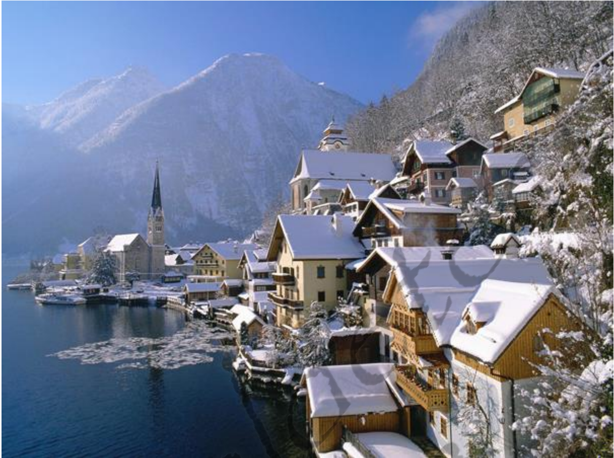
Hallstatt zoals het er nu uitziet

De leefgemeenschap die zich in de vallei en op de scherpe hellingen in Hallstatt vestigde, behoorde met Biskupinit (Polen) en het Sloveense Sticna tot de belangrijkste economische centra van de Keltische wereld, oostelijk van de Alpen. Hallstatt (zoutmijnen) en Sticna (ijzererts) onderhielden gedurende eeuwen een bloeiende handel, over land, met de Griekse stadsstaten. De cultuur wordt tegenwoordig graag gezien als een vroege Keltische stam, die aan de La Tène-periode vooraf ging. In het begin van de twintigste eeuw bracht men ze in verband met de Illyriërs. Omdat we echter geen schriftelijke bronnen hebben en hun taal en hun denkwereld niet kennen, is het eigenlijk onmogelijk daar iets met zekerheid over te zeggen.