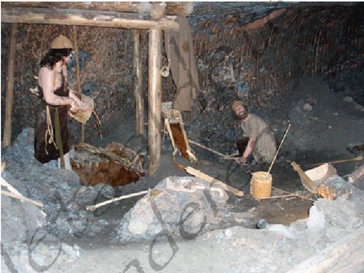
Reconstructie van de zoutmijn in Hallstatt

De mijnbouw in het gebied rond Hallstatt en Dürnnberg dateert al van de midden-bronstijd. Dit werd aangetoond door vondsten van gereedschappen in de zoutmijnen. In de 18e eeuw werden zelfs de mummies van verongelukte prehistorische mijnwerkers gevonden, maar deze zijn later vernietigd. Er werd in die mijnen voornamelijk zout gewonnen, wat in die dagen een zeer waardevol handelsgoed was. Deze zoutwinning was wellicht de bron van de rijkdom die in zoveel grote graven tentoon wordt gespreid.