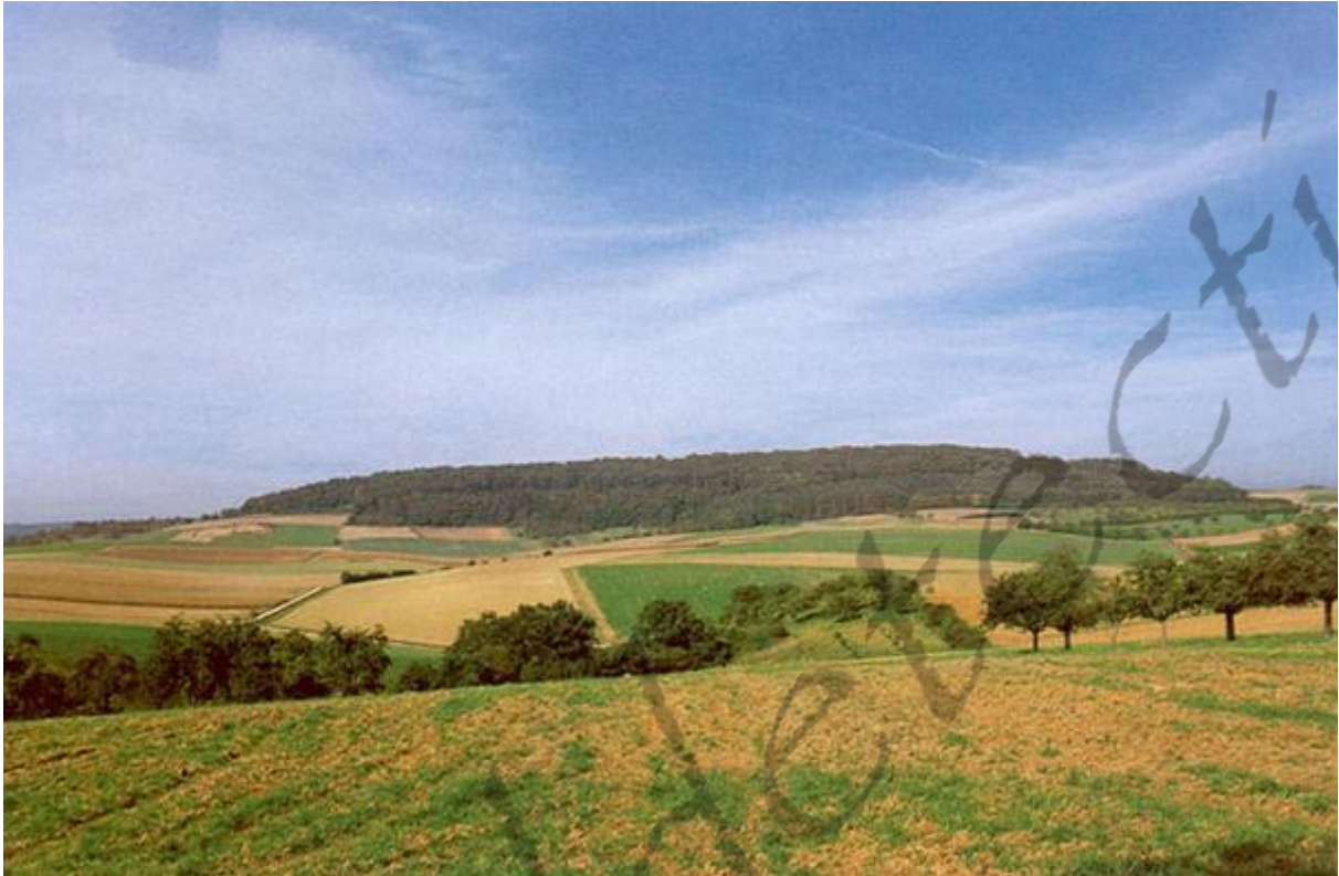
De Glauberg, een "Fürstensitze" of chieftdom

De zogenaamde 'chieftdoms' werden geleid door leden van aristocratische kasten die zich in hooggelegen vestingen terugtrokken (Fürstensitze), van waaruit zij de regionale handel beheersten en de overslag van goederen uit het noorden (Noord-, Noordwest- en Midden-Europa) en het Zuiden (Zuid-Europa en het Middellands Zeegebied) controleerden. De meerderheid van de chieftdoms ontwikkelden zich westelijk van de Alpen.