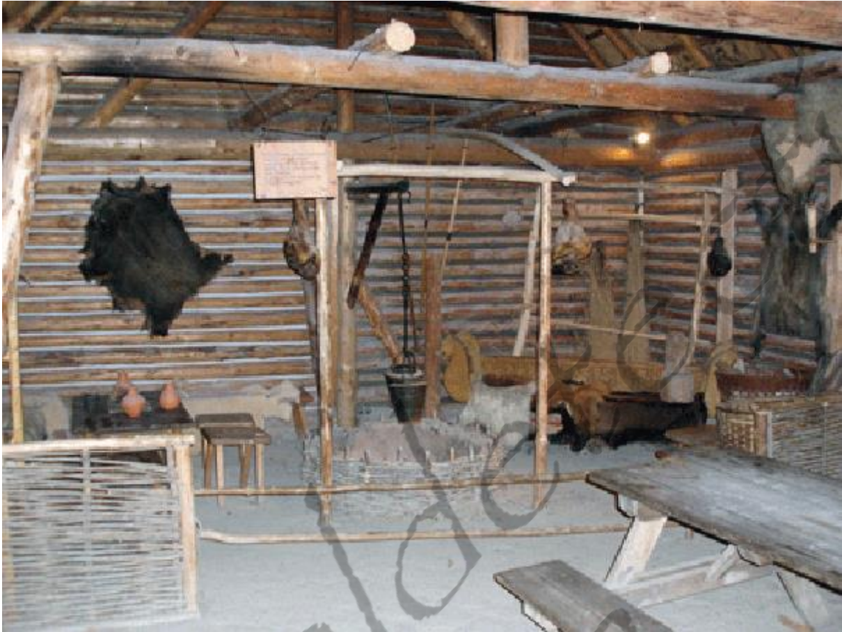
Keltenmuseum te Hallein, reconstructie van een blokhut

De zoutmijn van Salzkammergut nam in belang af toen rond 600 v. Chr. een meer toegankelijke mijn in het naburige Hallein bij Salzburg werd ontgonnen. Het toen 'internationale' belang van deze nieuwe zoutmijn schuilt nog steeds in het Welshe woord 'Hallein' dat zout betekent!