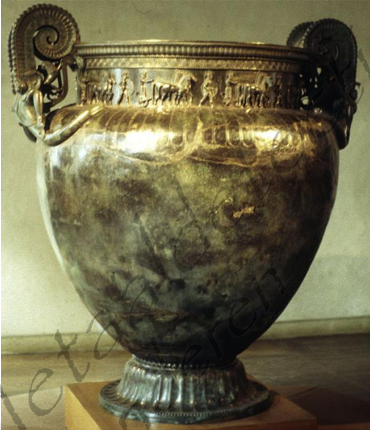
Wijnkruik gevonden in het graf van de 'prinses' te Vix. Dit type van kruik werd gebruikt om de stroperige wijn te vermengen met water

Toen de Griekse kolonies rond 600 v. Chr. het handelsverkeer over land naar de zee en de grote rivieren verplaatsten, ebde de economische belangrijkheid van Hallstatt, Biskupinit en andere Midden-Europese handelsnederzettingen weg. Hun commerciële functie werd door pre-stedelijke heuvelburchten, noordelijk van de Rhône, overgenomen. De voornaamste 'chiefdoms' (kleine koninkrijken) waren: Heuneburg (Zuid-Duitsland), Châtillon s/ Glâne, Hochdorf (Zwitserland), Vix en Mont Lassois (Frankrijk).