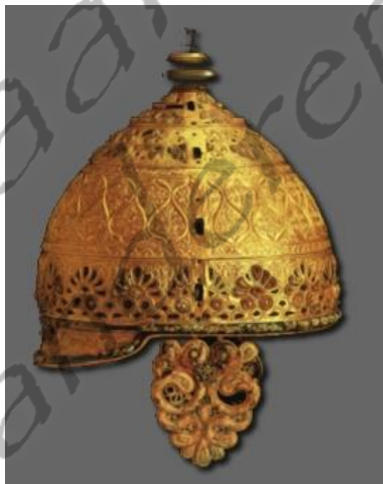
Helm uit de La Tène II-periode. Agris, Frankrijk

De oppida, Keltische hoofdsteden van stamstaatjes en -staten kwamen op het continent alléén voor onder de denkbeeldige lijn Mont-Saint-Michel (Normandië) - Titelberg (Groothertogdom Luxemburg) - Stradonice (Tsjechië). De oppida waren ommuurd met hoge aarden wallen en omringd door grachten. Zij waren overwegend dichtbevolkt en onderverdeeld in meerdere stadsdelen (woonwijken, handelskwartieren, ambachtelijke wijken, enzovoort). De straten sneden elkaar in dambordpatroon aan.