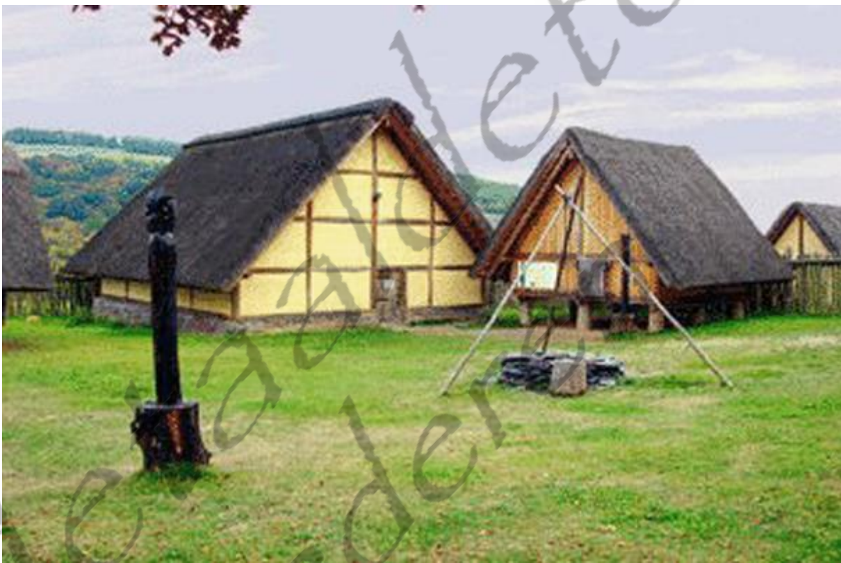
Typische huizen uit het La Tène-tijdperk

De eerste 'La Tène'-voorwerpen werden in 1857 door Hanslin Kopp, een amateur-archeoloog, in de 'lieu dit' La Tène bij het Meer van Neuchâtel in Zwitserland aangetroffen. Tijdens een wandeling in de omgeving van Marin-Epagnier werd zijn aandacht getrokken door palen die, omdat de waterspiegel van het meer was gezakt, voor het eerst zichtbaar waren. Tussen de palen trof hij in ondiep water 40 Keltische ijzeren zwaarden aan!