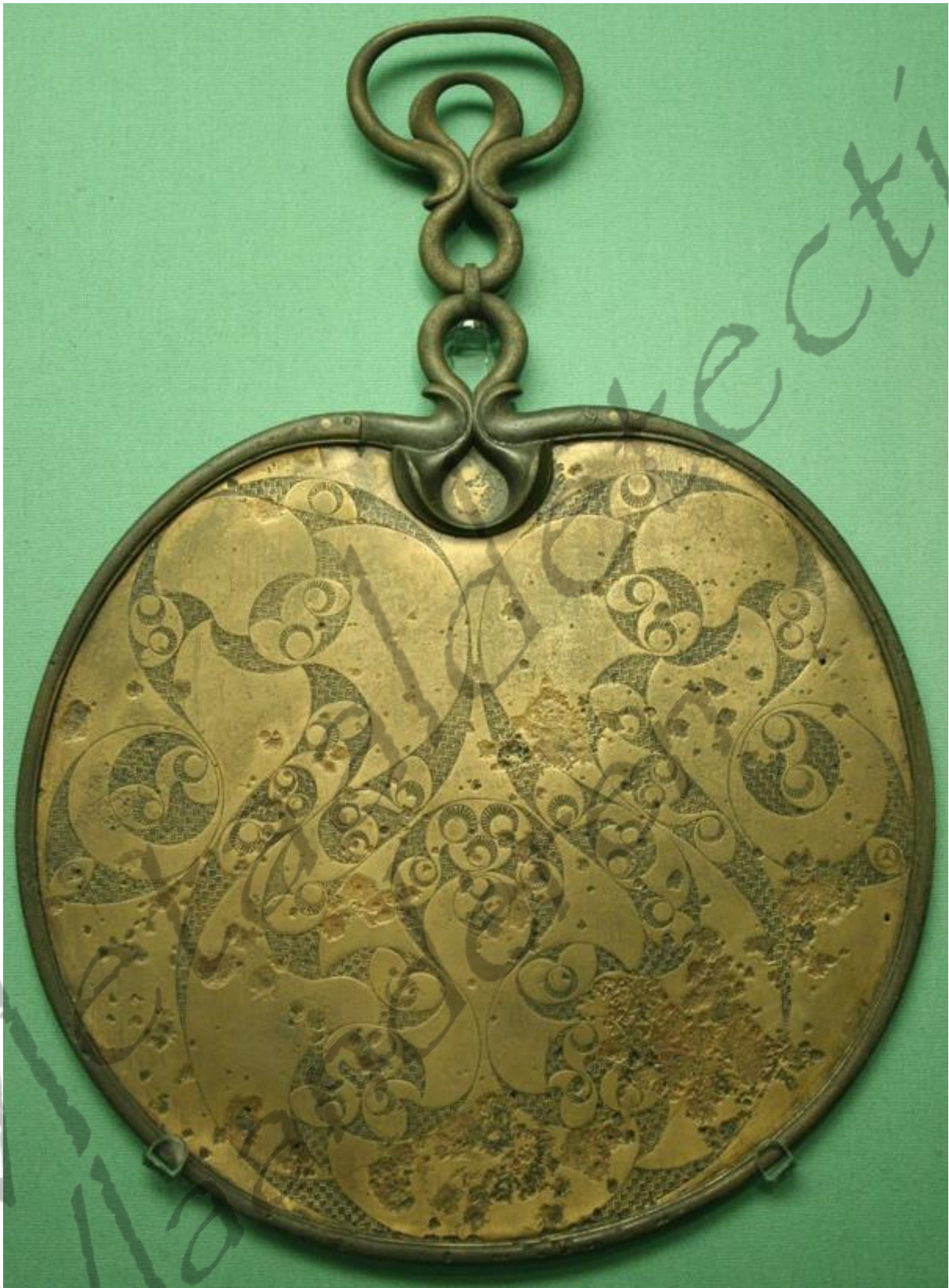
Een spiegel uit de 1e eeuw v. Chr. in Desborough, Northants gevonden, met spiraal en trompet thema Artefacten uit de La Tène-periode zijn over een groot gebied opgegraven, tot in delen van Ierland en Groot-Brittannië en Noord-Spanje. Ontdekking van een uitgebreide grafcultuur bracht tevens een groot handelsnetwerk aan het licht. Exportlijnen naar de Middellandse Zee regio toe steunden vooral