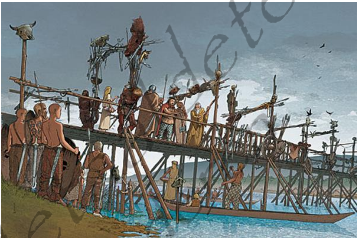
Waarheidsgetrouwe tekening van de La Tène site