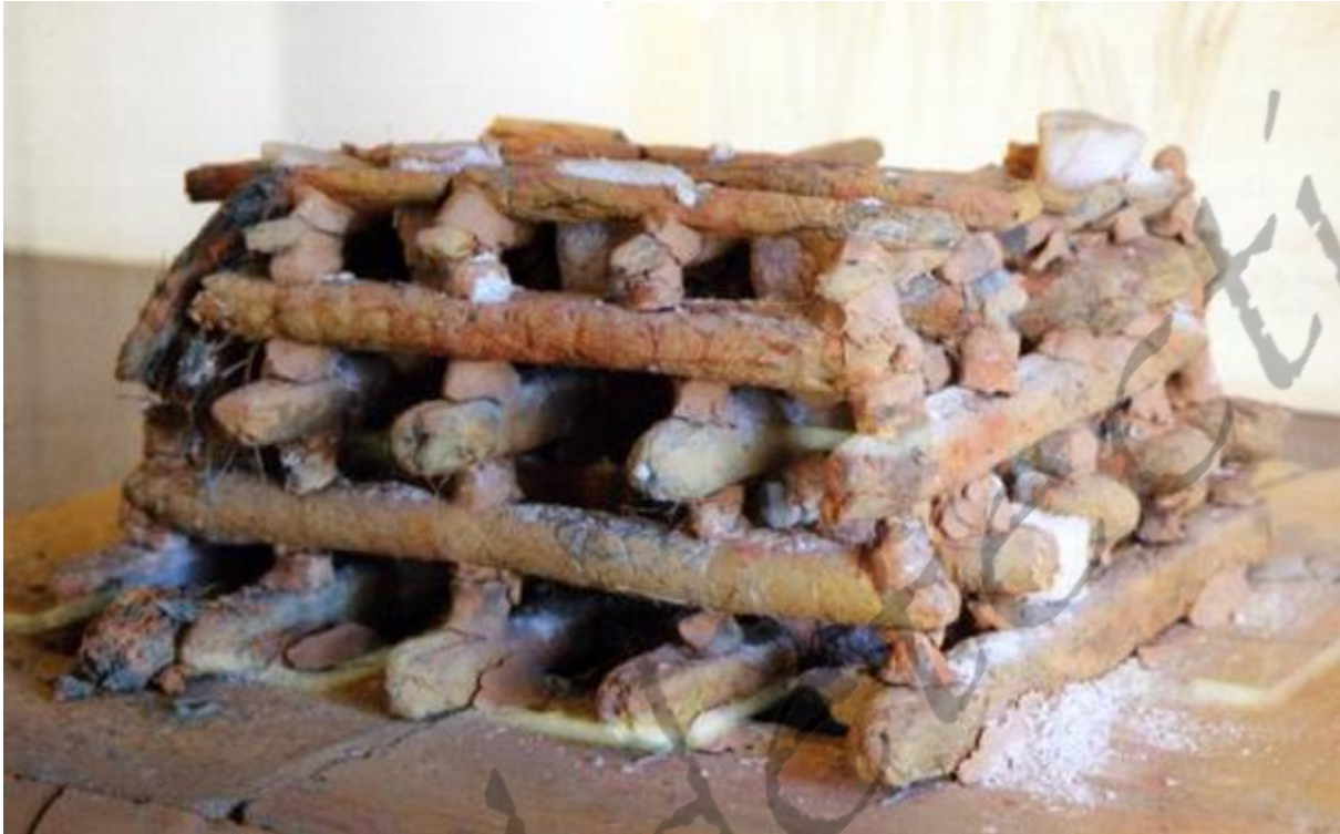
Reconstructie van een "oven" waarin zout werd gewonnen uit zeewater in de zogenaamde "briquetages"

In het kustgebied en het hinterland werden onder meer door het wetenschappelijk team van professor Hugo Thoen (RUG) zogenaamde 'briquetages' opgediept. De aanwezigheid van dit lichtgebakken aardewerk dat verschaald werd met organisch materiaal, wijst ontegensprekelijk op zoutwinning (De Panne, Veurne en Brugge). De briquetage was een grofwandig bakje dat met zeewater werd gevuld en daarna in een oven werd verhit tot het water verdampte, zodat het zout overbleef.