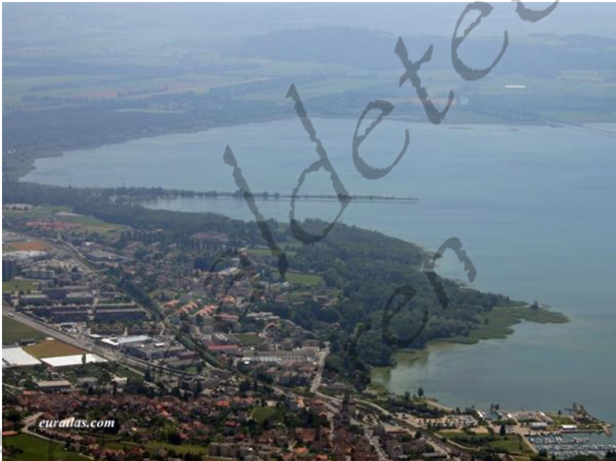
Luchtfoto van het huidige La Tène aan het meer van Neuchâtel

De introductie van respectievelijk koper, brons en ijzer verschilt op het Europese continent in tijdruimtes, die afhankelijk van het gebied, in decennia of eeuwen worden uitgedrukt. De precieze aanvang of evolutie van een fase of beschaving is altijd streekgebonden. Snelle of wispelturige patronen van verspreiding zijn het gevolg van veranderende handelswegen, veroveringstochten of -oorlogen, gebieden die niet door natuurlijke hindernissen worden gescheiden, rivierboorden en dergelijke.