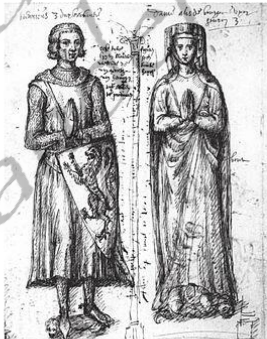
Hendrik III en Aleidis

Hendrik trouwde in 1251 met Aleidis van Bourgondië, dochter van Hugo IV van Bourgondië. Hendrik steunde de kandidatuur voor het Duitse koningschap van Alfons X van Castilië, door wie hij in 1257 werd aangesteld tot handhaver van de vrede in de westelijke rijksgedelen.