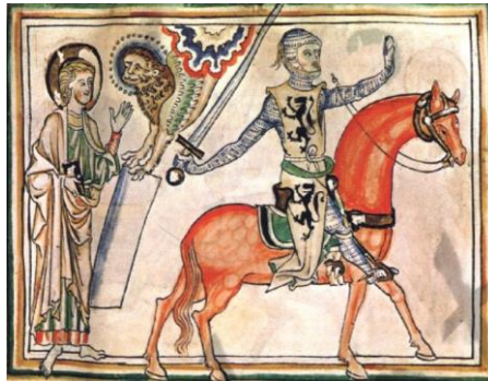
Gwijde van Dampierre

Daarmee werd het verbond van hun vaders voortgezet. Koning Rudolf van het Heilige Roomse Rijk, erkende Jans rechten in 1275. In 1277 wees Rudolf Jan bovendien aan als erfgenaam van Floris, indien die kinderloos zou overlijden. In februari 1280 volgde hij Margaretha op in Henegouwen, die het graafschap Vlaanderen reeds in 1278 had afgestaan aan haar zoon uit haar tweede huwelijk, Gwijde van Dampierre.