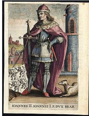
Jan II van Brabant

Diezelfde zomer keerden de kansen. Op 11 augustus werd Gwijde van Namen definitief verslagen in de Slag bij Zierikzee door een Hollands-Franse vloot onder leiding van Reinier Grimaldi. Toen Jan overleed was zijn gezag in Holland en Zeeland vrijwel geheel hersteld.