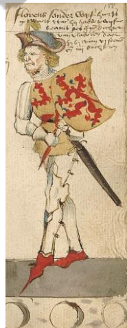
Floris V van Holland

Jan was de oudste zoon van Jan van Avesnes (zoon van Margaretha van Constantinopel) en Aleid van Holland (dochter van graaf Floris IV van Holland). Zijn vader Jan en Margaretha hadden een lange strijd gevoerd over de verdeling van de goederen van Margaretha. Daaruit volgde dat vader Jan Henegouwen zou erven, maar omdat hij voor Margaretha overleed, ging dit recht over op Jan II. Jan II sloot voor alle zekerheid in 1272 een verbond met zijn neef Floris V van Holland tegen Margaretha.