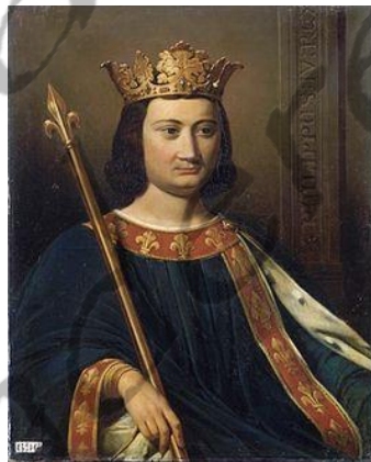
Filips IV van Frankrijk

Jan I hervatte meteen de strijd van zijn vader om Rijks-Vlaanderen. Om de oorlog te financieren hief hij hoge belastingen en nam hij ook kerkelijke bezittingen in beslag. De stad Valencijs kwam daarom in opstand tegen Jan. Zijn eigen broer, Willem, bisschop van Kamerijk, bestrafte Jan door een interdict over Henegouwen uit te spreken. Jan moest de oorlog tegen Vlaanderen daardoor beëindigen, zonder dat een van de partijen de overwinning had behaald. Valencijs stelde zich echter onder de bescherming van koning Filips IV van Frankrijk.