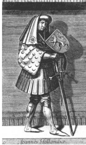
Jan I van Holland

Twee weken later stierf de jonge graaf, officieel aan dysenterie, maar er deden natuurlijk ook kwade geruchten de ronde. Jan was zijn erfgenaam en werd in 1299 graaf van Holland. Voortaan was Holland in een personele unie met Henegouwen verenigd. De Duitse koning Albrecht I meende zich met de opvolging te moeten bemoeien: hij riep de onderdanen van de graaf op hun trouw aan Jan op te zeggen. Hij ging daarvoor naar Nijmegen, maar toen daar een Hollands leger naderde, zette hij zich op sienen peerde ende reet te lande, al dat hi mochte (augustus 1300).