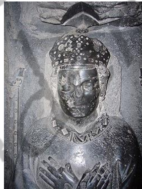
Het gehavende gezicht op de graftombe van Gwijde van Avesnes in de Domkerk te Utrecht

Omdat Filips grote delen van Vlaanderen had bezet, kon Jan in 1301 eenvoudig de Vlaamsgezinde adelsfractie in Zeeland onderwerpen. Ook kon hij in dat jaar zonder problemen zijn broer Gwijde van Avesnes tot bisschop van Utrecht laten benoemen, maar na de Guldensporenslag had Vlaanderen weer het initiatief.