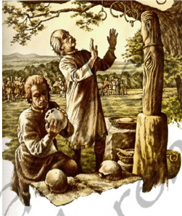
Voorstelling Keltische druiden

Er is zeer weinig bekend over de Keltische religie. De enige bronnen over het geloof zijn afkomstig van Romeinen en Grieken, die de Kelten als niet meer dan dieren zagen, of van Welshe en Ierse monniken, die de oude religie vanuit het perspectief van het christendom bekeken. Zeker is echter het volgende.