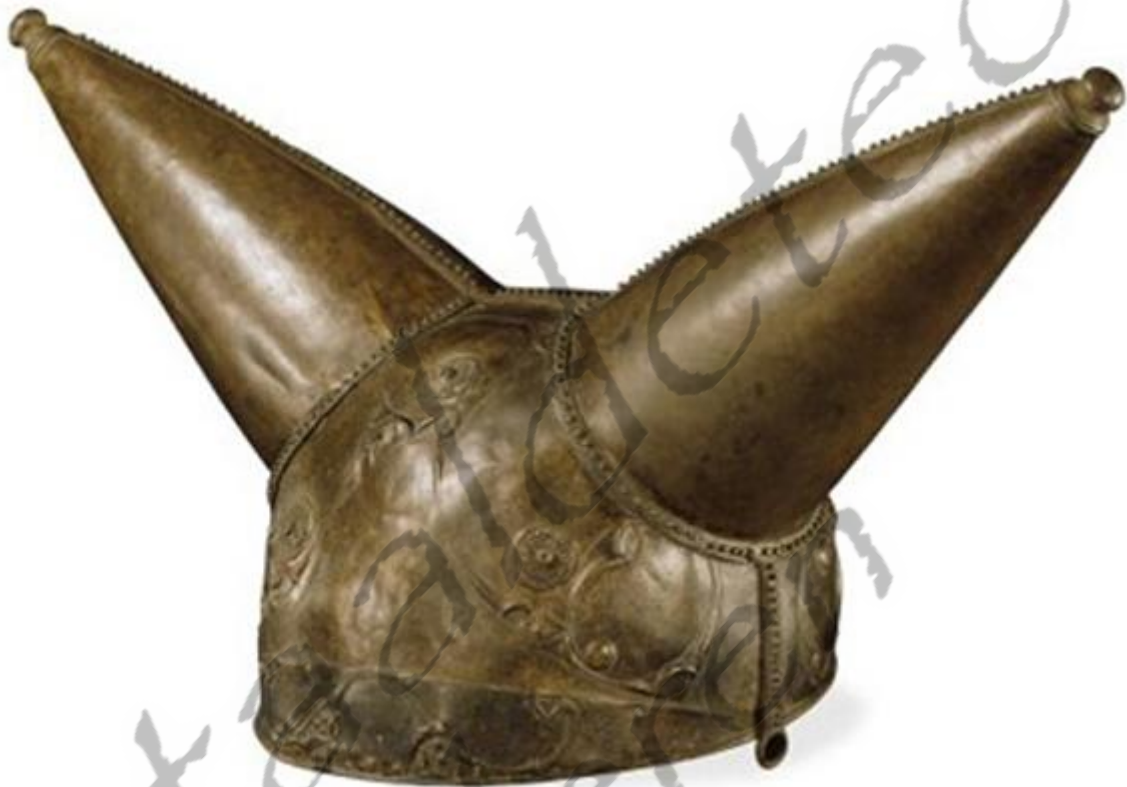
Typisch voorbeeld van een Keltische helm

Toen de Griek Ephorus het bestaan van de Kelten vermeldde, waren ze al zo talrijk dat hij ze één van de vier barbaarse volkeren in de wereld noemde, de anderen waren de Libiërs in Afrika, de Perzen in het oosten en de Scythen, die ook in Oost-Europa leefden. De Kelten vormden tegen die tijd een grote groep stammen die leefden in een gebied dat van Schotland en Rusland tot het Mediterrane gebied reikte.