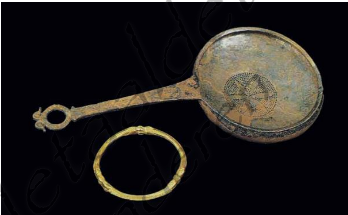
Typische grafvondsten in adellijke Keltische graven

De Kelten hadden geen kastenmaatschappij, alhoewel er wel verschillende standen in de samenleving waren. Sociale mobiliteit was echter mogelijk. Het hoogste aangeschreven stond de adel. Soms was de hoogste edelman een koning, deze was meestal koning over of stamhoofd van een stam, maar later kwamen naties die bestonden uit verschillende stammen onder een koning te staan. Koningschap werd gezien als goddelijk en de leider was degene die namens de goden sprak. De kroon was echter niet altijd erfelijk, want koningen konden een opvolger aanwijzen. De erfelijke titel bij de Picten was via de vrouwelijke lijn, hoewel de vorst zelf vaak wel mannelijk was. De monarchie was echter niet de enige Keltische regeringsvorm, waarbij de stamleider altijd werd uitgekozen door de stam. In Gallië was het bij sommige stammen voor de Romeinse verovering de gewoonte dat de edelen een magistraat, de Vagobret, kozen die de stam regeerde. De werkelijke macht lag echter vrijwel altijd bij de adel, zij bezaten het land en hun zonen en dochters werden de generaals en druïdes.