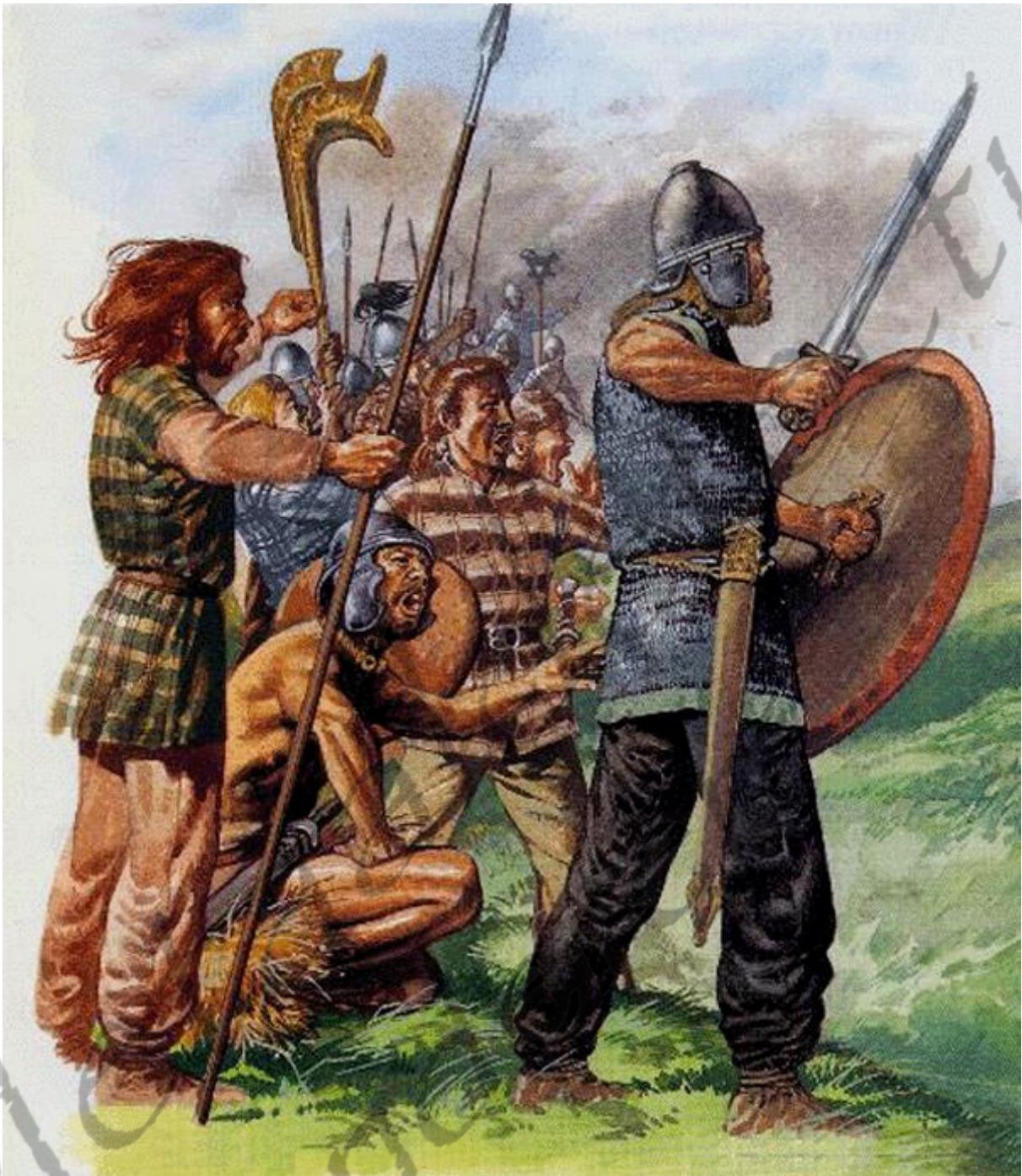
Voorbeeld van Keltische wapenrusting tijdens een veldslag

De basisuitrusting van een Keltische krijger bestond uit een set van één tot vier speren. Eén was de 1,8 meter lange vechtsspeer die soms een speerpunt van wel 50 cm had. De andere waren kleinere werpsperen met relatief kleine, korte speerpunten. Een soldaat had ook een groot houten schild, bedekt met leer en met een metalen schildknop, dat ongeveer 1,2 meter hoog en 0,5 meter breed was. Waarschijnlijk werd dit schild versierd met geverfde symbolen of metalen decoratie. Naast deze basisuitrusting droeg de Keltische strijder zijn gewone kleding, een broek, een shirt en een mantel. Alleen een Keltische edelman droeg waarschijnlijk een zwaard, de lengte van de kling varieerde van 0,8 tot 1 meter. De zwaarden van vroegere periodes hadden duidelijke zwaardpunten en waren hierdoor in staat om zowel te hakken en te slaan als te steken. Later werd de punt afgerond en kon het zwaard vrijwel alleen gebruikt worden om te hakken en te slaan. Soms was het zo, vooral in de