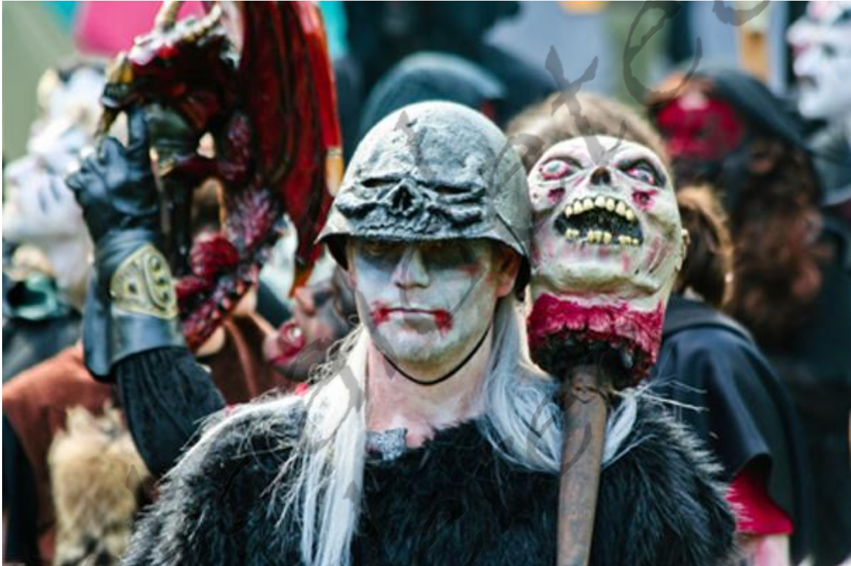
Reconstructie van een Keltische veldslag

De Kelten hebben vele gevechten gestreden, gewonnen en verloren. Soms waren dit kleine schermutselingen met slechts enkele honderden soldaten, maar er waren ook massale veldslagen in welke tien- tot honderdduizend mensen meevochten. In tegenstelling tot de Romeinen echter waren de Kelten waarschijnlijk niet gewend om te vechten in formaties en georganiseerde eenheden. De beschrijvingen die we hebben van oude bronnen, die natuurlijk meestal niet onbevooroordeeld waren, vertellen dat ze meestal in ongeorganiseerde groepen vochten. De oude Keltische legers vochten met hun vijand alsof ze hem zouden verslaan door hem met brute kracht te overweldigen, in plaats van met een uitgedachte tactiek. Deze instelling kwam waarschijnlijk deels door de Keltische mentaliteit waarin individuele dapperheid en heldendaden in hoger aanzien stonden dan overwinning door een dicht opeen gepakte formatie. En deze instelling heeft ook zeer vaak geholpen. De Kelten maakten veel gebruik van psychologische oorlogvoering. Voordat ze op hun vijand afstormden, maakten ze lawaai door hun wapens tegen hun schilden te slaan, te roepen en te zingen terwijl grote strijdhoorns, camyces en trommels weerklonken. Vervolgens lieten ze de afgeslagen hoofden van voorgaande vijanden zien als trofee. Wanneer de slag eenmaal losbarstte raakten de