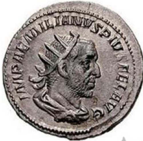
portret van Keizer Aemilianus op een antoninianus.

Marcus Aemilius Aemilianus (207 of 208? - september ? 253) was ongeveer 3 maanden keizer van Rome, rond de zomer 253.