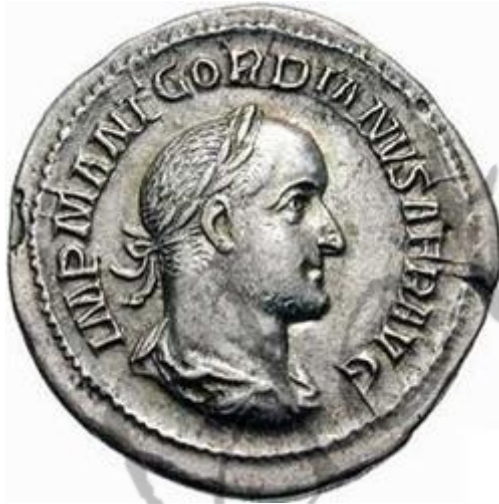
Muntstuk met afbeelding van Keizer Gordianus II.

Marcus Antonius Gordianus Sempronianus Romanus "Africanus" (191 - 04-238 n. C), (exact dezelfde naam als zijn vader, Gordianus I) kortweg Gordianus II, was keizer gedurende enkele weken in maart-april samen met zijn vader Gordianus I.