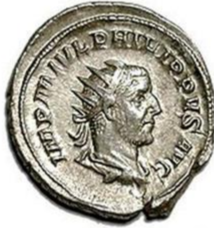
Munt met afbeelding van Keizer Philippus I Arabs.

Marcus Iulius Philippus (leefde ca. 204-249), bekend als Philippus I Arabs, "Philippus de Arabier", was een Romeins keizer van 244 tot 249. Van zijn leven en politieke carrière tot zijn keizerschap is weinig bekend. Hij was de zoon van Iulius Marinus en is waarschijnlijk geboren in Arabia Trachonitis of in Damascus, in de destijds Romeinse provincie Syria.