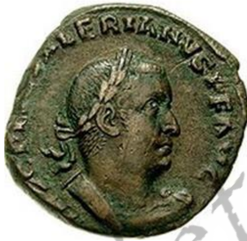
Portret van Keizer Valerianus I op een sestertie.

Publius Licinius Valerianus, bekend als Valerianus I, (ca. 200 - 260) was een Romeins keizer van 253 tot 260.