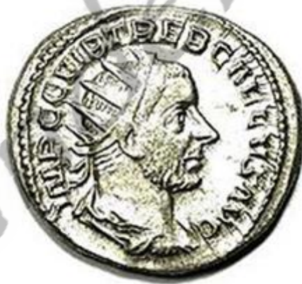
munt met afbeelding van Keizer Trebonianus Gallus.

Gaius Vibius Trebonianus Gallus (ca. 206 - augustus 253) was een Romeins keizer van juni 251 tot augustus 253, met als medekeizers eerst Hostilianus en daarna Volusianus.