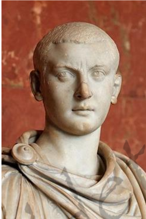
Buste van Gordianus III. Marmer, Romeins kunstwerk, tussen 242 en 244 n. C van Gabii. Het beeld bevindt zich momenteel in het Louvre te Parijs.

Marcus Antonius Gordianus Pius (225 - 11 februari 244), in het Nederlands beter bekend als Gordianus III, was een Romeins keizer van 238 tot 244. Hij werd tot keizer gekroond op 13-jarige leeftijd, nadat zijn voorgangers Balbinus en Pupienus omgebracht waren. Onder invloed van zijn leraar, opvoeder en raadgever Thimestus werd hij bij zijn volk zeer geliefd. Het lukte hem om de grenzen van het Romeinse rijk veilig te stellen, een opstand in Afrika neer te slaan, en de Goten en Sarmaten te overwinnen. Toen Thimestus stierf, benoemde hij Marcus Iulius Philippus Arabs ("de Arabier") tot zijn raadgever. Mogelijkerwijs was deze verantwoordelijk voor zijn dood.