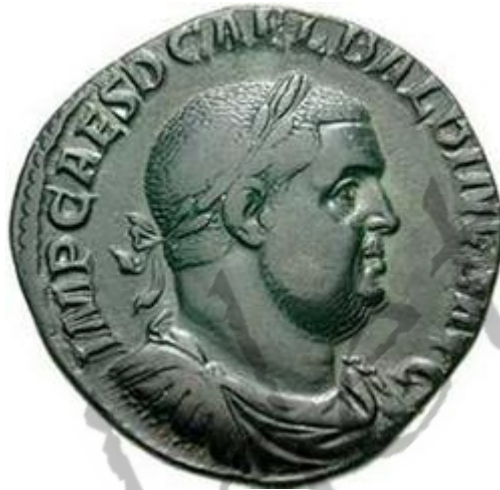
Muntstuk met afbeelding van Keizer Balbinus.

Decimus Caelius Calvinus Balbinus (? - 29 juli 238), was een Romeins keizer van 22 april tot 29 juli 238, samen met Pupienus.