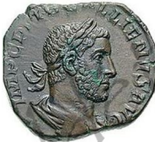
portret van Gallienus op een sestertie.

Publius Licinius Egnatius Gallienus (218 - september 268) was een Romeins keizer van 253 tot 268, waarvan tot 260 samen met zijn vader Valerianus I en in 260 nog met zijn tweede zoon Saloninus. Zijn vader was afkomstig uit de oude patricische gens Licinia en beiden werden dan ook met veel enthousiasme aanvaard door de senaat als Augusti