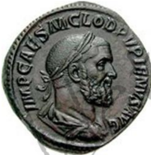
Muntstuk met afbeelding van Keizer Pupienus.

Marcus Clodius Pupienus Maximus (circa 164 of 174 - 29 juli 238), was een Romeins keizer van 22 april tot 29 juli 238, samen met Balbinus.