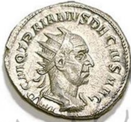
munten met afbeelding van Keizer Traianus Decius.

Gaius Messius Quintus Traianus Decius (Pannonia 190 of 201 - Dobroedzja, juli 251) was een Romeins keizer van 249 tot aan zijn dood.