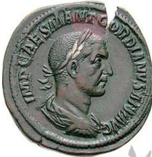
Muntstuk met afbeelding van Keizer Gordianus I.

Marcus Antonius Gordianus Sempronianus Romanus "Africanus" (157 - 04-238 n. C), kortweg Gordianus I, was keizer gedurende enkele weken in maart-april 238 samen met zijn zoon Gordianus II. Hij was een van de rijkste personen in het keizerrijk maar ook een zeer begaafde en integere persoonlijkheid.