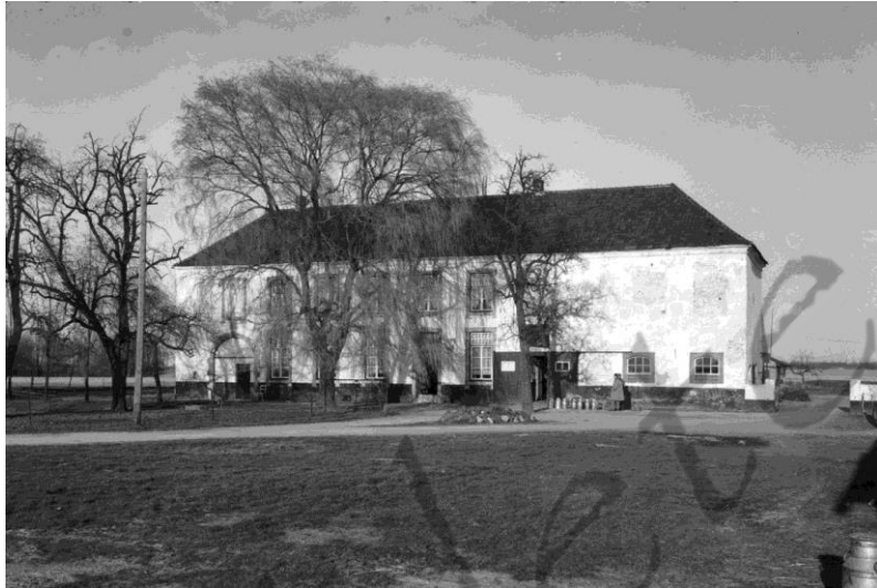
Klooster Keizerbosch, De heren van Horn beschouwden Keizerbosch als hun familiekerk. Velen van hen werden in de kloosterkerk begraven.