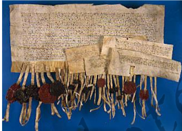
Stichtse Landbrief.

Bisschop Arnold moest de medezeggenschap van de Utrechtse burgers op het landsbestuur schriftelijk vastleggen in de Stichtse Landbrief van 1375, voordat de standen van het Sticht instemden met een belastingmaatregel om de financiën op orde te brengen. Deze Landbrief is een belangrijk document dat als de grondwet van het Nedersticht beschouwd kan worden.