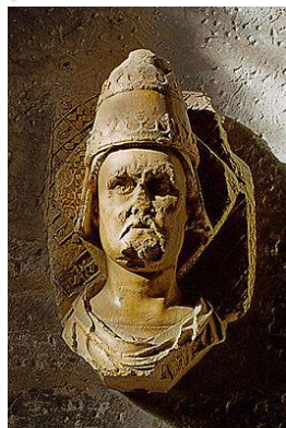
Tegenpaus Clemens VII

Daar had het kapittel echter een tegenkandidaat gekozen die gesteund werd door tegenpaus Clemens VII. Pas na een jaar van strijd kon Arnold zijn zetel in Luik innemen en gaf hij zijn positie in het Sticht op.