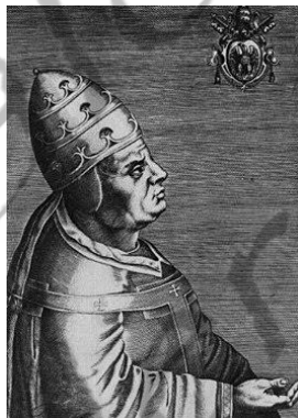
Paus Urbanus VI

Nu de oorlogshandelingen gestaakt waren stak de oude strijd in de stad tussen Gunterlingen en Lichtenbergers weer de kop op. Bisschop Arnold wist de partijen gescheiden te houden, maar hij werd in 1378 door paus Urbanus VI overgeplaatst naar Luik als opvolger van de eveneens uit Utrecht afkomstige Jan van Arkel.