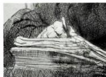
Ets van Rembrandt (1648) detail van zelfportret, zie boven.

Onze bevindingen zijn dus voorlopig dat krijtstiften in de 17e eeuw aanvankelijk vrij kort waren, maar gedurende de 18e eeuw, in lengte steeds meer toenamen.