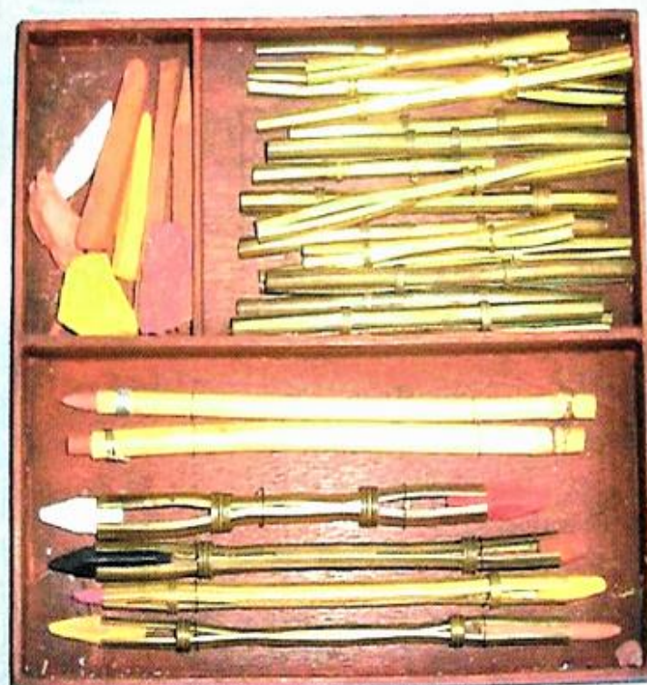
Doos met onderaan krijtstiftenhouders voor het tekenen met krijt (à trois crayons) van riet en brons/ koper uit diverse periodes en in diverse maten.

U kunt natuurlijk ook de website van de heer Den Hollander bezoeken om er alvast meer over te weten.