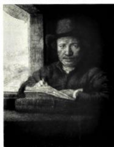
Ets van Rembrandt (1648) Zelfportret, tekenend aan venster.

Het zoeken naar krijtstiften, op afbeeldingen van oude meesters, lijkt weinig zin te hebben, blijkbaar hadden zij dat imago niet nodig. Toch vonden we een ets van de grote meester Rembrandt waarop het lijkt of hij een krijtstift hanteert. Als dat zo is zou dat betekenen dat krijtstiften, ten tijde van deze tekening (1648), inderdaad een stuk korter waren.