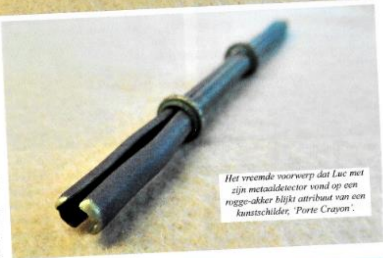
Het vreemde voorwerp dat Luc met zijn metaaldetector vond op een rogge-akker blijkt attribuut van een kunstschilder, 'Porte Crayon'.

Omdat de kans groot is dat er meerdere van zijn gevonden en dat ook die vindsters met een determinatieprobleem zouden kunnen zitten,