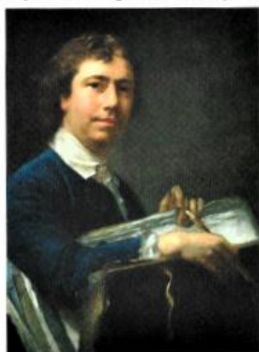
Zelfportret van Nathaniel Hone de oudere, (1718-1784), met zeer lange krijthouder. Het portret is geschilderd omstreeks 1760.

Laten we eens kijken welke zelfportretten daarvan bestaan en wat de wezenlijke verschillen zijn voor beide zelfportretten, voor zover daarop een krijthouder is afgebeeld natuurlijk.