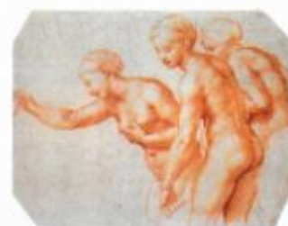
Rafaël, in rood krijt, studie van 'De Drie Gratiën'. (1514-1518)

De Renaissance heeft veel grote meesters voortgebracht, ik noem hier bijvoorbeeld Rafaël (1483-1520). Zonder tekort te doen aan Leonardo da Vinci, Michelangelo, Jeroen Bosch, Brueghel etc etc., maar omdat ik van Rafaël een fraaie studie in rood-krijt vond, van De drie Gratiën. Door een fijn netwerk van arceerlijnen verkreeg hij licht en donker en weet hij perfect een zachte huid te suggereren. Dit had waarschijnlijk niet gekund zonder gebruik te maken van een Porte Crayon.