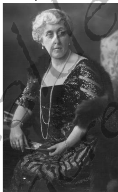
Helena Victoria van Sleeswijk-Holstein-Sonderburg-Augustenburg

De koning kende de titel Zijne (of Hare) Koninklijke Hoogheid en de titel Prins (of Prinses) van Groot-Brittannië en Ierland enkel toe aan de kinderen van de monarch en aan de kinderen van de zonen van de monarch en de oudste levende zoon van de oudste levende zoon van een prins van Wales.