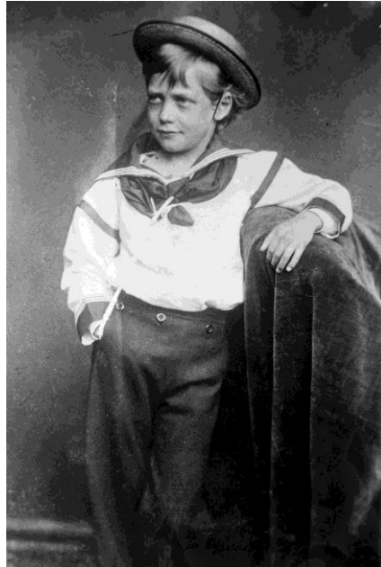
Prins George in 1870, als vijfjarige jongen