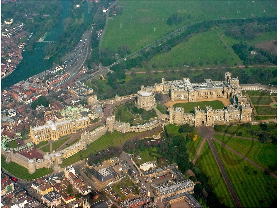
Luchtfoto van Windsor Castle

Als jongere zoon van de prins van Wales werd er niet verwacht dat George ooit koning zou worden. Hij had namelijk een oudere broer, prins Albert Victor, die als tweede in de lijn van troonopvolging stond, na zijn vader.