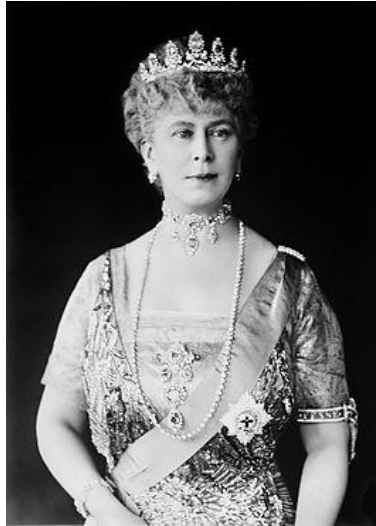
Mary van Teck

Zes weken later stierf Albert Victor aan een longontsteking. Hij liet George achter als volgende in de lijn van troonopvolging. George stopte bij de marine, omdat er van hem werd verwacht een meer politieke rol te gaan spelen.