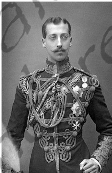
Albert Victor in 1891, een jaar voor zijn dood.

Als jongere zoon van de prins van Wales werd er niet verwacht dat George ooit koning zou worden. Hij had namelijk een oudere broer, prins Albert Victor, die als tweede in de lijn van troonopvolging stond, na zijn vader.