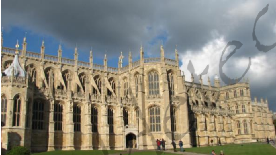
St George's Chapel in Windsor Castle

George stierf om 23.55 uur en werd bijgezet in de St George's Chapel in Windsor Castle.