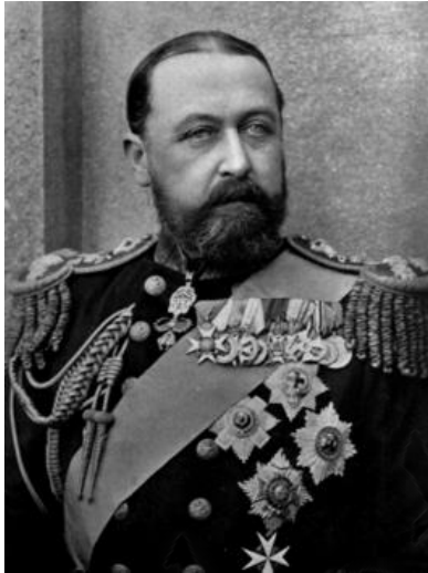
Prins Alfred I, hertog van Edinburgh

Als jongeman was hij bestemd voor de marine. Prins George diende vele jaren onder het gezag van zijn oom, prins Alfred, de hertog van Edinburgh, die was gestationeerd op Malta.