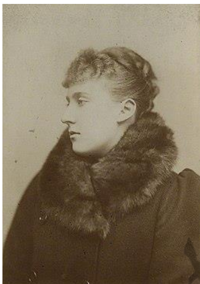
Marie Louise van Sleeswijk-Holstein-Sonderburg-Augustenburg