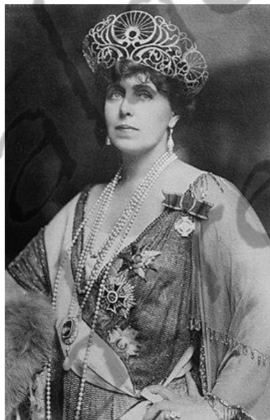
Marie van Edinburgh

Daar bouwde hij een goede band op en werd later verliefd op de dochter van prins Alfred, Marie.