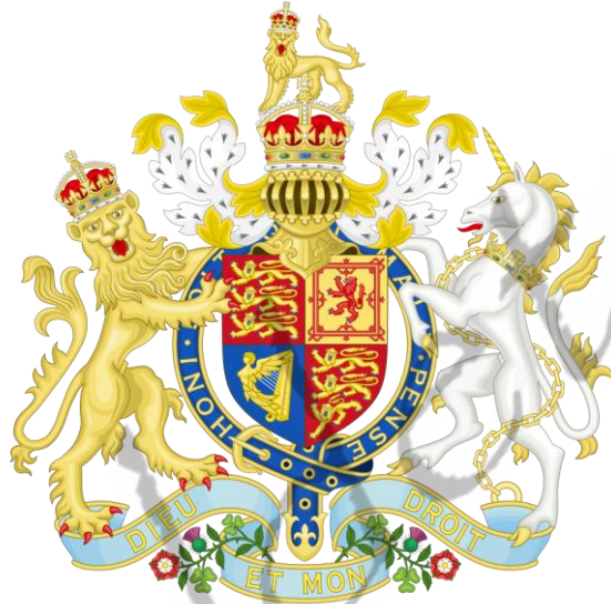
Wapen van het Verenigd Koninkrijk 1837 to 1952