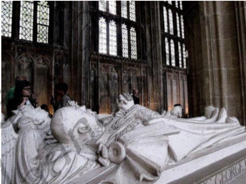
Crypte van George V en zijn vrouw Mary van Teck

Het elkaar zeer toegewijde echtpaar kreeg zes kinderen, vijf zonen en één dochter: