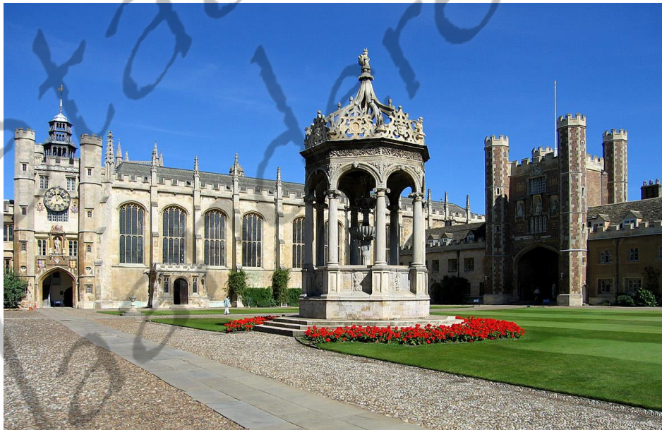
Trinity College (Cambridge)