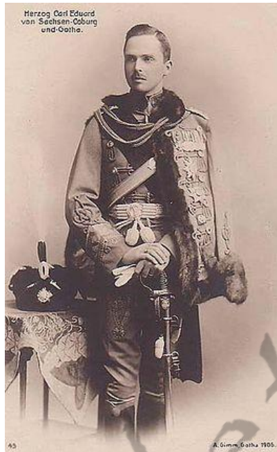
Karel Eduard, Hertog van Saksen-Coburg en Gotha

Een raad die in 1919 werd opgericht bekrachtigde dit feit. George verwijderde ook hun Kousenband-vlaggen uit de St George's Chapel in Windsor Castle onder druk van zijn moeder, koningin Alexandra.