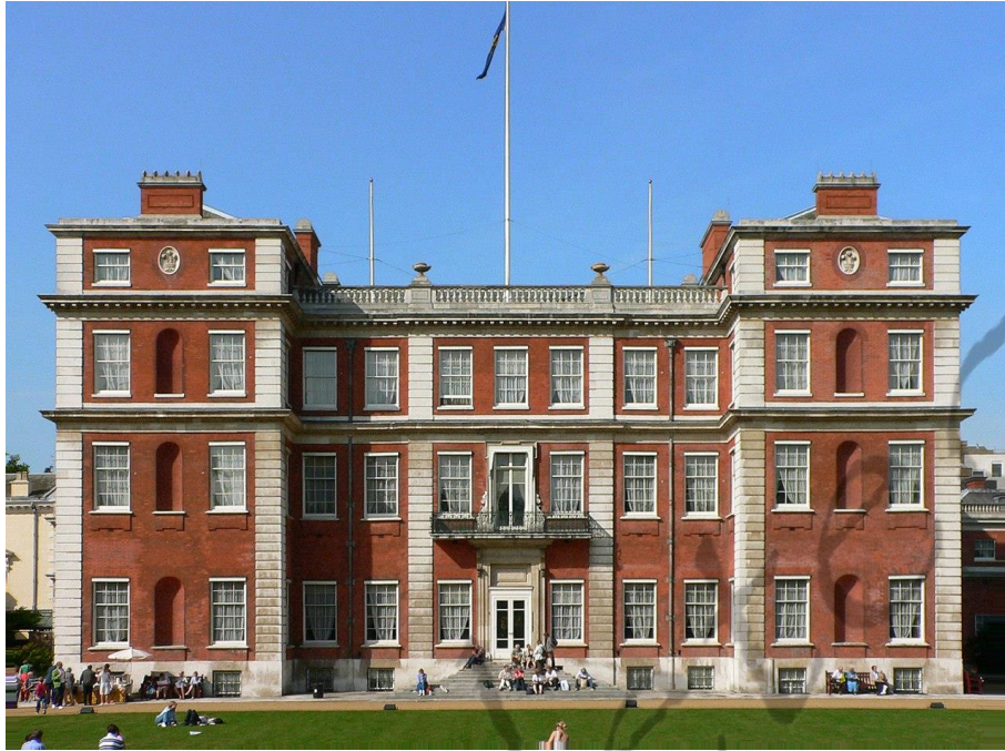
Marlborough House in Londen

Zijn vader was de Prins van Wales (de latere koning Eduard VII), de oudste zoon van koningin Victoria en prins-gemaal Albert van Saksen-Coburg en Gotha. Zijn moeder was Alexandra van Denemarken (later koningin Alexandra), de oudste dochter van koning Christiaan IX van Denemarken en diens vrouw, koningin Louise van Hessen-Kassel.