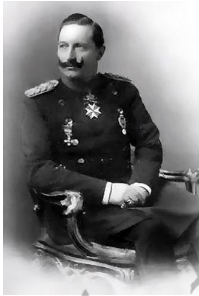
Wilhelm II van Duitsland

Koningin Mary, hoewel Brits net zoals haar moeder, was een dochter van de hertog van Teck, een nakomeling van het Duitse koninklijke geslacht Württemberg.