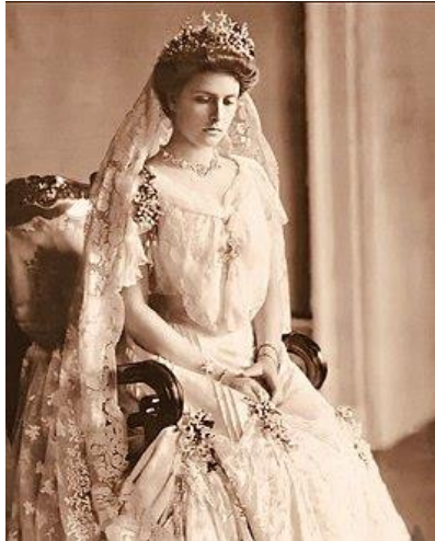
Alice van Battenberg

Philip zou later trouwen met een kleindochter van George, de latere koningin Elizabeth II. Kort voor de dood van George V in 1936 werd de Griekse monarchie in ere hersteld onder koning George II.