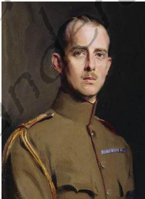
Andreas van Griekenland

Tijdens en na de Eerste Wereldoorlog vielen vele koningshuizen binnen Europa: niet alleen in Rusland maar ook in Oostenrijk, Duitsland en Griekenland terwijl Spanje werd getroffen door een revolutie. De meeste van deze landen werden geregeerd door familieleden van George. In 1922 werd een schip van de Royal Navy naar Griekenland gestuurd om daar zijn neef, prins Andreas van Griekenland, (een zoon van koning George I) en zijn nicht prinses Alice van Battenberg (een dochter van prins Lodewijk Alexander van Battenberg, hij kreeg in 1917 titels in de Britse adel) en hun kinderen onder wie prins Philip te redden.