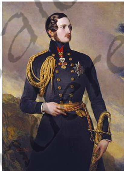
Albert van Saksen-Coburg en Gotha

De koninklijke grootvader aan vaderskant was prins-gemaal Albert van Saksen-Coburg en Gotha en daardoor droegen de koning en zijn kinderen de titels Prins en Prinses van Saksen-Coburg en Gotha en hadden ze de titel Hertog en Hertogin van Saksen.