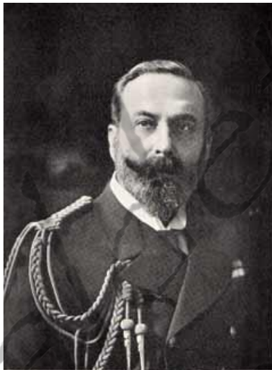
Lodewijk Alexander van Battenberg

Tot slot deed George afstand van het gebruik van alle Duitse titels, en nam hij enkel Brits klinkende achternamen en titels aan. George compenseerde meerdere van zijn mannelijke familieleden door hen Britse titels te geven en ze toe te laten tot de Britse adel. Een neef van hem, prins Lodewijk Alexander van Battenberg, werd in 1917 Lodewijk Alexander Mountbatten, eerste markies van Milford Haven, en zijn zwager Adolf van Teck werd nu Adolphus, eerste markies van Cambridge.