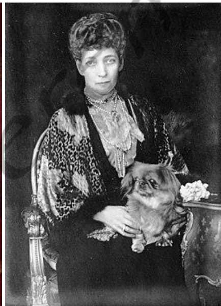
Eduard VII van het Verenigd Koninkrijk en Alexandra van Denemarken

Als kleinzoon van koningin Victoria in mannelijke lijn, kreeg George de volgende titel bij zijn geboorte: Zijne Koninklijke Hoogheid Prins George van Wales.