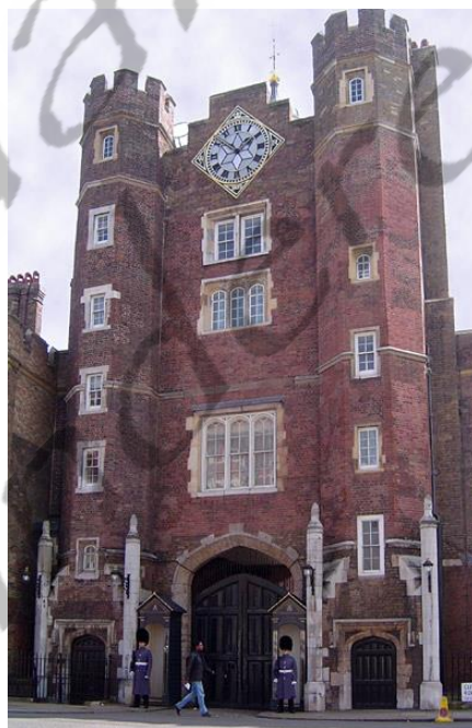
Hoofdingang St. James's Palace

Het huwelijk van George en Mary vond plaats op 6 juli 1893 in de Koninklijke Kapel van het St. James's Palace in Londen.