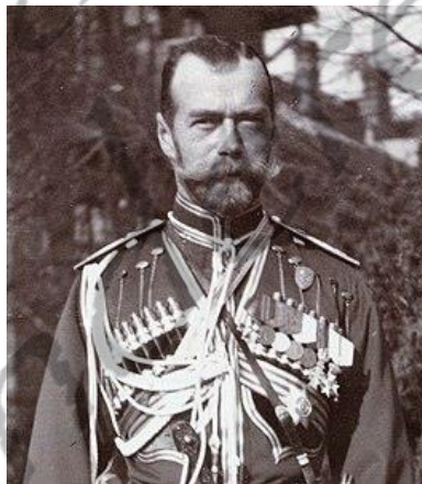
Nicolaas II van Rusland

Toen tsaar Nicolaas II van Rusland, een neef van George via zijn moeder, koningin Alexandra (de moeder van Nicolaas II was tsarina Maria Fjodorovna, de zuster van koningin Alexandra) omwille van Russische Revolutie in 1917 onttroond werd, bood de Britse regering de tsaar en zijn familie asiel aan in Engeland.