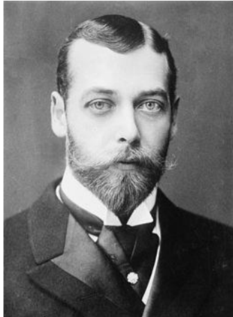
George, als Hertog van York in 1893