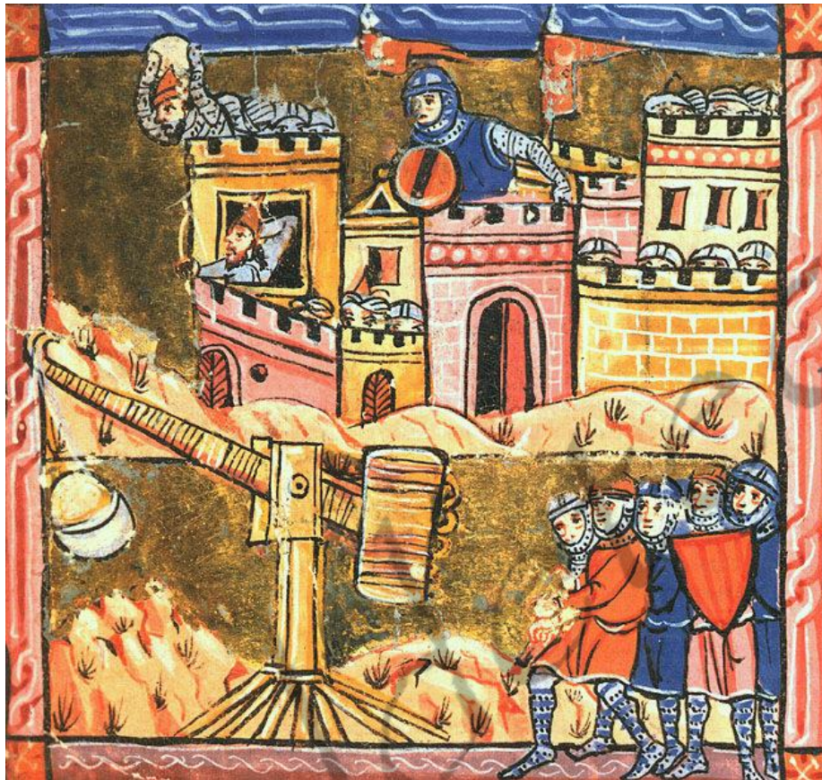
Het Beleg van Akko was de eerste confrontatie van de Derde Kruistocht