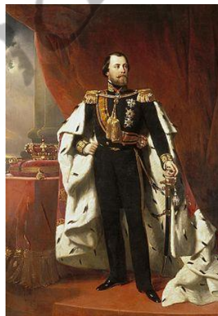
Willem III der Nederlanden

Ook de problemen met zijn oudste zoon, de latere koning Willem III, gingen hem niet in de koude kleren zitten. Kroonprins Willem was het oneens met de grondwetswijziging van 1848, waarmee zijn vader had ingestemd. Hij deed zelfs schriftelijk afstand van zijn rechten op de troon, wat hij later introk.