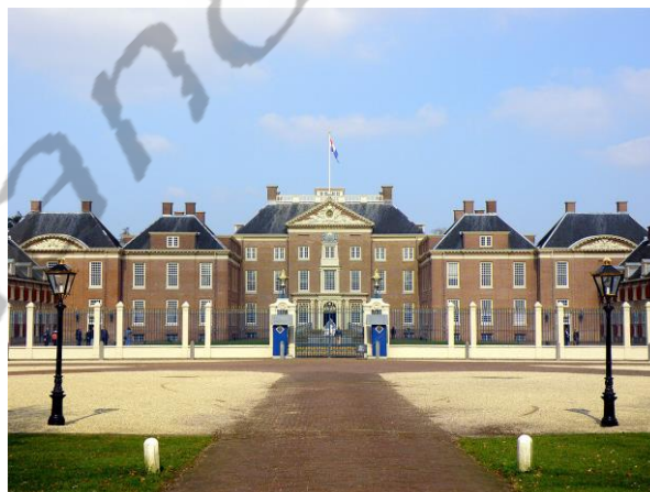
Paleis Het Loo

Rheeburg en Zionsburg in Vught werden aangekocht, maar niet verbouwd of uitgebreid. Er was ook een voor de koning gebouwd gotisch jachthuis in Gorp. In Paleis Het Loo liet de koning weinig sporen na.