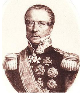
Hendrik George de Perponcher Sedlnitsky

Constant Rebecque (zijn vroegere gouverneur) en de Perponcher over hoe te handelen in het geval van een Franse aanval langs deze route.