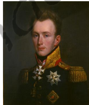
Een jonge Willem II

Zonder dit succes was er geen Slag bij Waterloo geweest. In de Slag bij Waterloo raakte Willem II zwaar gewond aan zijn schouder. De rest van zijn leven werd hij zowel in binnen- als buitenland gezien als een van de grote helden die Napoleon definitief hadden verslagen.