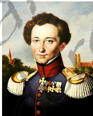
Carl von Clausewitz

Hij had een jongere broer: Frederik (1797-1881), en twee jongere zusters: Paulina (1800-1806) en Marianne (1810-1883). Na de uitroeping van de Bataafse Republiek in januari 1795 vluchtte de gehele stadhouderlijke familie, waaronder de toen tweejarige Willem naar Engeland. Vanaf 1797 verbleef Willem samen met zijn ouders aan het hof van de koning van Pruisen in Berlijn. Hier werd hij van 1803 tot 1809 opgeleid aan de militaire academie. Een van de leraren verbonden aan deze academie was Carl von Clausewitz. Willem raakte hier goed bevriend met de Pruisische prins.