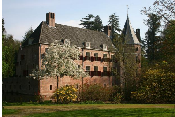
Kasteel Het Oude Loo in 2010.

Hij woonde op het nabijgelegen jachtslot, het Kasteel Het Oude Loo, dat meer aan zijn voorkeur voor de neogotiek beantwoordde.