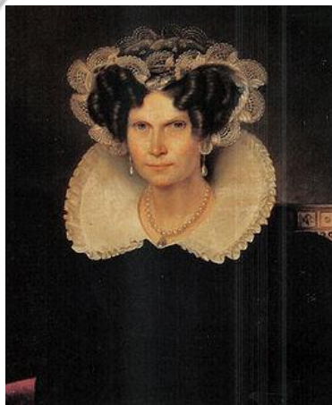
Willem I der Nederlanden en Wilhelmina van Pruisen