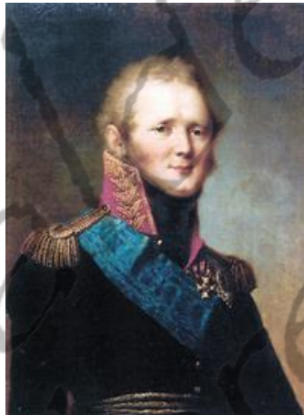
Tsaar Alexander I

Willems zwager, tsaar Alexander I, kwam via zijn zuster het plan te weten en lichtte koning Willem I in.