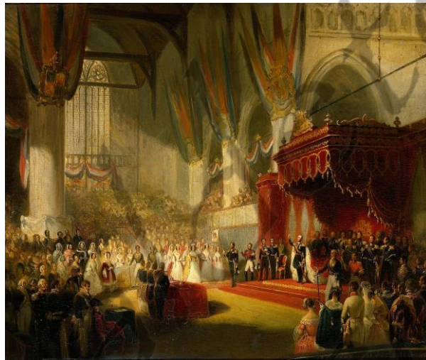
De inauguratie van koning Willem II in de Nieuwe Kerk.

Op 7 oktober 1840 besteed hij -bijna 48 jaar oud- de troon als Willem II. De inhuldigingsplechtigheid vond plaats op 28 november 1840 in de Nieuwe Kerk in Amsterdam. Daarmee is hij tot op heden bij aantreden het oudste Nederlandse staatshoofd. Onder zijn koningschap was de macht van de vorst al minder dan voordien. De revoluties van 1848 en 1849, waarin Lodewijk Filips I van Frankrijk werd afgezet en andere Europese vorsten met geweld tot concessies werden gedwongen, deden hem vrezen voor zijn troon. Als grap zei de koning tegenover diplomaten, dat hij in één nacht van conservatief verworden was tot liberaal. Dat was vooral de verdienste van de liberaal Thorbecke, die de Grondwetsherziening van 1848 bijna volledig had geschreven.