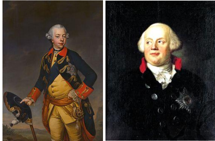
Willem V en Frederik Willem II van Pruisen

Zijn grootvaders waren de heersende stadhouder Willem V en de Pruisische koning Frederik Willem II van Pruisen.