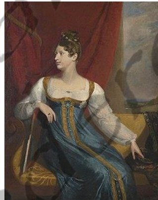
Engelse kroonprinses Charlotte

Hier maakte hij in 1812 onder andere de zeer bloedige bestorming van het fort van Badajoz en de succesvolle Slag bij Salamanca mee. Hij ontsnapte meermalen maar nipt aan de dood. De reden dat zijn vader zulke ongebruikelijk grote risico's met het leven van de troonopvolger nam, was gelegen in het feit dat Willem de laatste troefkaart was, waar de Oranje-dynastie nog over kon beschikken in een poging om weer een vooraanstaande rol op het Europees toneel te gaan spelen. Het plan was om Willem te laten trouwen met de Engelse kroonprinses Charlotte.