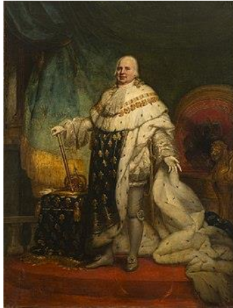
Lodewijk XVIII van Frankrijk

Nederland bij Frankrijk wilden voegen. Willem werd de kandidaat van deze rattachisten om koning Lodewijk XVIII op te volgen.