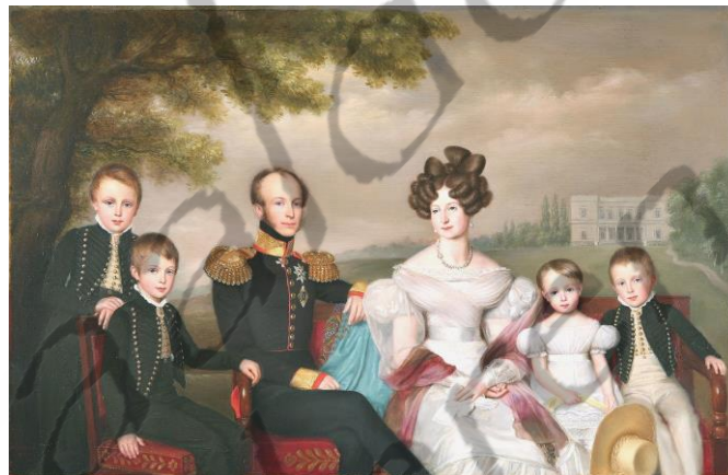
Koning Willem II en zijn jonge gezin. Van links naar rechts: prins Willem, prins Alexander, koning Willem II, koningin Anna, prinses Sophie en prins Hendrik.

De homoseksuele relaties die Willem II als kroonprins en koning onderhield, werden door onder anderen Eillert Meeter beschreven. De koning zou zich hebben omringd met dienaren die hij niet kon ontslaan vanwege wat Meeter de "afschuwelijke motieven" noemde, waarvoor hij hen had aangenomen. Historici hebben Meeter meer dan een eeuw voor leugenaar uitgemaakt, maar in 2004 bleek uit documenten in het Koninklijk Huisarchief dat hij de waarheid heeft geschreven.