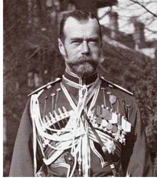
Nicolaas II van Rusland

Tijdens zijn korte presidentschap ontving president Félix Faure in 1896 tsaar Nicolaas II in Parijs om de vriendschap tussen de twee landen te bezegelen (Russisch-Franse Alliantie).