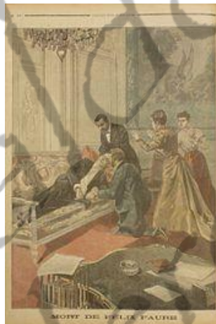
De dood van Félix Faure in het Elysée-paleis (illustratie gepubliceerd in Le Petit Journal in 1899).

Al vlug deed het gerucht de ronde dat de president was vergiftigd door aanhangers van Dreyfus.