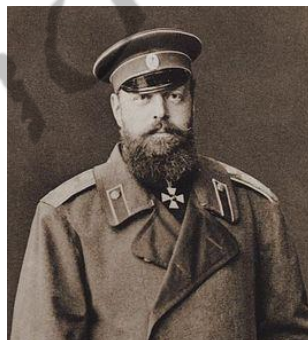
Alexander III van Rusland

Het daaropvolgende jaar bracht Faure een tegenbezoek aan de tsaar in Sint-Petersburg. Aan het einde van Faures presidentschap bereikte de Dreyfusaffaire haar hoogtepunt. President Faure koos min of meer de kant van de anti-Dreyfusards (hij was tegen de heropening van de zaak).