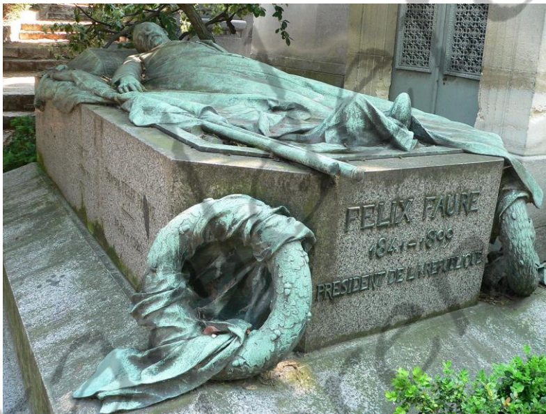
Graftombe op de begraafplaats Père-Lachaise