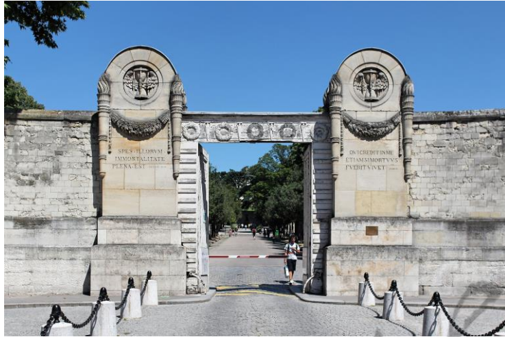
Ingang van de begraafplaats Père-Lachaise