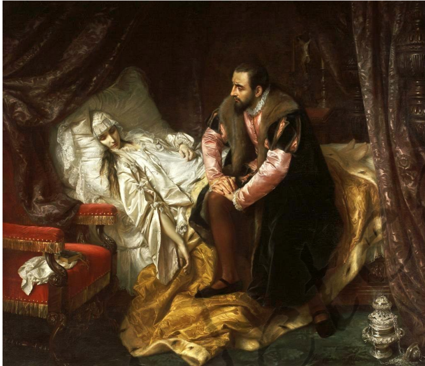
De dood van Barbara Radziwiłł

Sigismund August verwierf met de Unie van Wilno in 1561 Lijfland en het leenheerschap over Koerland. De Lijflandse Oorlog met Rusland deed Sigismund besluiten, teneinde zijn macht te versterken, al zijn landen onder de Poolse kroon te verenigen. Dit geschiedde in 1569 met de Unie van Lublin, die Polen en het Groothertogdom Litouwen verenigde in het Pools-Litouwse Gemenebest. Hijzelf werd hiervan het hoofd. Dit was dan ook zijn grootste politieke succes.