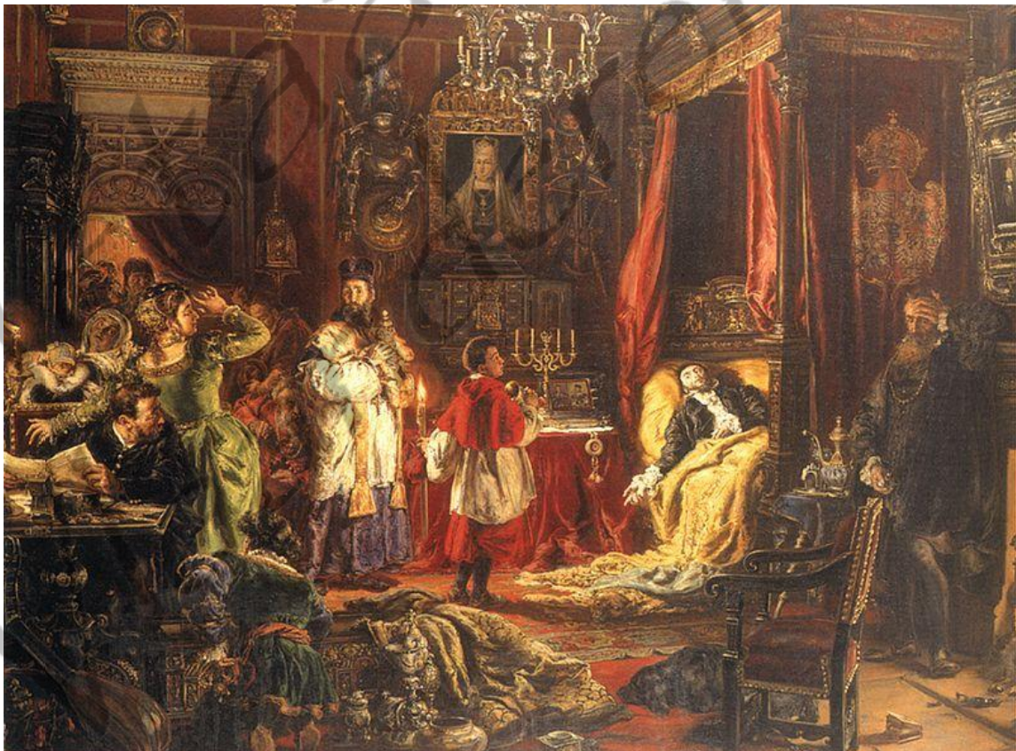
De dood van Sigimund II August in Knyszyn, door Jan Matejko