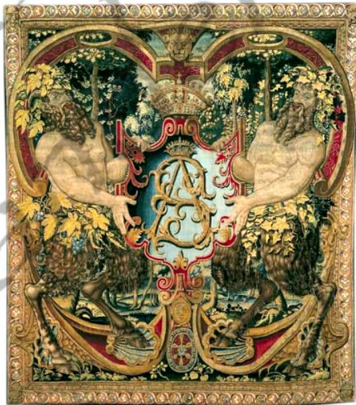
Tapijt met het Koninklijk monogram SA geweven in Brussel rond 1755

Hij stierf in 1572 kinderloos, waarna de Franse prins Hendrik van Valois tot koning werd gekozen.