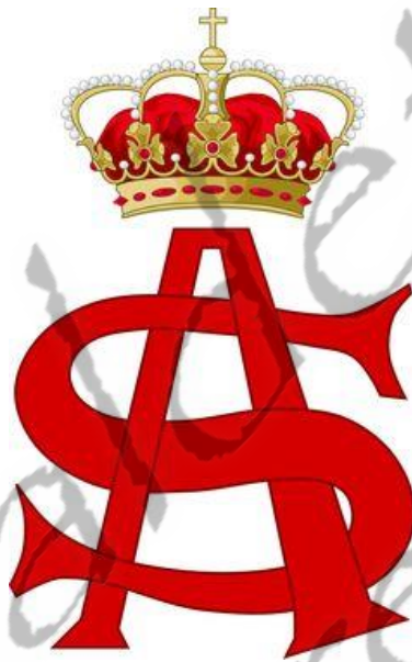
Monogram van Koning Sigismund II August van Poland