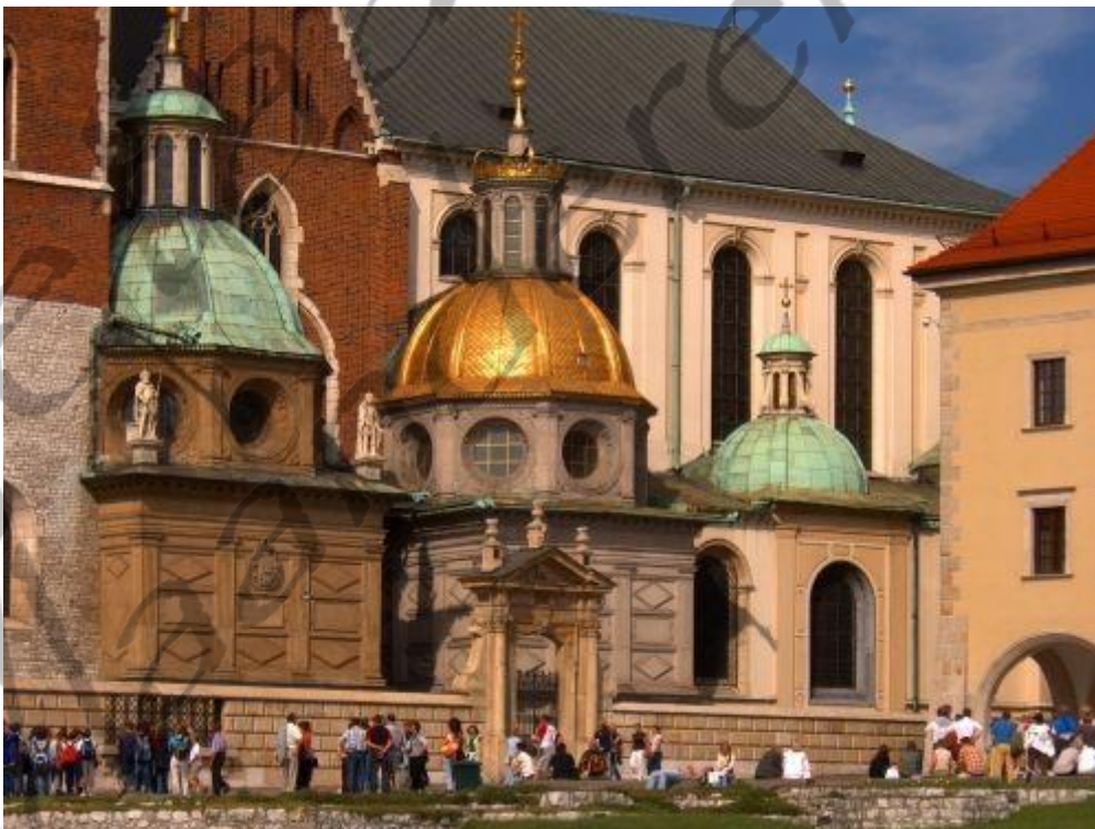
Sigismundkapel in Krakau