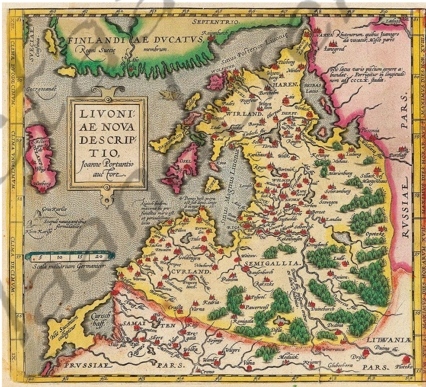
Kaart van Lijfland uit het eind van de 16de eeuw

Sigismund August verwierf met de Unie van Wilno in 1561 Lijfland en het leenheerschap over Koerland. De Lijflandse Oorlog met Rusland deed Sigismund besluiten, teneinde zijn macht te versterken, al zijn landen onder de Poolse kroon te verenigen. Dit geschiedde in 1569 met de Unie van Lublin, die Polen en het Groothertogdom Litouwen verenigde in het Pools-Litouwse Gemenebest. Hijzelf werd hiervan het hoofd. Dit was dan ook zijn grootste politieke succes.