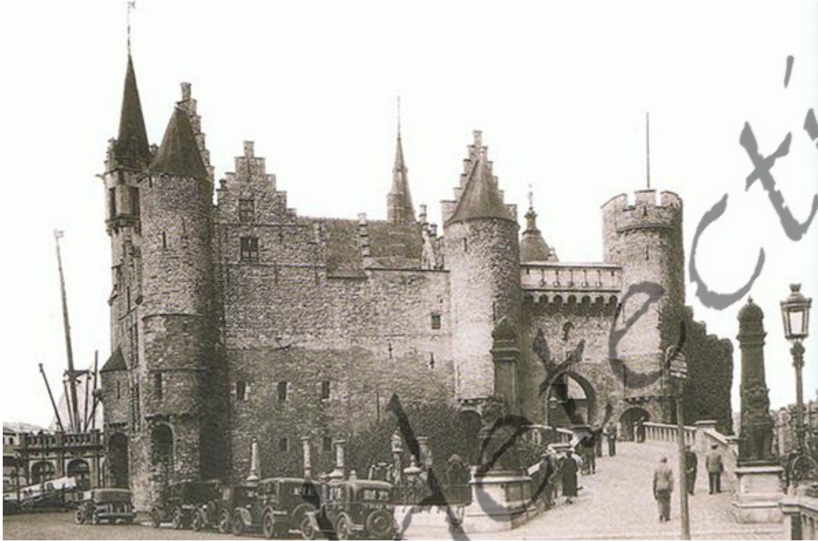
Een vegeelde postkaart van het Steen in Antwerpen, ooit gebouwd als verdediging van de Schelde. Tot voor kort was het in gebruik als Nationaal Scheepvaartmuseum.

De strijd tussen Vlaanderen en Neder-Lotharingen, en ruimer tussen de Franse en de Duitse koningen, leidde tot de oprichting van versterkte burchten langsheen de Schelde rond 970. Drie ervan zijn bekend: Antwerpen, Ename (bij Oudenaarde) en Valenciennes, maar ongetwijfeld lagen er daar nog kleinere tussen, gecontroleerd door feodale heren van lagere rang. Sporen van de Antwerpse versterking zijn nog gedeeltelijk bewaard nabij het Steen.