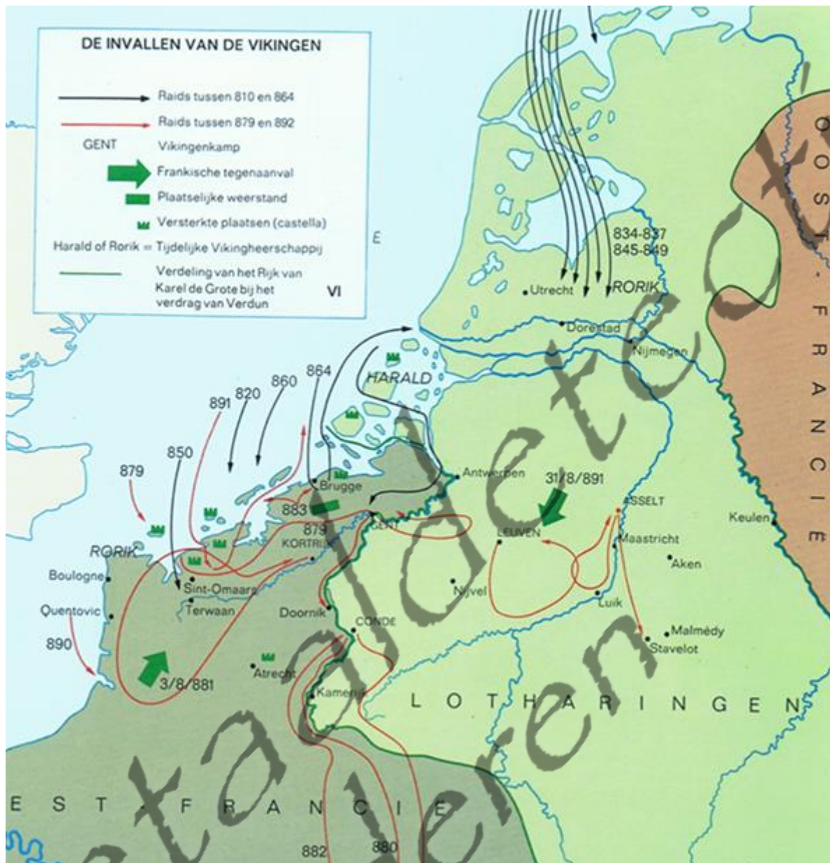
Kaart van de invallen van de Vikingen in onze streken in de periode 810-892.

De verkenningsstochten van de Vikingen brachten hen tot op de oevers van Canada en via Rusland ook tot in Constantinopel. In onze contreien voeren ze vooral de mondingen van de rivieren op, op zoek naar buit. De historische verslagen uit die tijd, wijzen vooral op hun verwoestingen, zeer vaak met de nodige overdrijvingen. Men kan niet om de haverklap een nederzetting compleet platbranden en beroven; zoveel welstand was er nu ook weer niet. Wellicht had hun komst een gemengde bedoeling, vooral om handel te drijven en als dat niet lukte, dan maar plunderen. Die plunderingen hebben trouwens een nieuw elan gegeven aan de handel op lange afstand en dus van circulatie van rijkdommen. Zo werden verschillende muntschatten uit het Middellandse-Zeegebied opgegraven en de uit abdijen geroofde gouden voorwerpen kregen in versmolten vorm zeker een nieuwe bestemming.