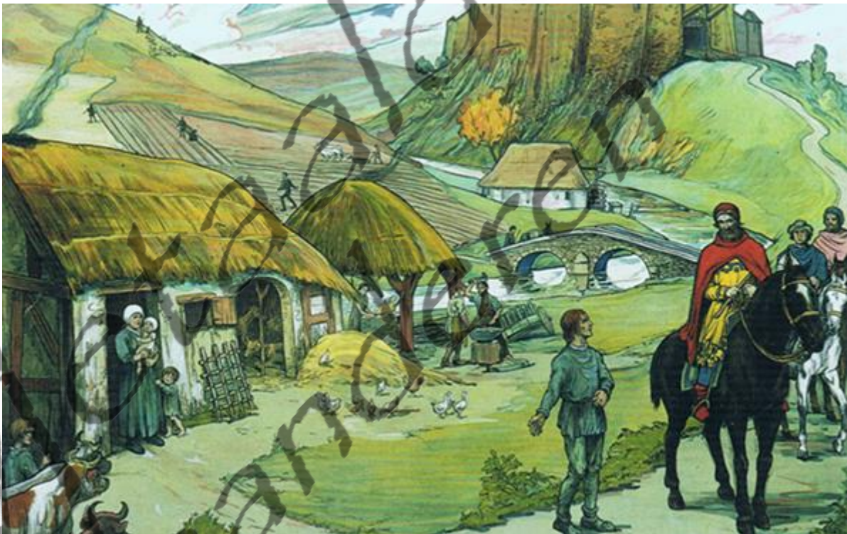
Schoolplaat door Edmond Van Offel met een voorstelling van lijfeigenen die groeten als hun heer langsrijdt.

Het leenstelsel was gegroeid uit de oude traditie van trouw van een vazal aan een heer, een clanleider, die dan voor bescherming zorgde. De heer betaalde bepaalde diensten met geld, en bij gebrek daaraan met landerijen. Hij die domeinen kreeg en trouw zwoer was de 'leenman'; hij die gaf de 'leenheer'.