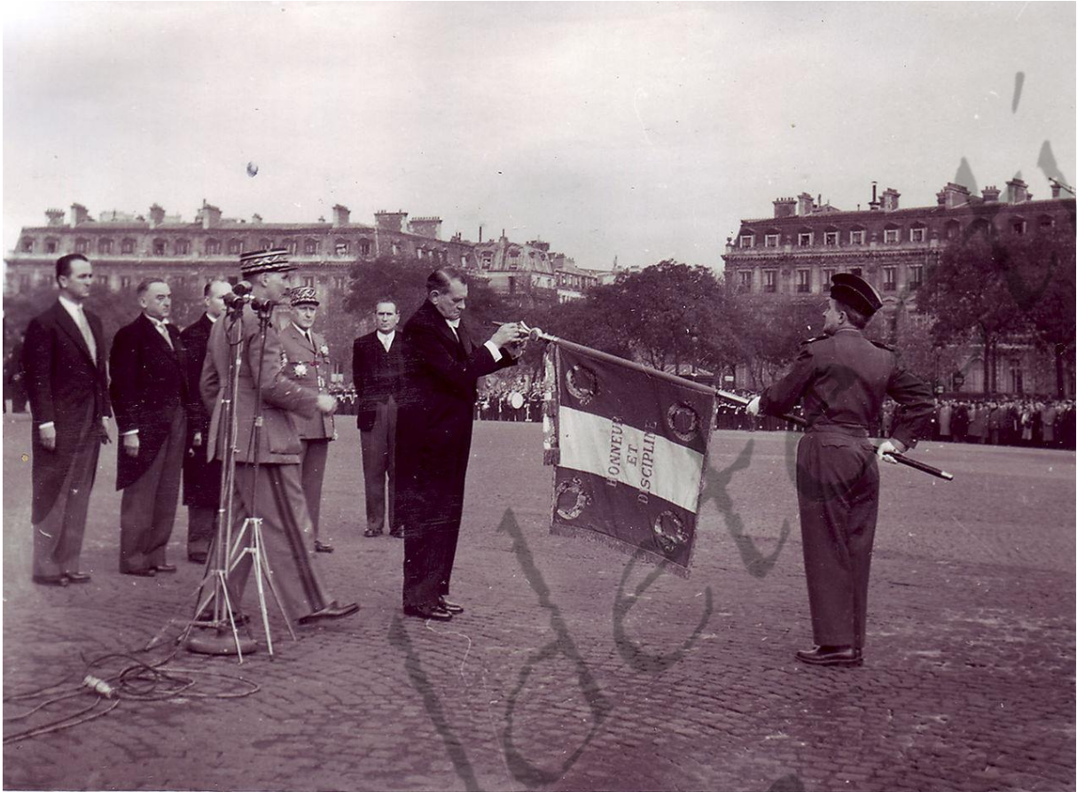
René Coty, tweede van rechts tijdens de Prytanée National Militaire