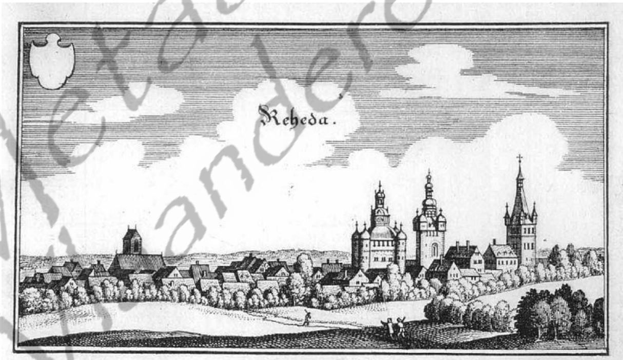
Rheda in de 17e eeuw