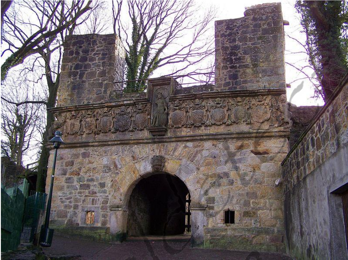
Mauritztor de Burg Tecklenburg. In het midden van het wapen is Minerva te zien die de beschermgodin van de graven van Tecklenburg was