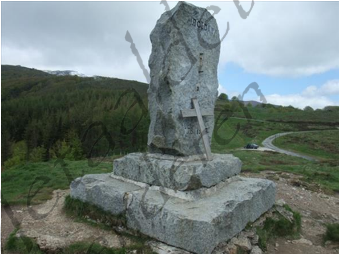
Gedenkteken voor Roeland te Roncesvalles (Navarra, Spanje).

Het eerste contact tussen Karel en de islamitische wereld liep uit op een militaire catastrofe in 778 bij Roncesvalles. In het oosten van het islamitische kalifaat regeerde na een bloedige vete met de Omajjaden de dynastie van de Abbasiden. Het kalifaat had tegen het eind van de zevende eeuw het voormalige Perzische rijk van de Sassaniden veroverd, alsook de oost- en zuidkusten van de Middellandse Zee en de vruchtbare sikkkel van Noord-Afrika, en was in 711 naar het Iberische schiereiland overgestoken. Sinds de oprichting van Bagdad was het tweestromenland tussen Tigris en Eufraat de kern van het rijk geworden en was het zwaartepunt van Damascus naar het binnenland