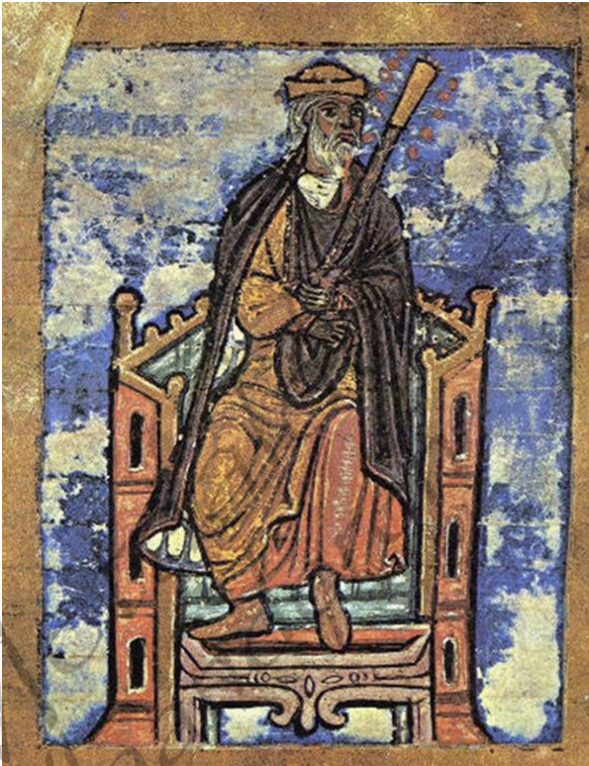
Koning Alfonso II van Asturië (bijgenaamd "de kuise") was koning van Asturië van 791-842.

De verhouding met het koninkrijk Asturië evolueerde, ondanks de smadelijke nederlaag, positief. In elk geval vernemen we uit de biografie van Einhard dat koning Alfonso 'de Kuise' zichzelf tegenover Karel 'geheel de Uwe' noemde en op die manier de verre en machtige koning in zekere zin als zijn meerdere erkende. Karel nam in Aquitanië wel geloofsvluchtelingen uit het Spaanse grensgebied op,