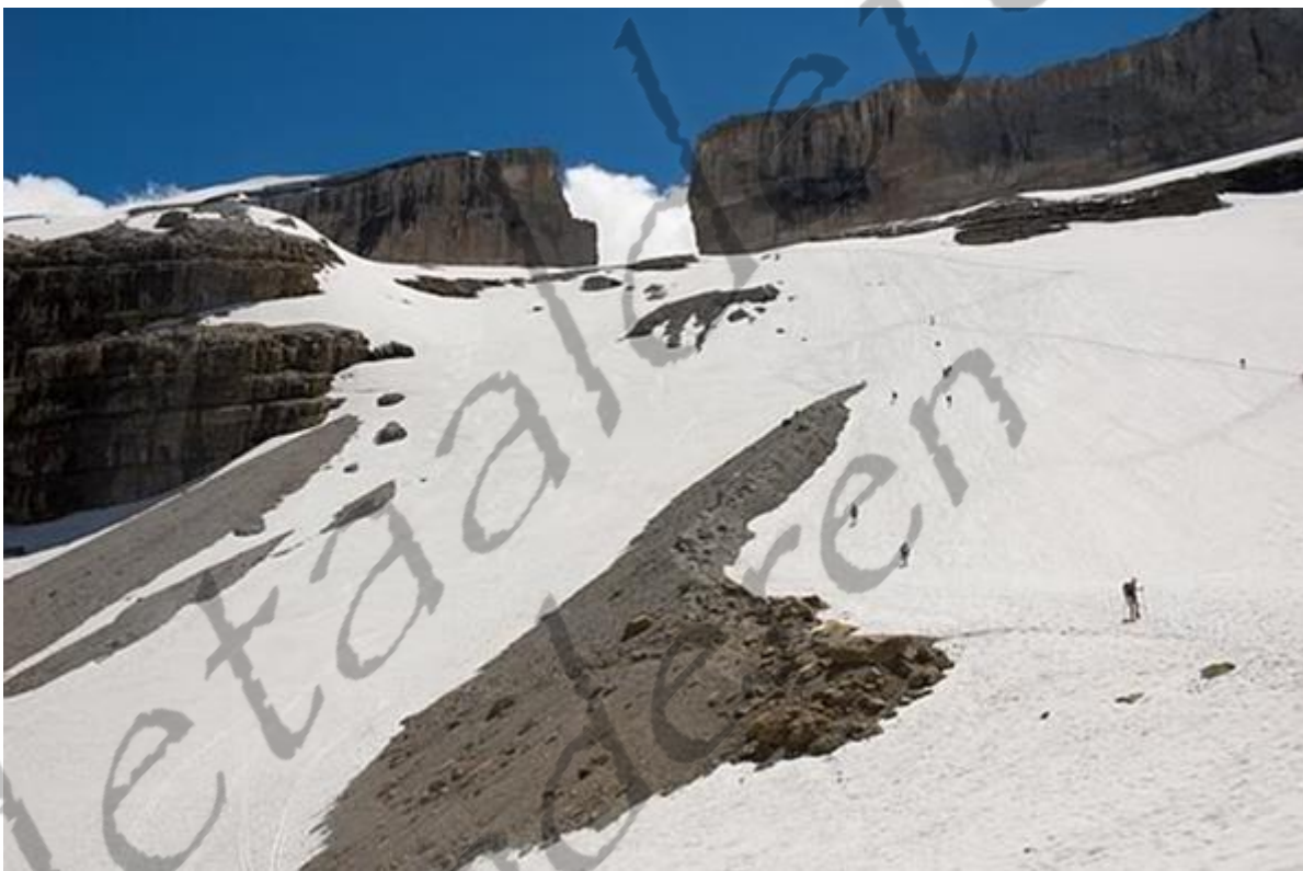
De Pas boven Roncesvalles waar Roeland de dood vond. De inham in de rotswand zou volgens de legende uitgehakt zijn door Roeland zelf met zijn zwaard Durendal (wat hoogst onwaarschijnlijk is).

Frankische leger rukte op in twee colonnes. De eerste, waar ook Beieren en Langobarden (!) bij behoorden, nam de kustweg via Narbonne en Saragossa. De tweede colonne, die door de koning werd geleid, trok dwars door Aquitanië en trok over de pas Ibenuta, boven Roncesvalles, in de richting van de Ebro. De ontvangst aan de overkant van de Pyreneeën was allesbehalve bemoedigend. Voor de doortocht naar Saragossa moest Pamplona worden veroverd, dat deel uitmaakte van het bij Asturië horende Navarra. Op de linkeroever van de Ebro kwamen de twee legers bij elkaar. Saragossa kon niet worden bezet en aan overgave van de stad viel zelfs niet te denken. Er werden hooguit enkele belangrijke gijzelaars gesteld door de stedelijke overheid. Het verbond van de stadhouders tegen de emir van Cordoba viel uit elkaar nog voor het iets had bereikt. De Frankische intocht liep uit op een fiasco in plaats van op een spectaculaire overwinning met een omvangrijke buit. De officiële Frankische bronnen uit die tijd behandelen de hele kwestie dan ook heel discreet en omzichtig. Einhard was de eerste die het aandurfde om na jarenlange stilte details over de mislukte veldtocht mee te delen.