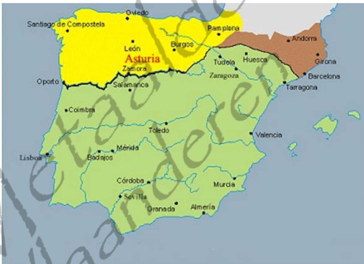
Kaart van Spanje in de 8e eeuw: de islamitische verovering van het Visigotische koninkrijk, bracht het schiereiland grotendeels onder islamitische heerschappij, met uitzondering van het uiterste noorden, de gebieden Galicië, Asturië, Cantabrië en Baskenland.

al-Andalus - de resten van het Westgotische rijk hadden weten in te palmen en kort daarna het emiraat van Cordoba hadden gesticht. Het opkomende emiraat werd voornamelijk bedreigd door het eigenmachtige optreden van de stadhouders in het dal van de Ebro, die zich probeerden te onttrekken aan de centrale macht en daarbij op zoek waren naar bondgenoten. Afgezanten van de machthebbers van Gerona en Barcelona waren dan ook verschenen op de rijksdag in Paderborn en hebben Karel kunnen overhalen om over de Pyreneeën op oorlogsexpeditie te trekken, waardoor hij de Frankische invloed in de grensstreek, tot ver over Narbonne zou kunnen verstevigen. Op die manier zouden ook de contacten met het koninkrijk Asturië, het laatste christelijke bastion ten zuiden van het gebergte in het noordwesten van Spanje, kunnen worden versterkt. Het zou zelfs mogelijk worden om in Navarra en Gascogne controle uit te oefenen over de Basken, een volk dat aan beide kanten van de Pyreneeën was gevestigd, en tot op vandaag wordt gekenmerkt door een eigen taal, cultuur en sterke onafhankelijkheidsdrang.