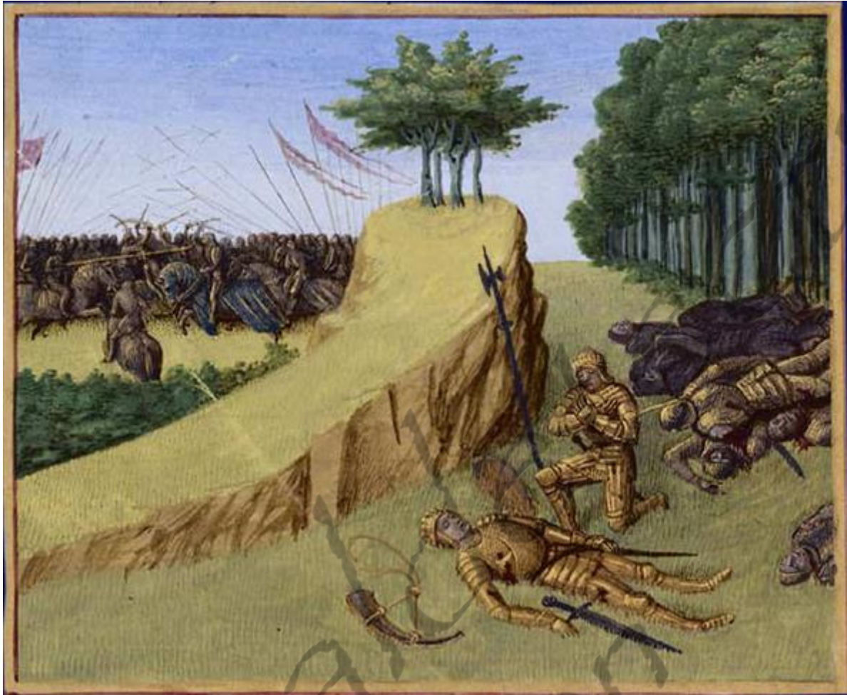
Afbeelding die de dood van Roeland voorstelt.

De gebeurtenis moet een verpletterende indruk hebben gemaakt op de koning en de legerleiding. Zelfs Napoleon wist dat wettelijke koningen wel eens een gevecht konden verliezen zonder daarbij al te veel gezichtsverlies te lijden, maar voor ambitieuze heersers die wilden uipakken met hun macht was dat uit den boze! In de later aangepaste versie van de zogenaamde rijksannalen staat vermeld dat dit verlies als een wolk een schaduw gooide in het hart van de koning over een groot deel van de Spaanse overwinningen. Een duidelijk eufemisme: er waren geen politieke successen geboekt, en het kon zelfs niet tot een gevecht met de Basken komen.