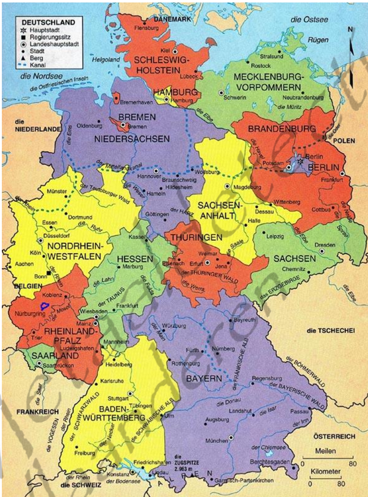
Kaart van Duitsland met rechtsonderaan Beieren (Bayern).

Dat hertogdom had sinds de ambtsperiode van hertog Theodo († 717/718), die zijn rijk als een koning tussen zijn twee zonen verdeelde, een onafhankelijke status verkregen. Het hertogdom had in het bewustzijn van de Beieren niet langer een ambtelijk karakter. Ondanks het ontbreken van een titel had de dubbele verwantschap met de opkomende hofmeiers hen van hun evenwaardigheid overtuigd. Karel Martel, de grootvader van Karel, had namelijk een verhouding met de Agilolfingische