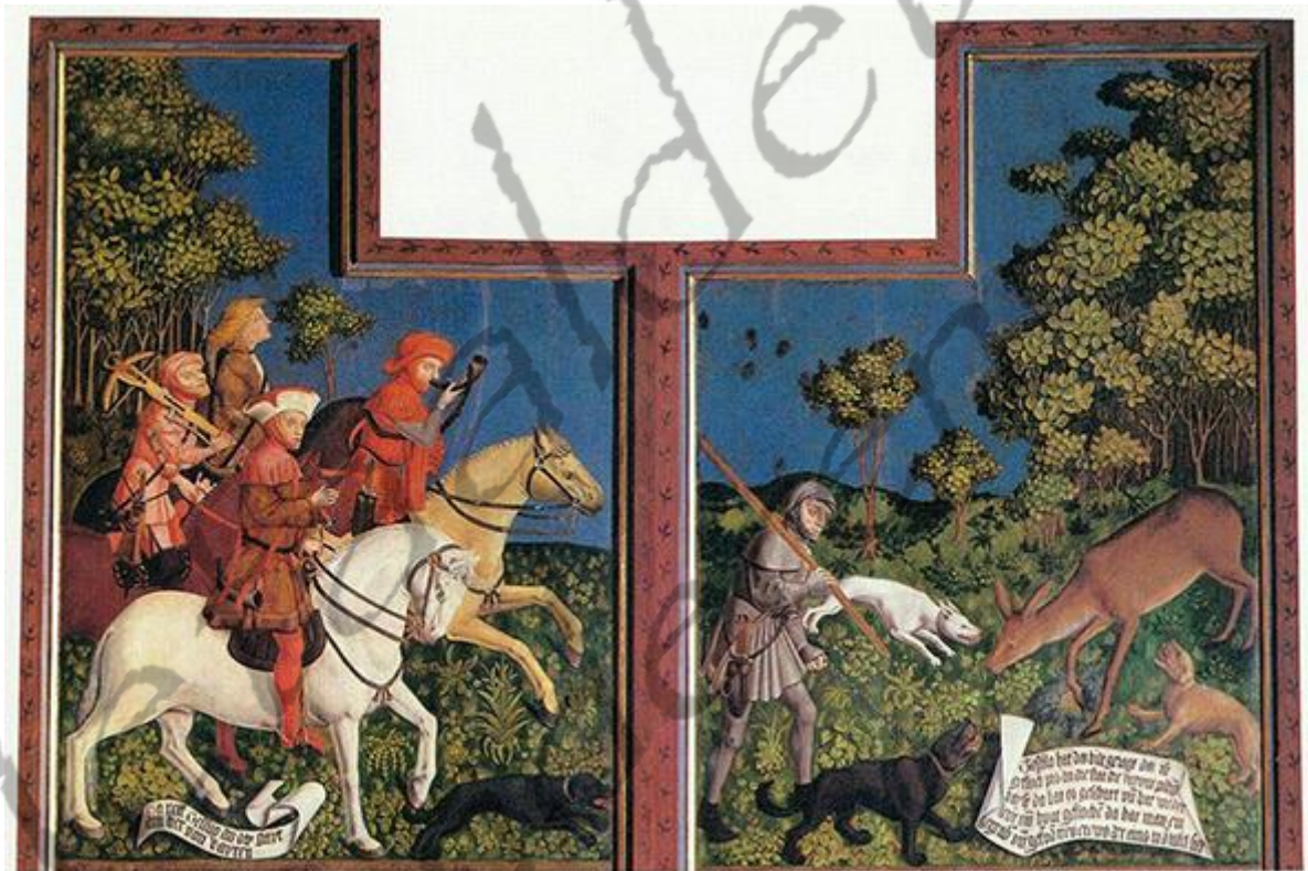
Jachttafereel met afbeelding van Tassilo III, hertog van Beieren en volle - in ongenade gevallen - neef van Karel de Grote.

Misschien klinkt het vreemd dat de relatie tussen de Frankische vorst en Beieren onder het hoofdstuk 'buitenlandse politiek' wordt behandeld, aangezien Beieren toch een zwaargewicht onder de 'duitsche landen' in het middeleeuwse koninkrijk was. Het hertogdom Beieren werd in die tijd inderdaad ook als ondergeschikt aan het Frankische kernrijk beschouwd. Beieren was een van de hertogdommen uit de Merovingische periode, die niet in laatste instantie door de ondergang van het eerste Frankische koningshuis een quasi autonome status hadden verworven. Reeds ten tijde van de Arnulfingisch-Pippijnse hofmeiers werd de macht van de hertogen ingeperkt en zelfs compleet afgebroken, met uitzondering van Beieren. Zo werd Thüringen in 717-719 aan de centrale Frankische macht onderworpen en het Agilolfingische hertogdom Alemannië hield na ruim honderd jaar op te