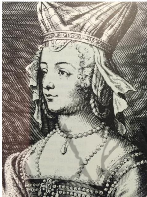
Hertogin van Brabant en Limburg