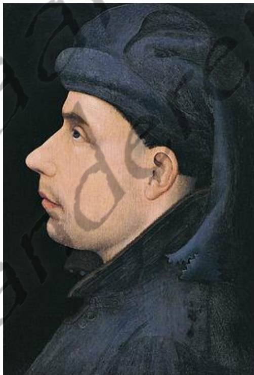
Wenceslaus I van Luxemburg

Na het overlijden (1345) van haar eerste gemaal hertrouwde zij in 1354 met Wenceslaus I van Luxemburg.