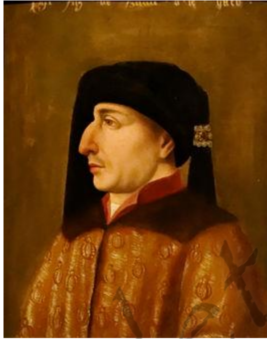
Filips de Stoute

In de Slag bij Niftrik ( 30 juli 1388 ) wisten driehonderd Gelderse ruiters, versterkt met vierhonderd haastig bewapende burgers van Nijmegen, een Brabants invasieleger van 10.000 man te verslaan. Filips de Stoute liet in 1390 zijn vrouw Margaretha van Male (dochter van Johanna's jongere zus) als haar erfgenaam erkennen, maar slaagde er pas in 1404 in om zijn tweede zoon Antoon van Bourgondië als ruwaard in Brabant te doen aanvaarden. In 1399 verleende Johanna Oss stadsrechten.