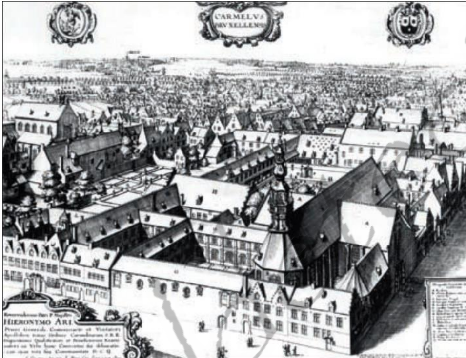
Karmelietenklooster van Brussel

Johanna stierf in 1406 en werd begraven in de karmelietenkerk van Brussel, waar Filips de Goede in 1458 een grafmonument voor haar liet plaatsen (een werk van Jean Delemer, Jacob van Gerines en Rogier van der Weyden dat teloor ging in de bombardementen van 1695).