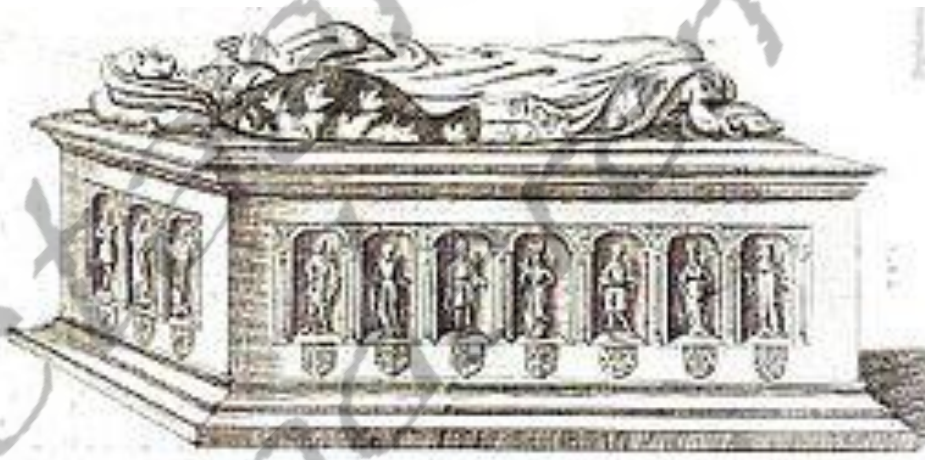
Het graf van Johanna van Brabant in 1641