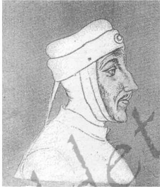
Lodewijk II van Male

instemmingsrecht in. De erfopvolging werd echter betwist door haar zwagers Lodewijk II van Male, graaf van Vlaanderen, en Reinoud III van Gelre, hertog van Gelre, en één en ander leidde tot de Brabantse Successieoorlog. Deze 'familieruzie' werd bijgelegd met de vrede van Aat.