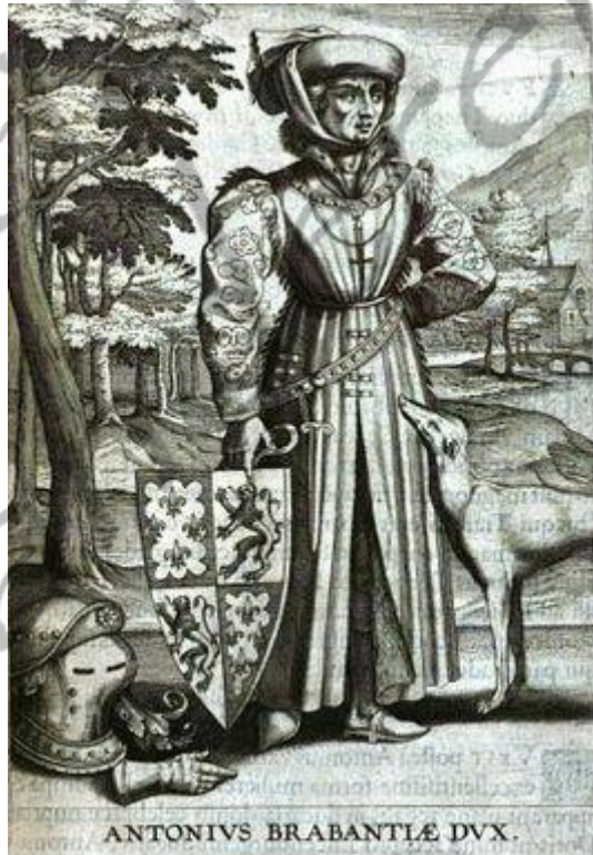
Antoon van Bourgondië

In de Slag bij Niftrik ( 30 juli 1388 ) wisten driehonderd Gelderse ruiters, versterkt met vierhonderd haastig bewapende burgers van Nijmegen, een Brabants invasieleger van 10.000 man te verslaan. Filips de Stoute liet in 1390 zijn vrouw Margaretha van Male (dochter van Johanna's jongere zus) als haar erfgenaam erkennen, maar slaagde er pas in 1404 in om zijn tweede zoon Antoon van Bourgondië als ruwaard in Brabant te doen aanvaarden. In 1399 verleende Johanna Oss stadsrechten.