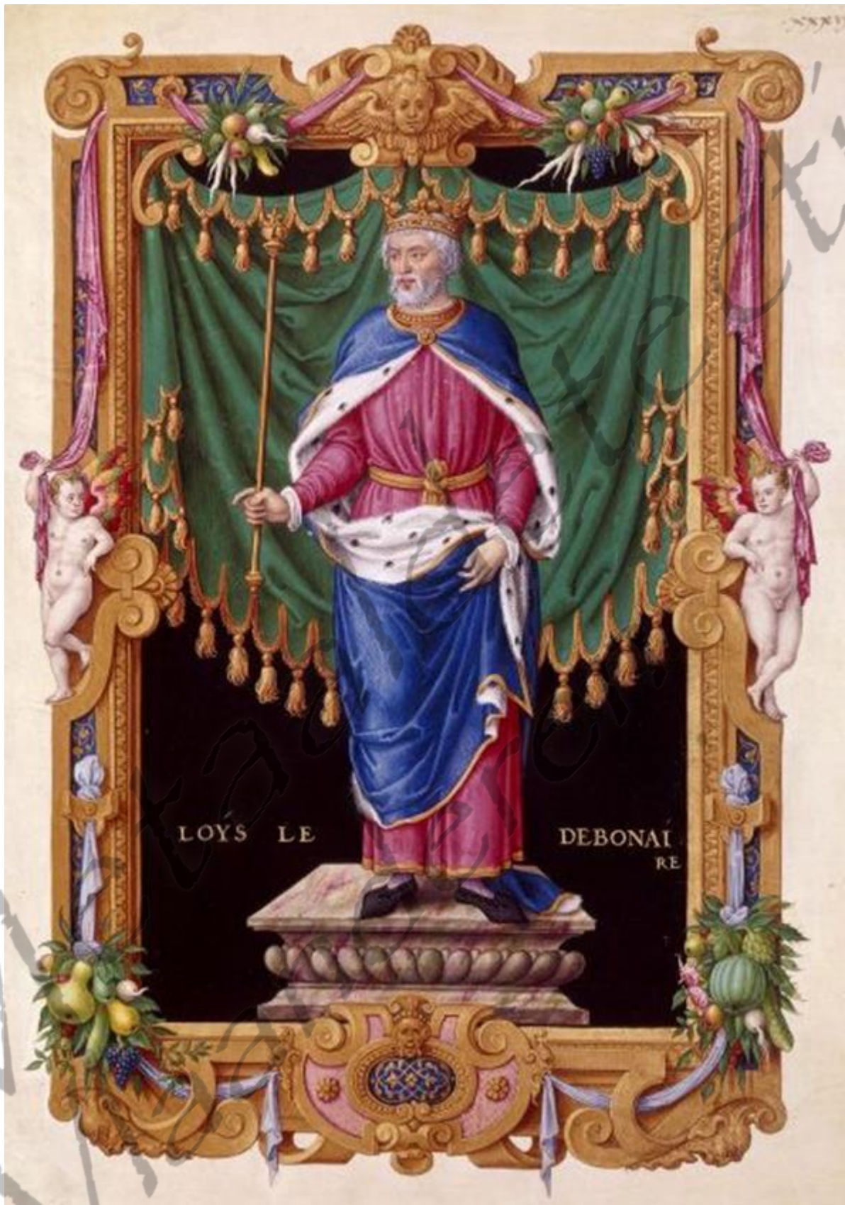
Afbeelding van Lodewijk de Vrome, de uiteindelijke opvolger van Karel de Grote. In zijn politieke testament daterend uit 806, verdeelde Karel zijn rijk onder zijn drie oudste zonen uit zijn huwelijk met