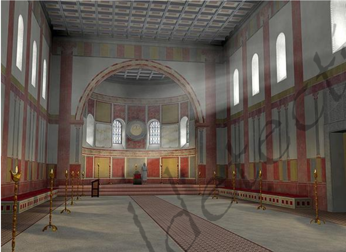
Digitale reconstructie van de Aula Regia in de Keizerspalts van Ingelheim.

Een status van 'antieke' stad probeerde ook Ingelheim uit te stralen, dat met zijn paleiszaal (foto hierboven) met concha (halfcirkelvormige koepel), exedra (nissen met verhoogde zitplaats) en zuilengang de bouwstijl van de keizerlijke basiliek van Trier probeerde te evenaren. Over Nijmegen, dat door Einhard als derde opmerkelijke stenen bouwwerk van Karel wordt geroemd, valt door de vernietigingen weinig te zeggen. Een kostbare getuigenis van de receptie van klassieke Romeinse architectuur gecombineerd met christelijke sacrale bouwstijlen is de zogenaamde poorthal van Lorsch, met op de benedenverdieping een Romeins drieledig poortgewelf en daarboven een kapel. Het klooster Lorsch was eigendom van de koning en een cultuurcentrum bij uitstek, waarbinnen een belangrijk scriptorium en een grote bibliotheek zich ontplooiden. De versieringen van het gebouw, de randversieringen van de consoles, pilasters en kapitelen, is meesterlijk ontleend aan antieke voorbeelden en bestaat gedeeltelijk uit authentieke Romeinse elementen.