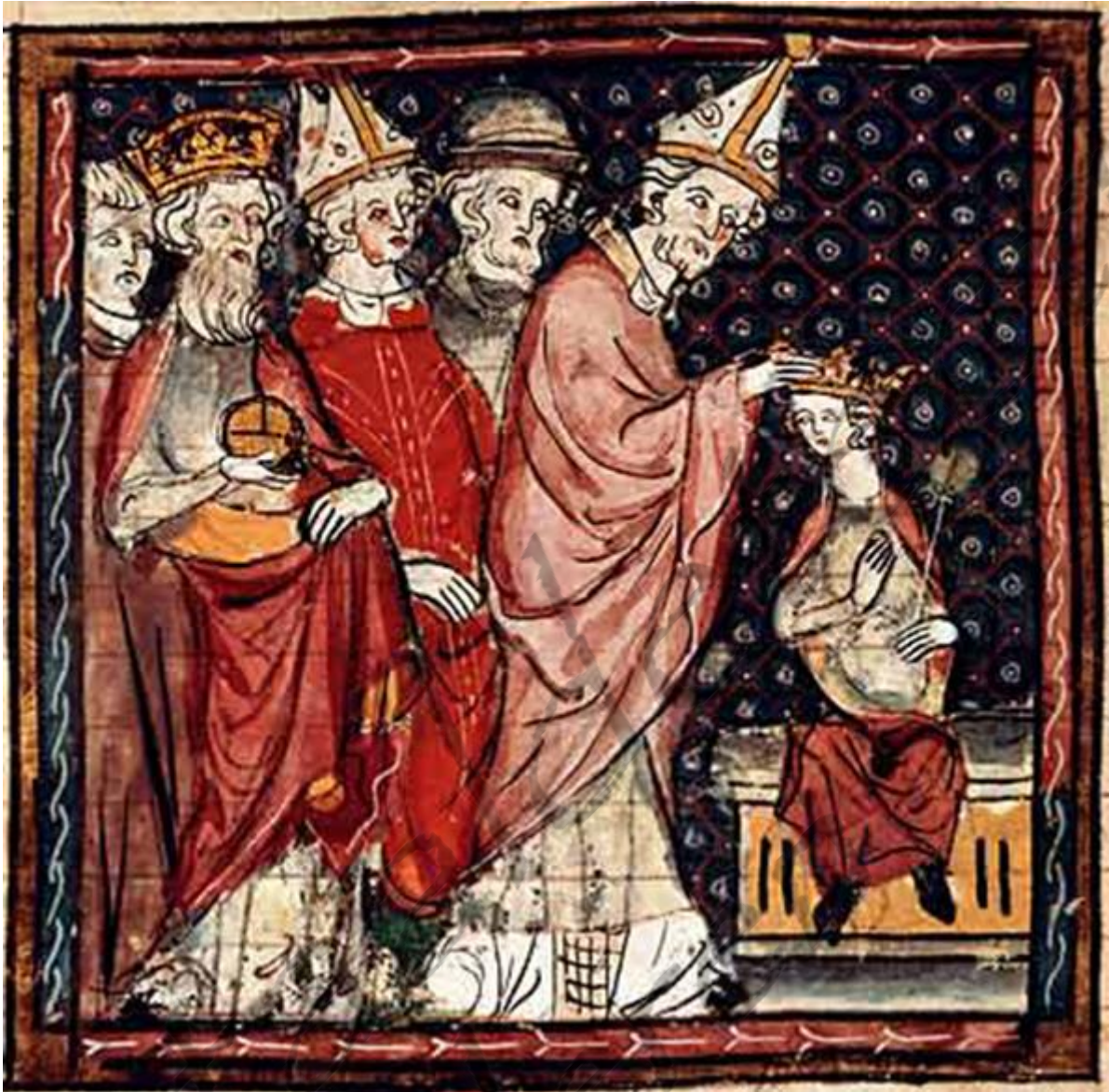
Na zijn kroning tot medekeizer door zijn vader in 813, werd Lodewijk de Vrome in 816 nogmaals tot keizer gekroond door paus Stefanus IV.