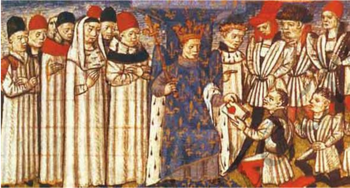
Afbeelding van de "missi dominici" met Karel de Grote.

Aken werd niet alleen residentiestad, maar ontwikkelde ook een administratieve infrastructuur, die de koning en keizer toelieten een zekere mate van controle uit te oefenen over de ongeschikte instanties: graven, bisschoppen, abten en kroonvazallen. Het zijn de 'missi dominici' die nu hun ambtsgebieden bereizen, de koningsbodes die alleen uit de hogere standen worden gekozen en vaak, liefst tegelijk, ook als bisschop. Hun taak bestaat onder meer uit rechtspleging, vredehandhaving en mobilisering van het leger. Karel als nieuwe David, Salomon en Joshua, maar ook Constantijn, werkte aan de vervolmaking van de samenleving via staat en kerk. Een overvloed aan wetten en verordeningen ( capitularia ) werd over het imperium verspreid: clerici en monniken werden opgeroepen om hun ambtelijke plichten te vervullen en zich in hun dagelijks bestaan volgens de regels te gedragen en ook leken moesten plechtig beloven zich aan de wetten te houden. Naar buiten toe was het rijk gevestigd, het kwam er nu op aan een innerlijk draagvlak voor een toekomst van gerechtigheid en vrede te creëren als maatstaf voor een christelijke samenleving. Het is vooral deze geestelijk-spirituele dimensie die het rijk van Karel verheft boven de heerschappij van de Merovingers en het tot in de verre toekomst een enorme uitstraling gaf.