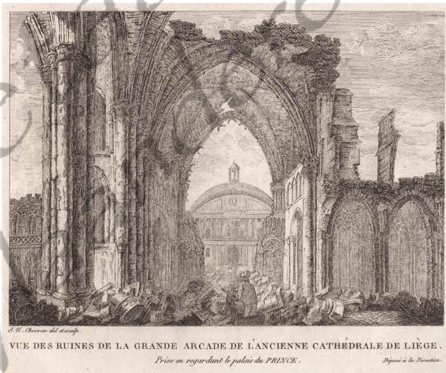
Afbraak van de Sint-Lambertuskathedraal tijdens de Franse fase van de Luikse Revolutie (1794).

Zijn grafmonument, in 1744 ontworpen door de Luikse beeldhouwer Guillaume Évrard, stond oorspronkelijk in de Sint-Lambertuskathedraal, maar werd tijdens de Luikse Revolutie grotendeels vernield op een plaquette en twee putti na. In 2002 werd het monument gereconstrueerd in de kloostergang van de Sint-Pauluskathedraal, waar het thans naast dat van Franciscus Karel de Velbrück staat opgesteld.