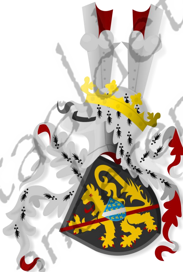
Wapen van de familie Van Glymes

Hij was cavalerieofficier in de Spaanse Nederlanden. Na kerkelijke studies in Leuven werd hij in 1695 toegelaten tot het kapittel van de Sint-Lambertuskathedraal in Luik.