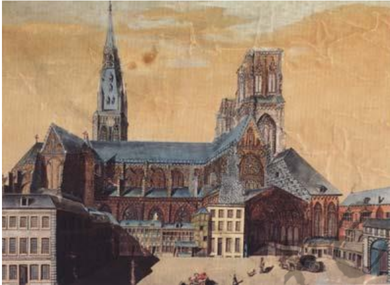
Sint-Lambertuskathedraal in 1780

Op zestigjarige leeftijd werd hij daar eerder onverwacht tot prins-bisschop gekozen en hij bleef dat gedurende twintig jaar