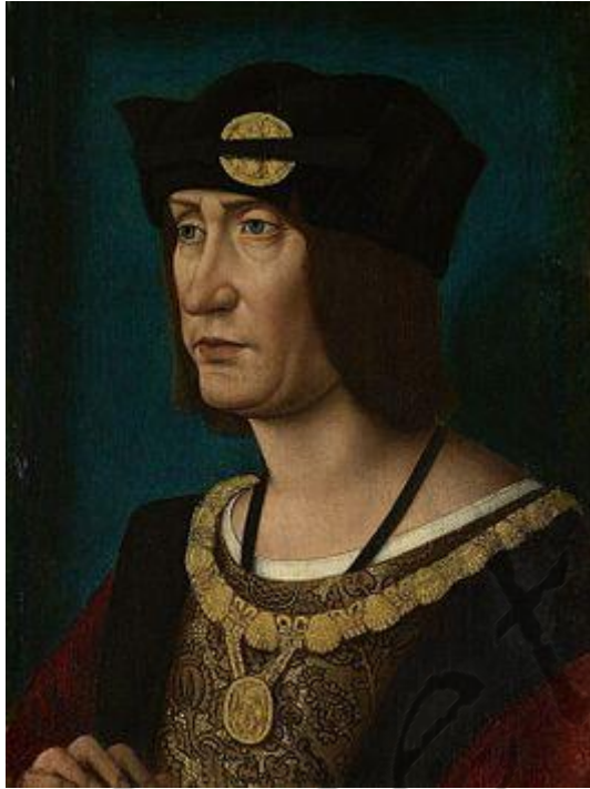
Lodewijk XII van Frankrijk

Toen echter Everhards betrekkingen met de nieuwe Franse koning Frans I bekoelden, koos hij in 1518 onvoorwaardelijk de zijde van keizer Karel V en zijn landvoogdes Margaretha van Oostenrijk.