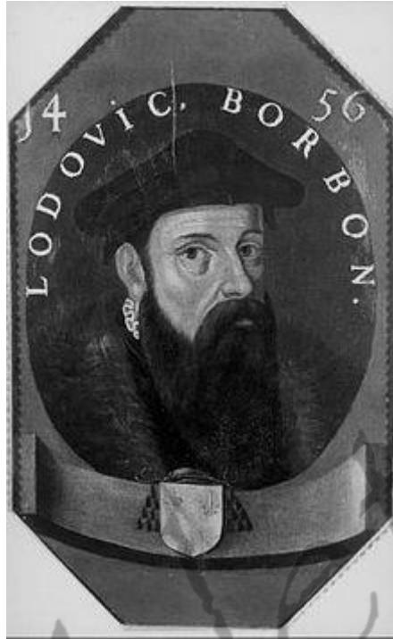
Lodewijk van Bourbon