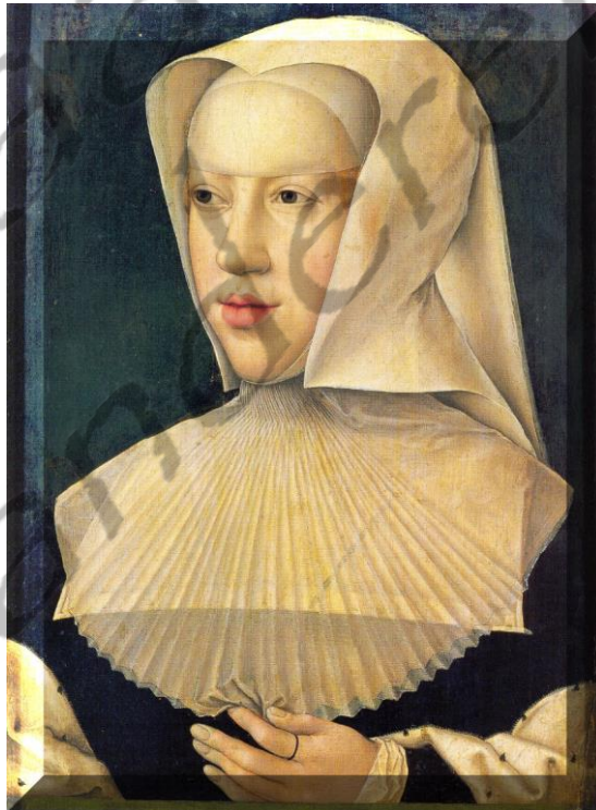
Margaretha van Oostenrijk

De keizer had zijn titel trouwens gedeeltelijk te danken aan de diplomatieke vaardigheden van Everhard van der Marck, die er mee voor zorgde dat Karel keizer werd, en niet Frans I. Toen Van der