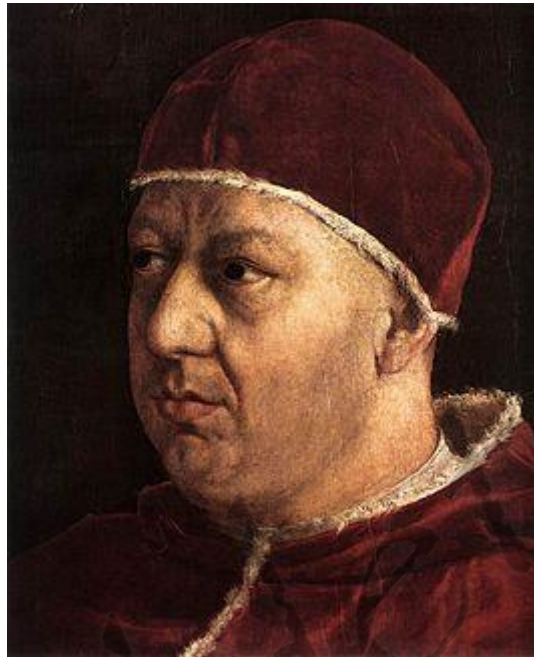
paus Leo X

Marck in 1521 van paus Leo X het kardinaalspurper kreeg, was dat mede op voorspraak van Karel V, die zijn medestander op die manier wilde belonen.