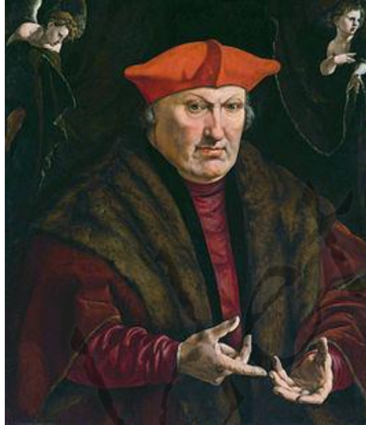
Kardinaal van de Rooms-Katholieke Kerk

Hij was prins-bisschop van Luik van 1506 tot aan zijn dood. Daarbij was hij ook bisschop van Chartres van 1507 tot 1525, en aartsbisschop van Valencia van 1520 tot aan zijn dood.