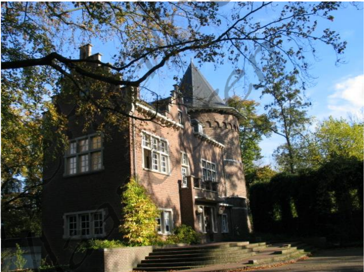
Prinsenhof in Kuringen

Hij verfraaide ook het Prinsenhof in Kuringen waar hij regelmatig verbleef en had goede relaties met de abdij van Herkenrode waarvoor hij als mecenas optrad. Zijn wapenschild siert het poortgebouw van de abdij. De reeks schilderijen de deugdzame vrouwen van Lambert Lombard waarvoor de abdij de opdracht gaf, kwamen er ongetwijfeld op aanraden van prins-bisschop Van der Mark.