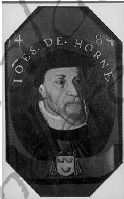
Johan van Horne

Hasselt, dat de kant van Luik koos werd door van der Marck ingenomen maar op 14 september 1482 door de Bourgondiërs heroverd.