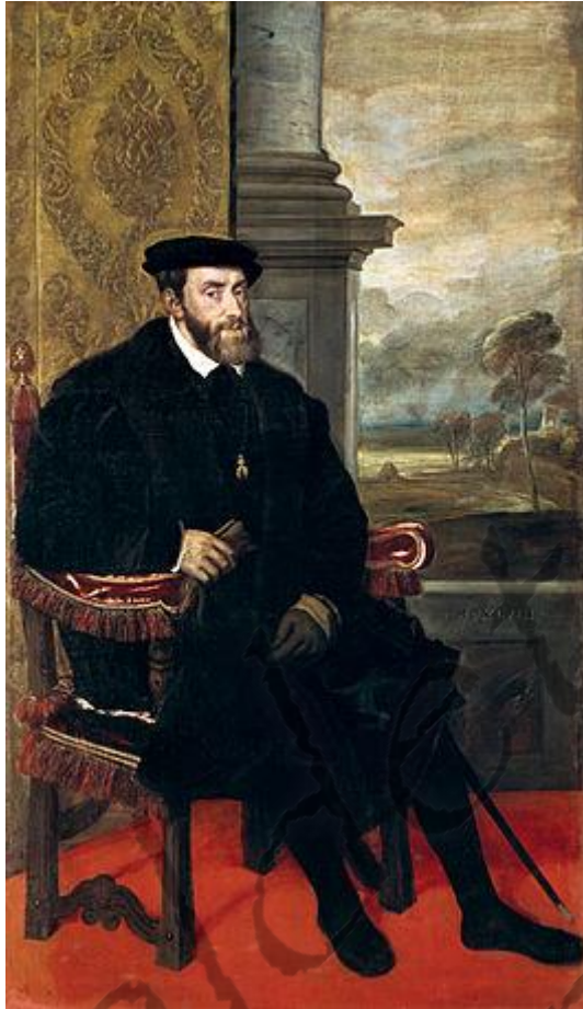
keizer Karel V