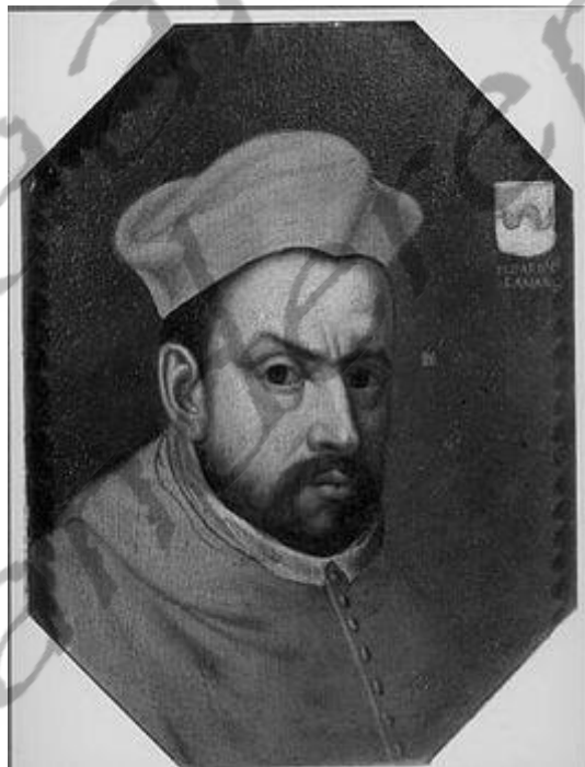
Gerard van Groesbeek

Everhard ging zo ver dat hij een einde maakte aan de neutraliteitspolitiek die het prinsbisdom al in 1492 had uitgeroepen en sloot een pact met Karel V. Onder druk van de Luikenaars moest zijn opvolger, Gerard van Groesbeek dit verbond opzeggen en de neutraliteit herstellen.