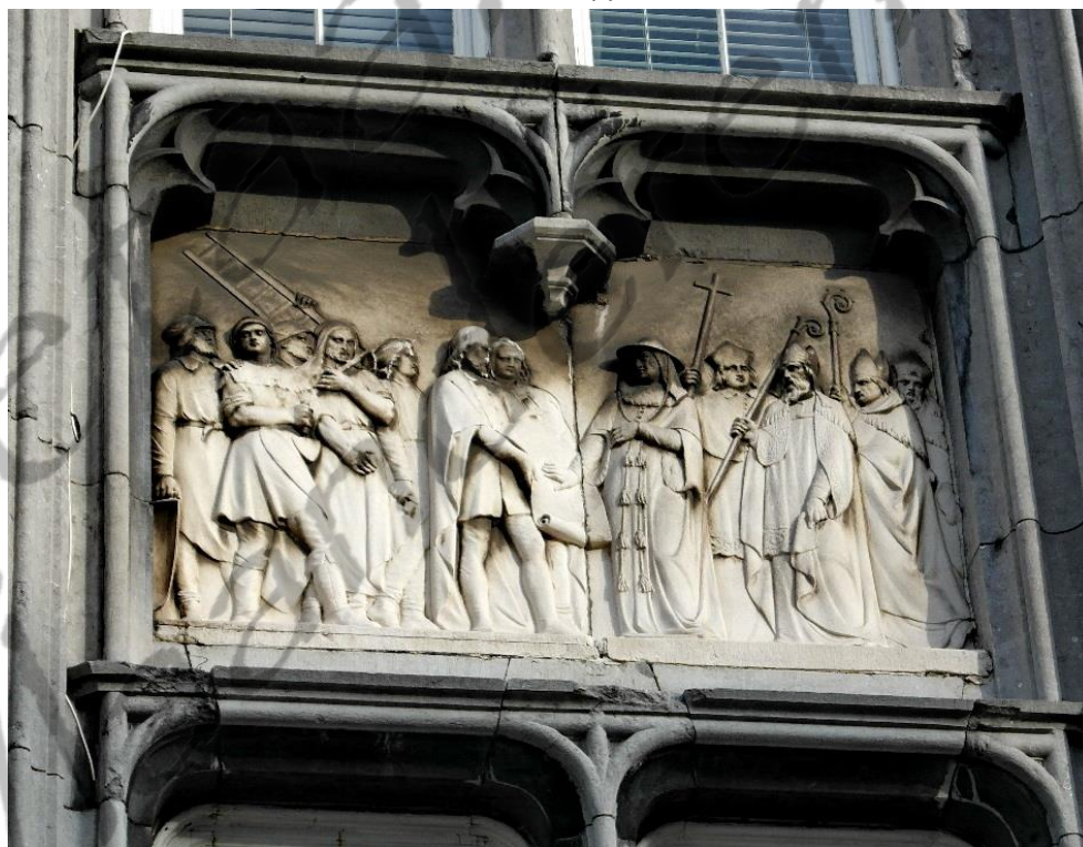
Arnold van Mulken toont de bouwplannen van het nieuwe paleis aan Everhard van der Marck (Provinciaal Paleis, Luik)

In 1537 zond hij zijn hofschilder Lambert Lombard als lid van een missie onder de leiding van de Engelse kardinaal Reginald Pole naar Rome om er kunstwerken voor het prinsbisdom te verwerven.