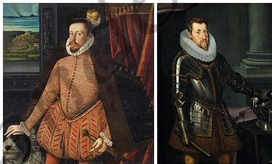
Karel II van Oostenrijk en Keizer Ferdinand II

Uit het huwelijk werden de volgende kinderen geboren: