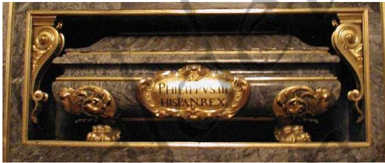
Tombe van Filips III