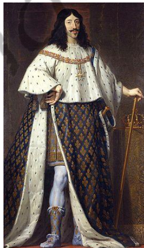
Lodewijk XIII van Frankrijk

De nieuwe koning, Lodewijk XIII, was te jong om zelf te regeren en zijn moeder werd regentes. Koningin-regentes Maria de' Medici vroeg Spanje om hulp tegen de hugenoten. Daarmee werd de vrede die koning Filips II in zijn laatste dagen had gesloten (de Vrede van Vervins) in 1615 eindelijk bezegeld met een huwelijk tussen Lodewijk XIII en de oudste dochter van Filips, Anna, en het huwelijk tussen de Spaanse kroonprins Filips en prinses Elisabeth van Frankrijk.