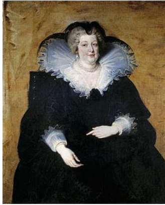
Maria de' Medici