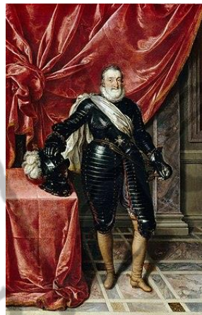
Hendrik IV van Frankrijk

Toen in Frankrijk koning Hendrik IV, een voorstander van de oorlog tegen Spanje, overleed op 14 mei 1610, brak in Frankrijk een periode van instabiliteit aan.