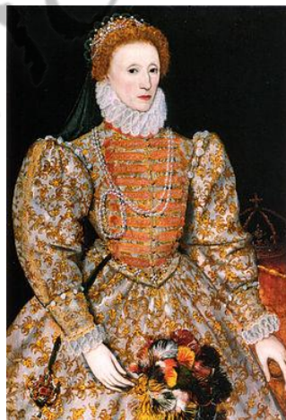
Elizabeth I van Engeland

Ook kwam onder de regering van Filips III de Spaans-Engelse Oorlog, die sinds 1585 gaande was, ten einde. Dit was mogelijk omdat koningin Elizabeth I van Engeland was overleden en was opgevolgd door haar neef, de Schotse koning Jacobus VI, die in Engeland koning werd als Jacobus I. In 1604 werd het Verdrag van Londen door beide landen ondertekend.