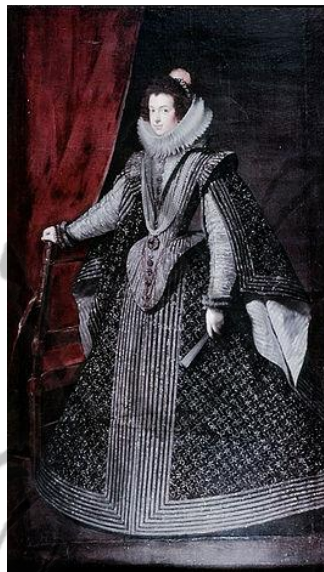
Elisabeth van Frankrijk

In 1621 riep Filips III Pedro Téllez-Girón, hertog van Osuna, terug uit Italië, omdat die als onderkoning van het koninkrijk Sicilië en koninkrijk Napels Spanje in verlegenheid had gebracht met zijn pogingen de macht van de Republiek Venetië in te perken.