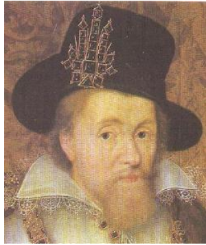
Jacobus I van Engeland

Toen in Frankrijk koning Hendrik IV, een voorstander van de oorlog tegen Spanje, overleed op 14 mei 1610, brak in Frankrijk een periode van instabiliteit aan.