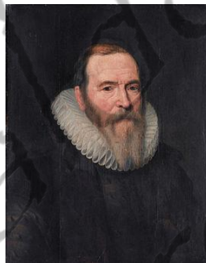
Johan van Oldenbarnevelt

Ze gaven Spinola de opdracht te onderhandelen over een bestand, met als voorwaarden dat de VOC ontbonden moest worden en dat van de oprichting van een West-Indische Compagnie geen sprake kon zijn. Voor Spanje zou dat een nog grotere bedreiging betekenen. Door behendig manoeuvreren van Johan van Oldenbarnevelt kwam het Twaalfjarig Bestand er in 1609 zonder dat de Republiek haar handel op Oost-Azië op hoefde te geven.