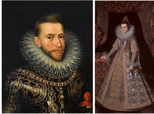
Albrecht van Oostenrijk en Isabella van Spanje

Ze gaven Spinola de opdracht te onderhandelen over een bestand, met als voorwaarden dat de VOC ontbonden moest worden en dat van de oprichting van een West-Indische Compagnie geen sprake kon zijn. Voor Spanje zou dat een nog grotere bedreiging betekenen. Door behendig manoeuvreren van Johan van Oldenbarnevelt kwam het Twaalfjarig Bestand er in 1609 zonder dat de Republiek haar handel op Oost-Azië op hoefde te geven.