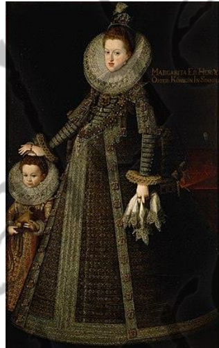
Margaretha van Oostenrijk

Koning Filips III trouwde met Margaretha van Oostenrijk (1584-1611), dochter van Karel II van Oostenrijk, zus van de latere keizer Ferdinand II van het Heilige Roomse Rijk