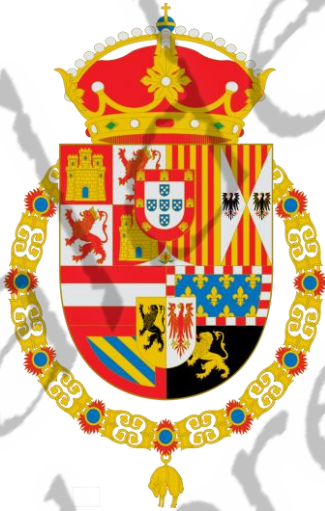
Wapen van Filips III van Spanje

Hij werd begraven in de Koninklijke grafkelder van het Escorial