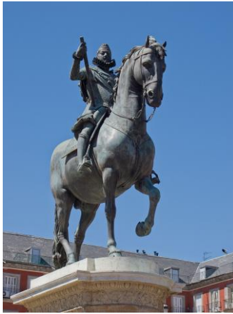
Ruiterstandbeeld van Felipe III op de Plaza Mayor van Madrid

Een standbeeld van Filips III staat op de Plaza Mayor van de Spaanse hoofdstad Madrid.