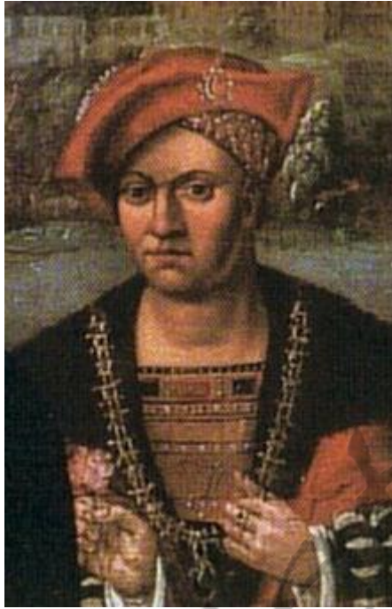
Jan II van Kleef

Wilhelm stierf in 1511, met hem eindigde het huis Jülich. Hij ligt begraven als de laatste heerser van Bergischer in de kathedraal van Altenberg . Zijn opvolger was zijn schoonzoon Johann, die ook Kleve-Mark in 1521 erfde.