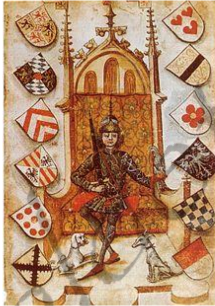
Hertog Gerhard van Jülich-Berg. Miniatuur uit 1480

Wilhelm was de zoon van hertog Gerhard van Jülich-Berg en de Sophie van Saksen-Lauenburg . Na de dood van zijn vader in 1475 volgde hij hem op.