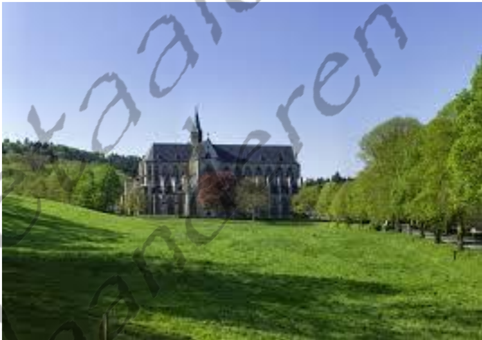
kathedraal van Altenberg

Wilhelm stierf in 1511, met hem eindigde het huis Jülich. Hij ligt begraven als de laatste heerser van Bergischer in de kathedraal van Altenberg . Zijn opvolger was zijn schoonzoon Johann, die ook Kleve-Mark in 1521 erfde.