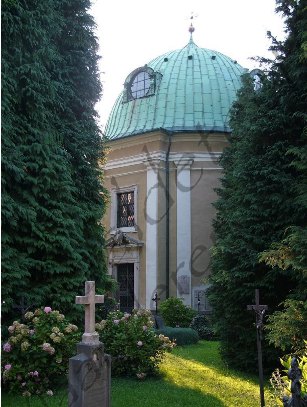
Mausoleum van aartsbisschop Wolf Dietrich in St. Sebastian