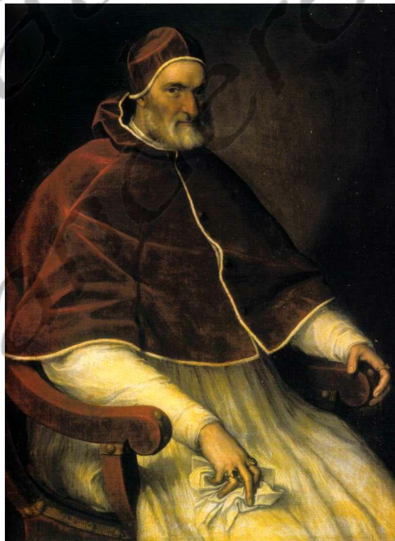
Paus Pius IV