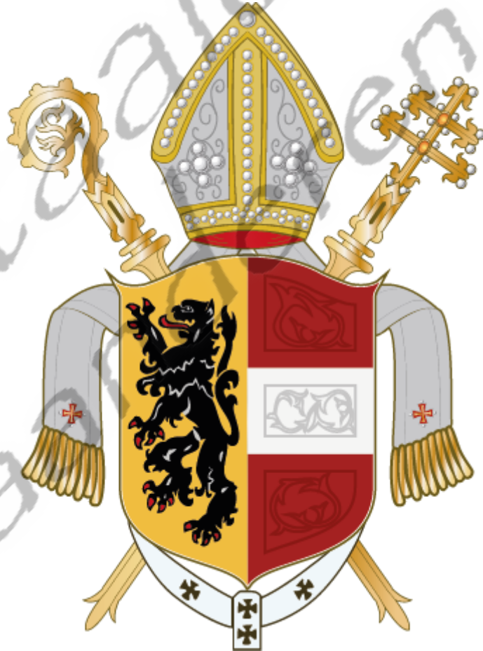
Wapenschild van Aartsbisdom Salzburg