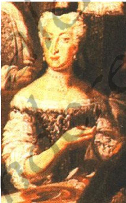
Amalia Wilhelmina van Brunswijk-Lüneburg

In 1699 trouwde hij met Amalia Wilhelmina, dochter van hertog Johan Frederik van Brunswijk-Lüneburg, met wie hij drie kinderen kreeg.