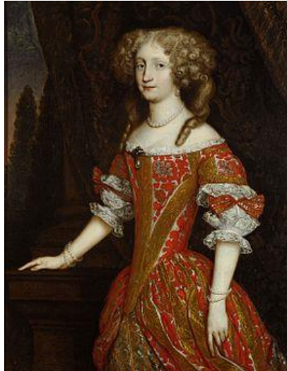
Eleonora van Palts-Neuburg

Jozef I werd onderwezen door prins Karl Theodor Otto zu Salm en hij werd een goede taalkundige. In 1687 werd hij al op 9-jarige leeftijd tot co-koning van Hongarije en op 6 januari 1690 tot Rooms-Duits koning gekroond.