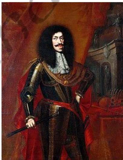
keizer Leopold I