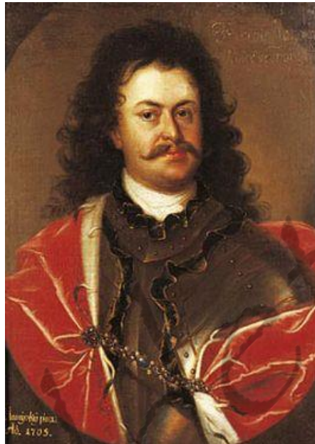
Frans II Rákóczi

Hij volgde zijn vader op als keizer van het Heilige Roomse Rijk in 1705. Tijdens zijn ambtstermijn werd de rust in Hongarije verstoord door de ambities naar autonomie voor Zevenbergen van Frans II Rákóczi, die na een beslissende nederlaag een toevluchtsoord zocht in Polen.