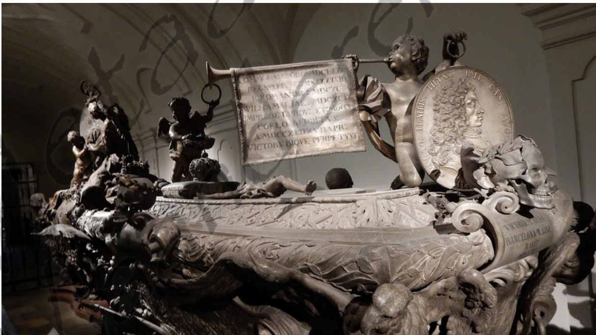
Graftombe Jozef I

Jozef I is een van de keizers van het Heilige Roomse Rijk in een ononderbroken rij van vier, wiens muzikale kwaliteiten zich ook uiten in het zelf componeren van muziekstukken. Jozef stierf op 17 april 1711 in Wenen en ligt begraven in de Kapuzinergruft in Wenen