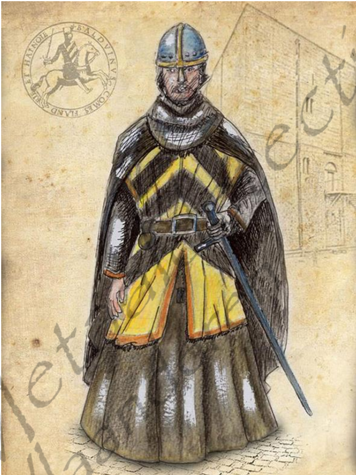
Afbeelding van Boudewijn IV van Henegouwen ( ' de Brouwer ' )

Na de moord op Karel de Goede, graaf van Vlaanderen, in 1127, eist Boudewijn IV tevergeefs zijn opvolging op. In een vlaag van razernij brandt hij Oudenaarde plat, maar hij wordt gedwongen zich terug te trekken. De troonsbestijging van Diederik van den Elzas in 1128 betekent weer een nederlaag. In een poging om nieuwe militaire bondgenoten te krijgen, trouwt hij enige tijd later met Aleidis van Namen. In 1148 en 1149 profiteert hij van de afwezigheid van Diederik van den Elzas, die