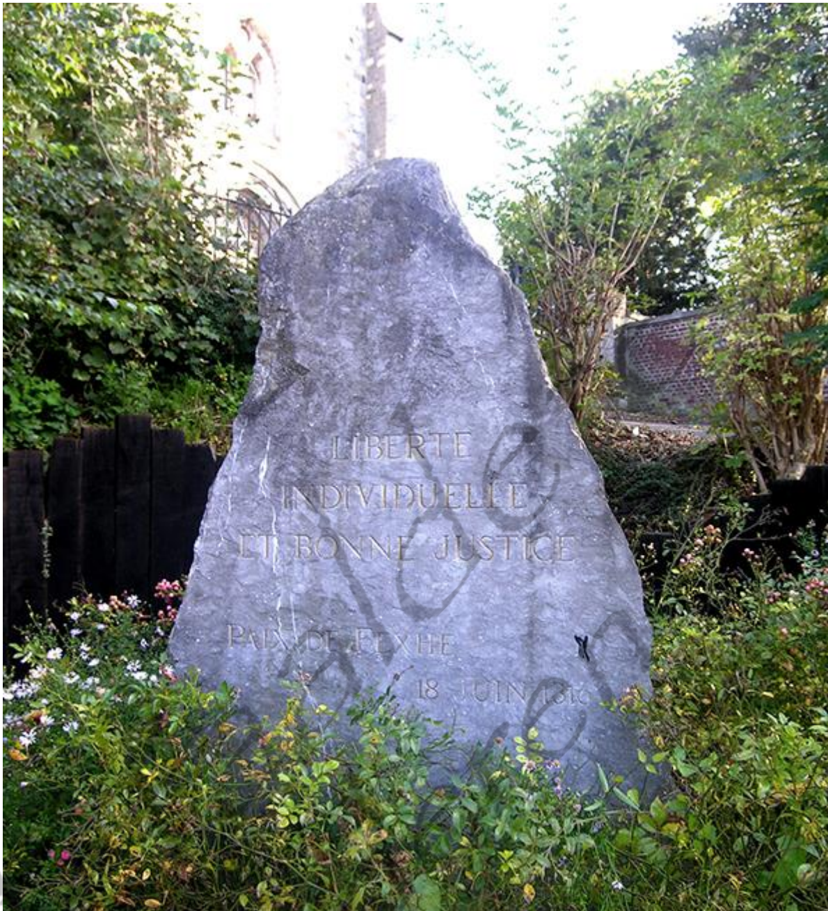
Gedenksteen in Fexhe met de tekst Liberté individuelle et bonne justice (Persoonlijke vrijheid en goede justitie).

Op 18 juni 1316 ondertekent de nieuwe prins-bisschop Adolf van der Mark de Vrede van Fexhe. Dat vredetraktaat waarborgt alle partijen van het prinsbisdom voortaan een theoretische deelname aan de macht. De wetten en gewoonten van het prinsbisdom mogen niet meer veranderd worden zonder de toestemming van de 'sens du pays', de vier expliciet vermelde actoren: de bisschop, het kapittel van Sint-Lambertus, de adellijke stand (52 families van feodale heren) en de steden. De steden zullen worden vertegenwoordigd door schepenen, aangeduid door de prins-bisschop en de gezworenen, gekozen door de ambachten. Negen 'goede steden' krijgen dit recht van vertegenwoordiging: Luik, Hoi, Dinant, Maastricht, Tongeren, Sint-Truiden, Fosses, Couvin en Thuin. Niettemin kan de invoering van dit systeem niet beschouwd worden als de invoering van een representatief systeem van de Luikse bevolking. Beslissingen worden niet unaniem genomen. Bovendien rekruteren de bisschop, het kapittel en de adelstand binnen dezelfde aristocratische