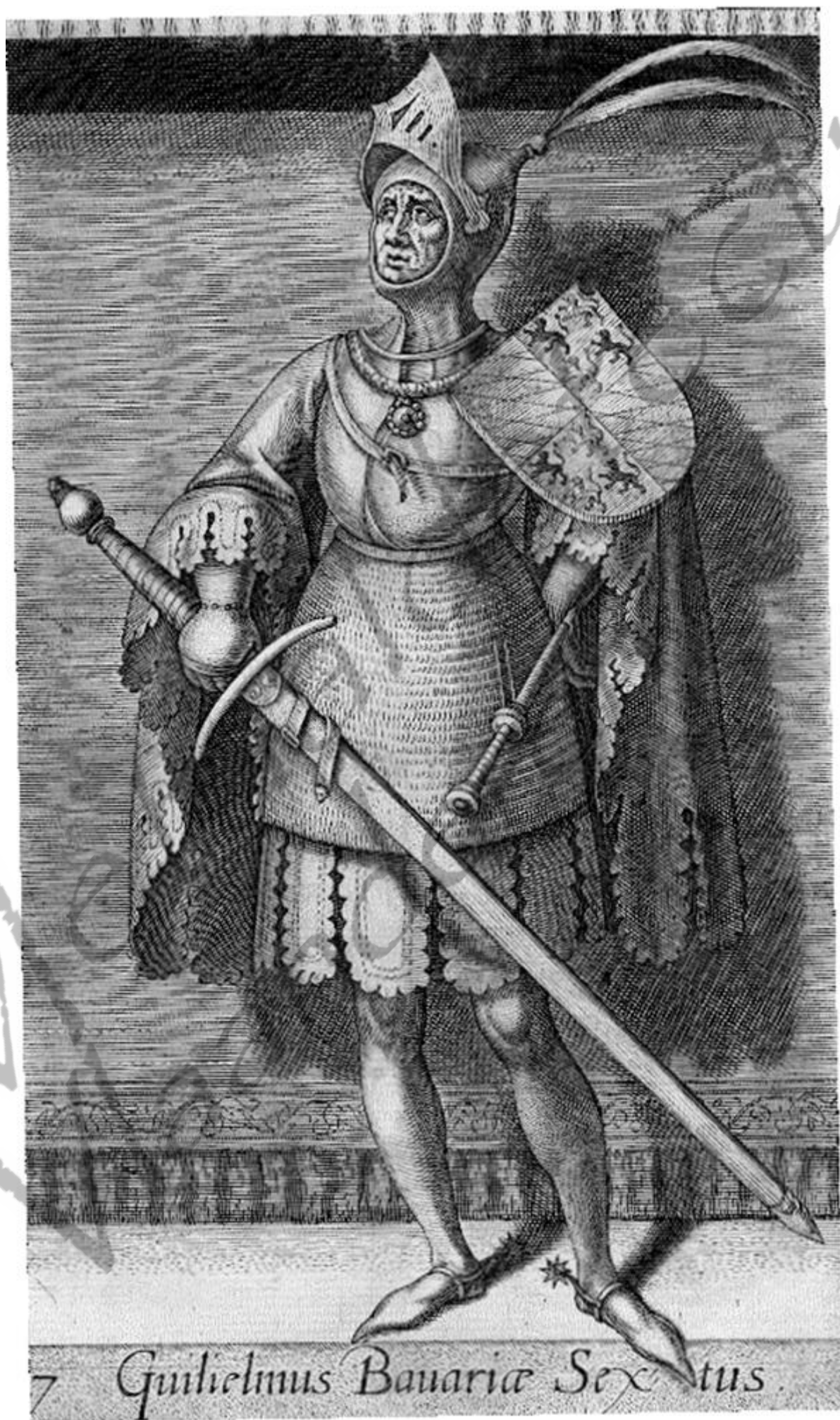
7 Wilhelmus Bauaricae Sextus.