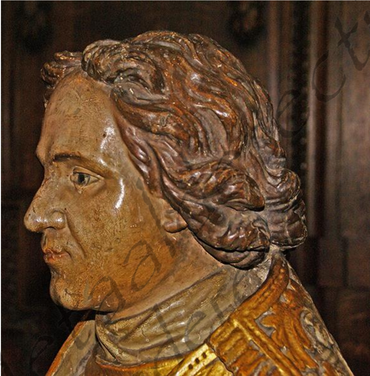
Luik, Sint-Jacobskerk: beeld (1691) van Notger.

Vanaf de troonsbestijging van Otto I van het Duitse Rijk (936) wordt de bisschop van Luik benoemd door de keizer zelf en wordt hij zo diens belangrijkste vertegenwoordiger in de diocese. Hij verdedigt dus ook de belangen van het rijk tegen het zelfstandigheidsstreven van de Lotharingse adel.