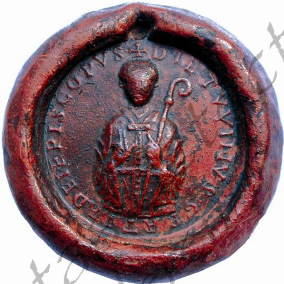
Het zegel van Theoduinus (ook Dietwin genoemd), prins-bisschop van Luik van 1048 tot 1075.

Tijdens de 11e eeuw voelt de prins-bisschop van Luik zich nog verwant met de andere feodale heren van Lotharingen. Hij blijft de belangen van de keizer verdedigen, maar denkt toch vooral aan het behouden en het uitbreiden van zijn grondgebied. Hij gebruikt desnoods geweld, zoals in 1012 in Hoegaarden of in 1040 in Dinant, of richt versterkingen op om de aanspraken van andere graven te ontmoedigen. Hij koopt ook kastelen, zoals die van Couvin en Bouillon, die in 1096 verkocht worden omdat hun eigenaars op kruistocht vertrekken. Zijn uitbreidingspogingen zijn evenwel niet altijd succesvol: zo lijdt Luik in 1013 een nederlaag in Hoegaarden tegen de graaf van Leuven. Ook de aanvallen van de militair sterke naburige adel brengen veel schade toe. Zo verwoest de graaf van Vlaanderen in 1053 Hoei. Om de heropbouw van de collegiale kerk te bekostigen, geeft prins-bisschop Theoduinus een pak voorrechten aan de poorters. Deze worden opgetekend in het eerste charter met vrijheden dat het licht ziet in het Westen (1066). Rond het einde van de 11e eeuw en in het begin van de 12e eeuw ontstaan de eerste gemeentelijke instellingen in het hart van de stad Luik.