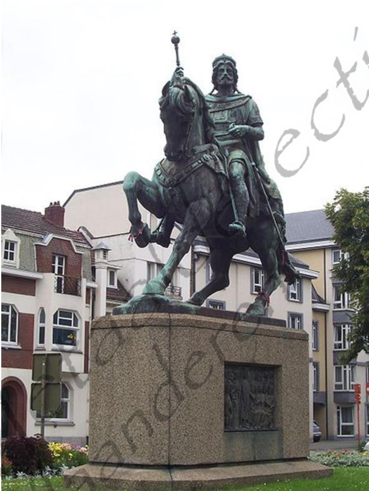
Standbeeld van Boudewijn VI van Henegouwen, ook Boudewijn IX van Vlaanderen en Boudewijn I van Constantinopel, te Bergen (Mons).

Boudewijn VI van Henegouwen neemt aanvankelijk een voorzichtige houding aan in het conflict tussen Filips II Augustus en Richard Leeuwenhart. Toch zal hij tamelijk snel kiezen voor een nauwer bondgenootschap met Engeland. De Engelse wol is immers van levensbelang voor de Vlaamse textielindustrie. In 1199 wordt Filips II Augustus gedwongen om de bepalingen van het Verdrag van