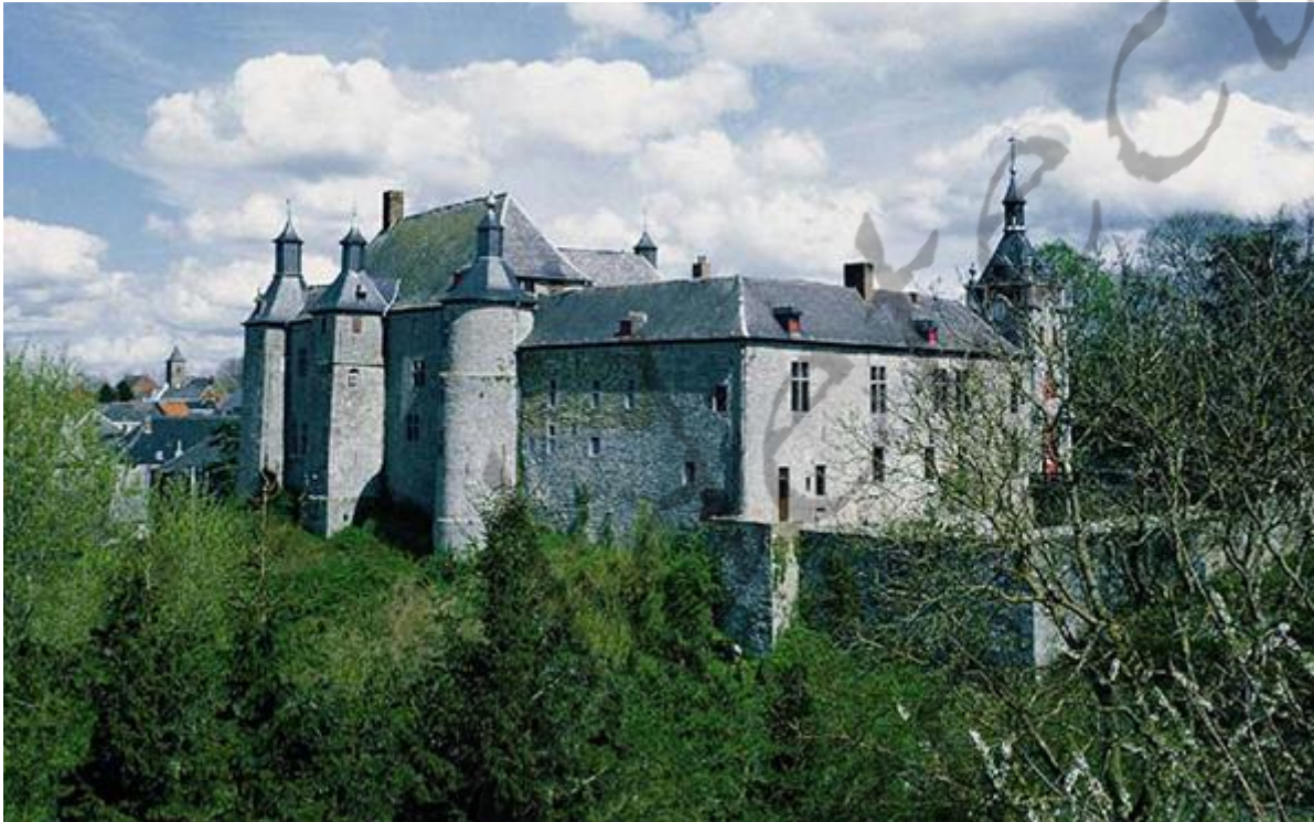
Het versterkt kasteel van Ecaussinnes werd in de 12e eeuw gebouwd door Boudewijn V, graaf van Henegouwen.

Na de dood van Filips van den Elzas tijdens de Derde Kruistocht bij het Beleg van Akko in 1191, overmeestert Boudewijn V van Henegouwen (Boudewijn VIII van Vlaanderen) het graafschap Vlaanderen. Filips Augustus, de koning van Frankrijk, laat echter ook zijn rechten op dat graafschap gelden. Het Verdrag van Atrecht (Arras) eind 1191 bevestigt de vereniging van Henegouwen en Vlaanderen. Boudewijn V betaalt evenwel een hoge prijs. Filips Augustus aanvaardt zijn leenhulde, maar verkrijgt hiervoor 5000 marken zilver én een deel van het grondgebied van beide graafschappen.