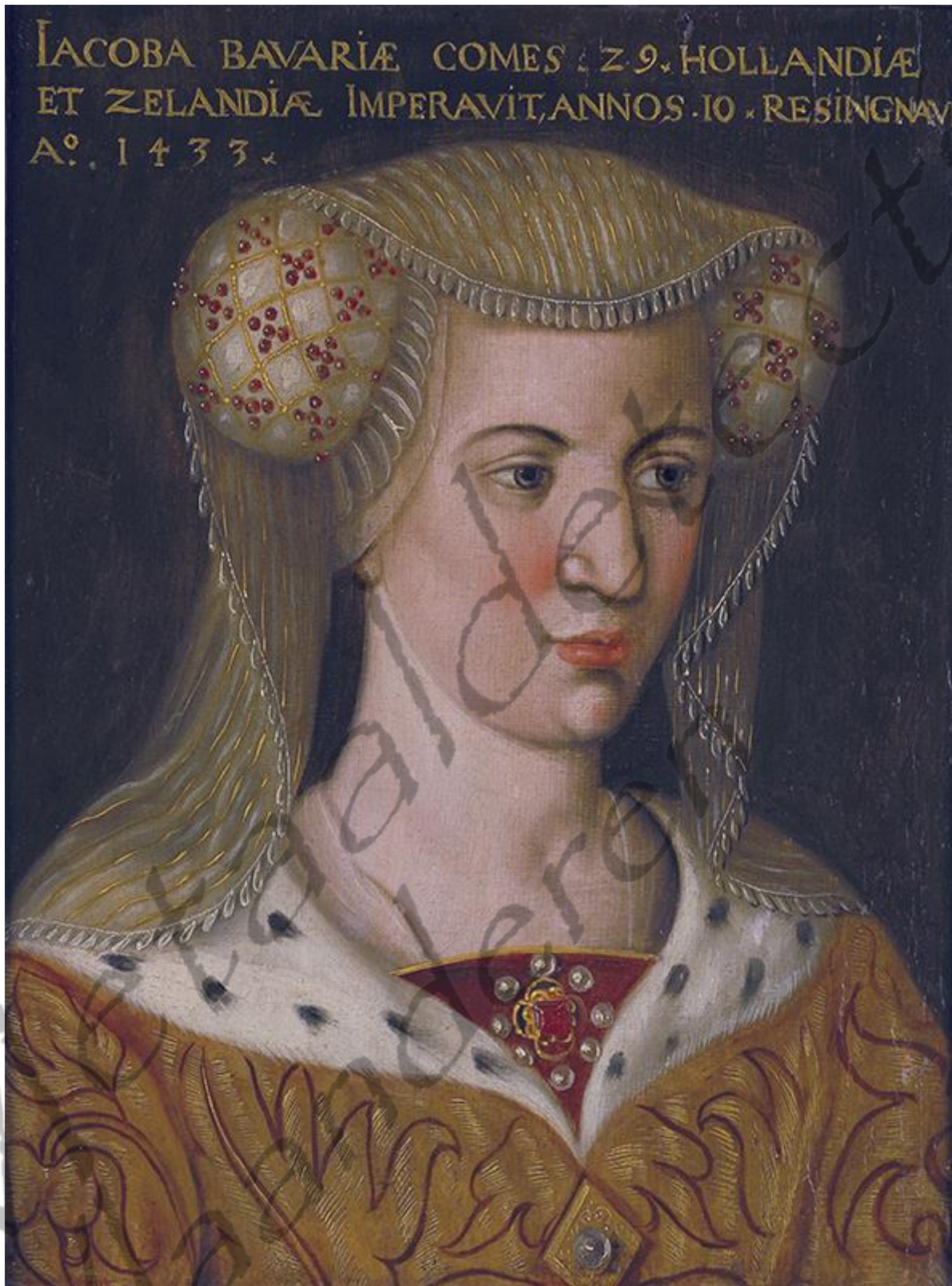
Portret van Jacoba van Beieren, die Dauphine van Frankrijk en gravin van Henegouwen was. Zij was erfgename van de graafschappen Holland, Zeeland en Henegouwen. Een makkelijk leven had zij niet; al op vijfjarige leeftijd werd zij als huwelijkskandidate ingezet in het dynastieke machtsspel. Het bleef niet bij één gearrangeerd huwelijk. Haar eerste man overleed, de tweede echtverbintenis – met haar neef – liet ze ongeldig verklaren, een derde strandde. Voor haar vierde en laatste huwelijk moest zij