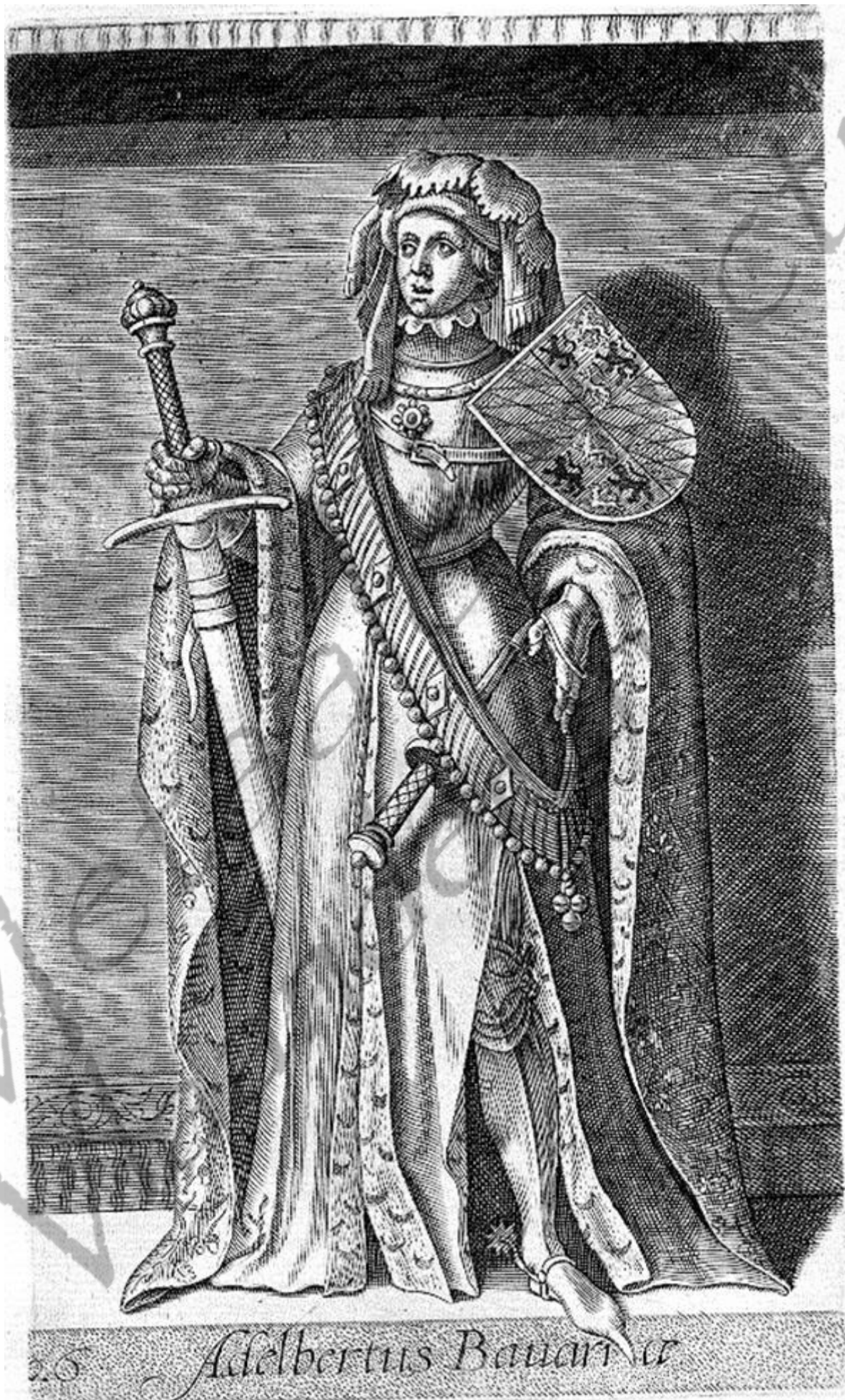
26 Adelbertus Bavariae