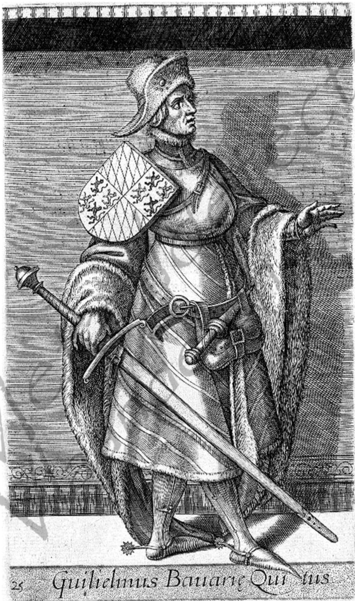
25 Guilielmus Bauarie Quintus