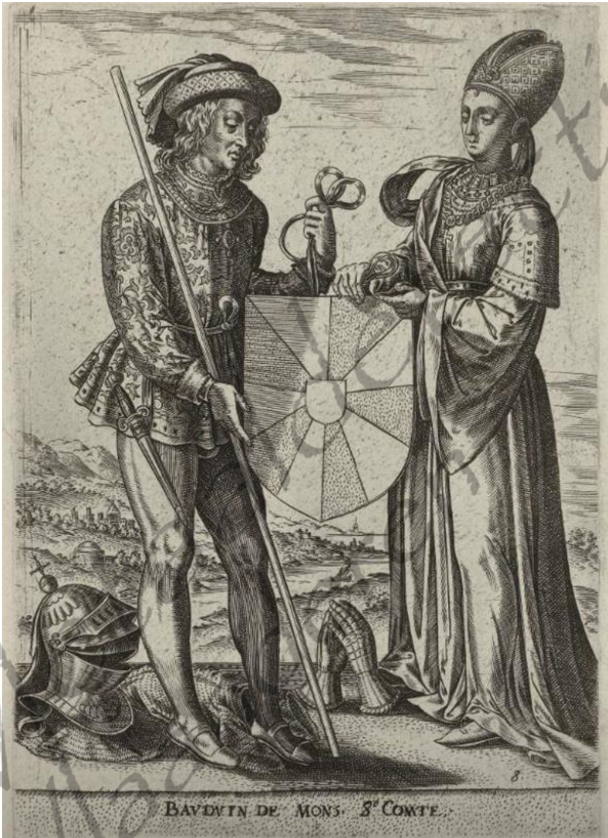
Portret van Boudewijn VI, graaf van Vlaanderen en Richildis, gravin van Henegouwen.

Na de Slag bij Kassel (Cassel) in 1071, waar Arnold III op het slagveld sterft, zet zijn moeder Richildis de strijd tegen Robrecht I de Fries, de graaf van Vlaanderen, verder. Hetzelfde jaar geeft zij haar allodia (eigen, vrije erfgoederen) voor een grote som geld in leen aan de bisschop van Luik. De strijd eindigt in 1076 na tussenkomst van keizer Hendrik IV. Richildis verwerft Henegouwen voor haar zoon