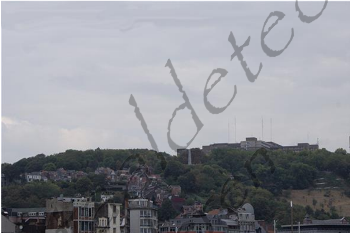
De citadel van Luik