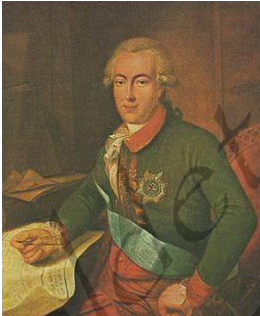
Landgraaf en groothertog van Hessen-Darmstadt

Lodewijk X was van 1790 tot 1806 landgraaf en daarna tot 1830 als Lodewijk I groothertog van Hessen-Darmstadt. Hij was de zoon van landgraaf Lodewijk IX en Henriëtte Caroline van Palts-Zweibrücken.