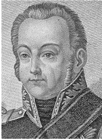
Lodewijk II van Hessen-Darmstadt

Lodewijk schonk zijn land in 1820 een constitutie om tegemoet te komen aan de roep om meer vrijheden. Hij reorganiseerde de regering en trad in 1828 toe tot de Pruisische Zollverein. Hij stierf op 5 april 1830 en werd opgevolgd door zijn zoon Lodewijk II.