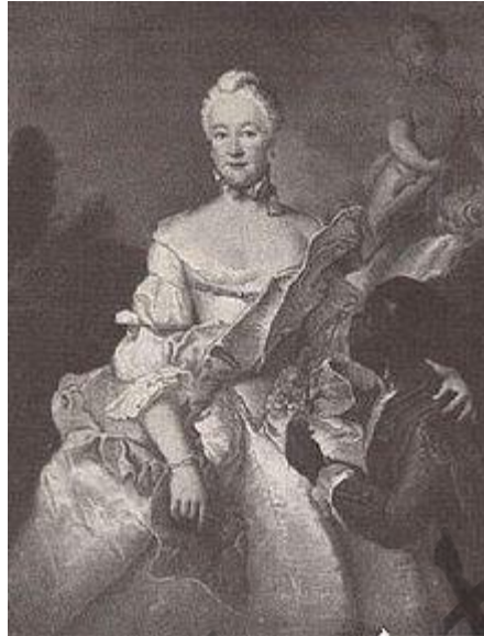
Henriëtte Caroline van Palts-Zweibrücken

Lodewijk huwde op 15 juli 1774 in Darmstadt met Louisa van Hessen-Darmstadt, uit dit huwelijk werden zes kinderen geboren: