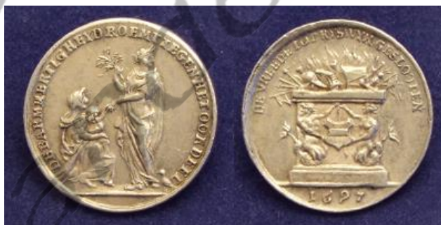
Zilveren penning van de Vrede van Rijswijk

In 1688 leidde een nieuw dispuut over Keulen tot de Oorlog van de Grote Alliantie. Deze oorlog werd een uitputtingsslag en werd in 1697 besloten door de Vrede van Rijswijk.