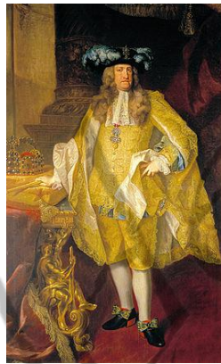
Keizer Karel VI