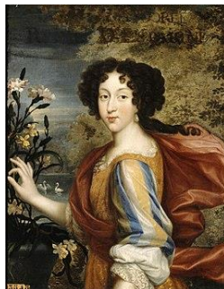
Marie Louise van Orléans

Hoewel Karel vermoedelijk impotent was, trouwde hij tweemaal. De eerste keer in 1679 met Marie Louise van Orléans (1662-1689), een nicht van Lodewijk XIV, koning van Frankrijk.