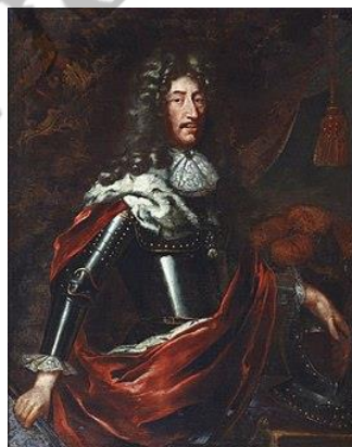
Filips Willem van de Palts

Zij was een schoonzus van keizer Leopold I.