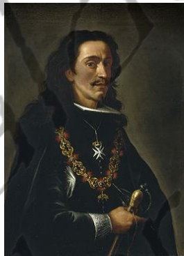
Juan II van Oostenrijk

In 1678 werd de moeder van Karel II uit Madrid verdreven door Juan II, de bastaardzoon van Filips IV.