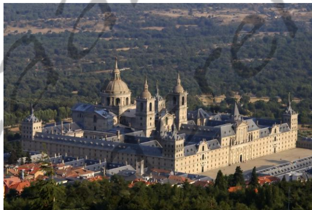
Luchtfoto van het Escorial

Hij werd begraven in de Koninklijke grafkelder van het Escorial