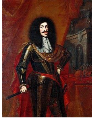
Keizer Leopold I

In die tijd ging de toestand van Karel sterk achteruit. Hij liet familieleden opgraven om hun lijk te aanschouwen en huilde bij het lichaam van zijn dode vrouw Marie-Louise, een gewoonte die hij blijkbaar erfde van Johanna van Castilië.