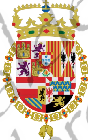
Wapen van de Habsburgse koningen van Spanje