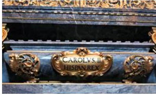
Sarcofaag van Karel II