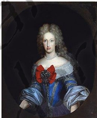
Maria Anna van Palts-Neuburg

Na haar dood hertrouwde hij, onder druk van zijn entourage, met Maria Anna van Palts-Neuburg, prinses van Neuburg, dochter van Filips Willem van de Palts.