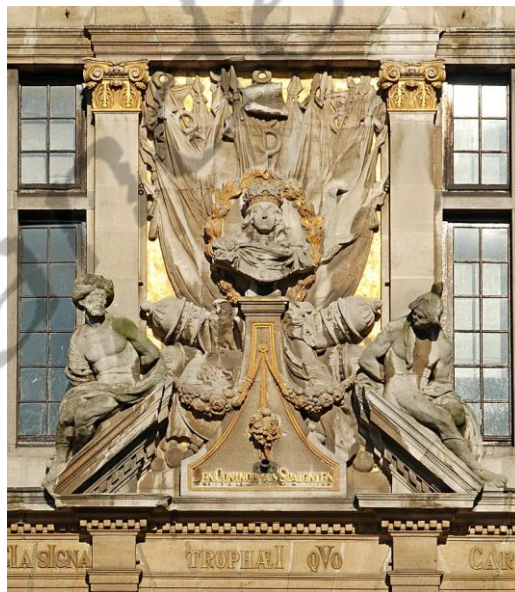
Triomf van Karel II op de gevel van Den Coninck van Spaignien (Grote Markt van Brussel).