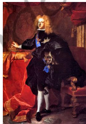
Filips van Anjou

Ook zijn tweede huwelijk bleef kinderloos en Karel wees een kleinzoon van Lodewijk XIV, Filips van Anjou, aan als zijn opvolger.