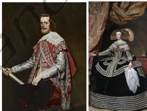
Filips IV van Spanje en Maria Anna van Oostenrijk

Hij regeerde van 1665 tot zijn dood over het Spaanse Rijk en was de zoon van zijn voorganger Filips IV en Maria Anna van Oostenrijk. Hij was de laatste van de Spaanse Habsburgers.