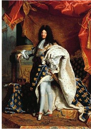
Lodewijk XIV van Frankrijk

Naar het schijnt was hij hevig verliefd op haar en baden ze godvruchtig in de kerk om niet kinderloos te blijven. Zij werd echter nooit zwanger en na tien jaar werd zij tijdens een paardenrit onwel en stierf. Sommigen vermoeden moord, anderen spreken van een appendicitis. Naar het schijnt sprak ze tot Karel II bij haar afscheid "Zijne Majesteit zal waarschijnlijk nog vrouwen hebben, maar slechts weinigen zullen zoveel houden van u als ik".