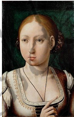
Johanna van Castilië

In die tijd ging de toestand van Karel sterk achteruit. Hij liet familieleden opgraven om hun lijk te aanschouwen en huilde bij het lichaam van zijn dode vrouw Marie-Louise, een gewoonte die hij blijkbaar erfde van Johanna van Castilië.