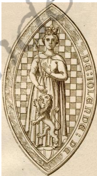
Yolande van Dreux, koningin van Schotland

John was fel gekant tegen het tweede huwelijk van zijn vader met Yolande van Dreux, koningin van Schotland, en probeerde de wettigheid ervan te betwisten.