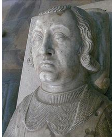
Charles van Valois

In 1297 was Jan getrouwd met zijn eerste vrouw Isabella van Valois, de oudste dochter van Charles van Valois en zijn eerste vrouw Margaret van Napels .