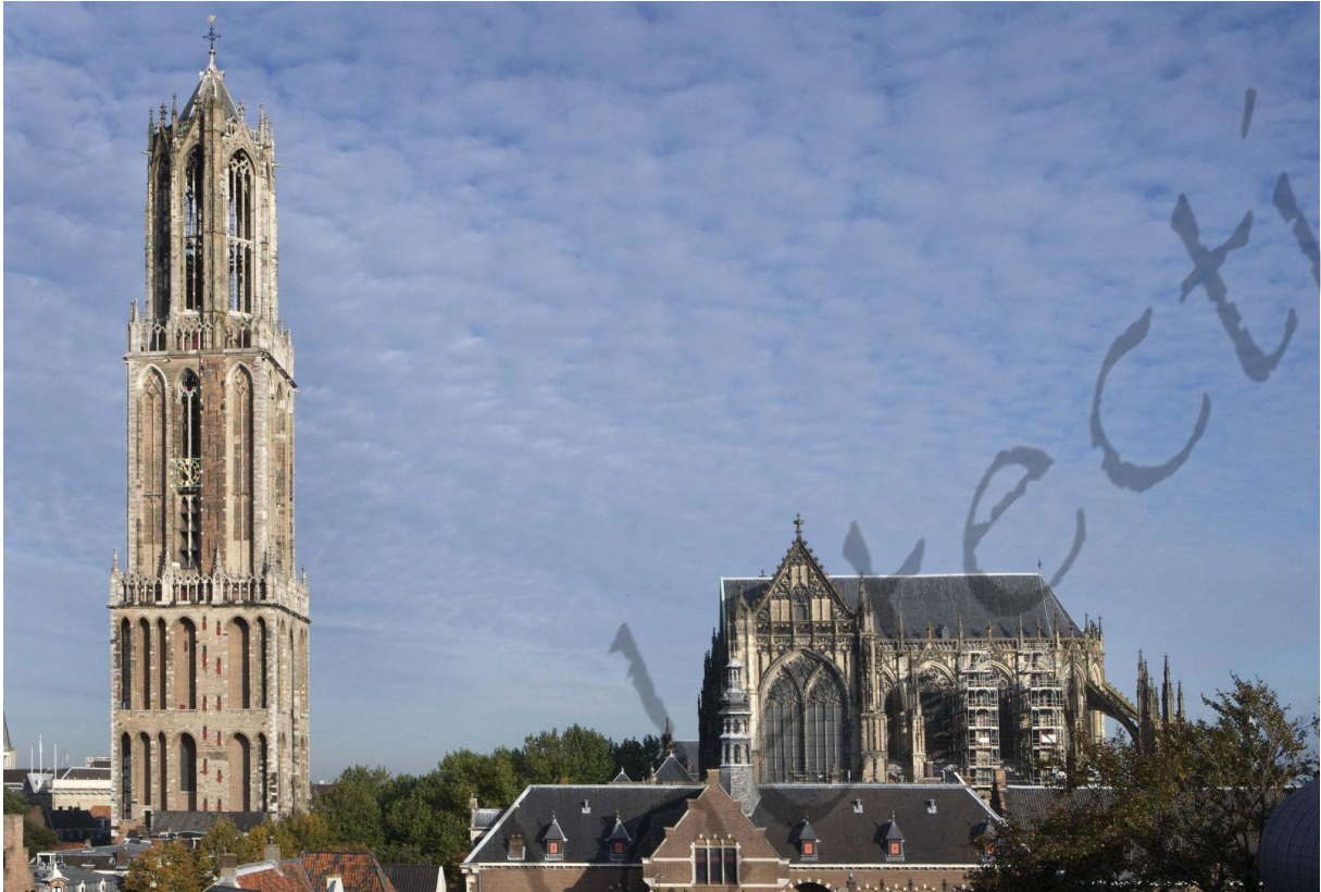
Dom van Utrecht