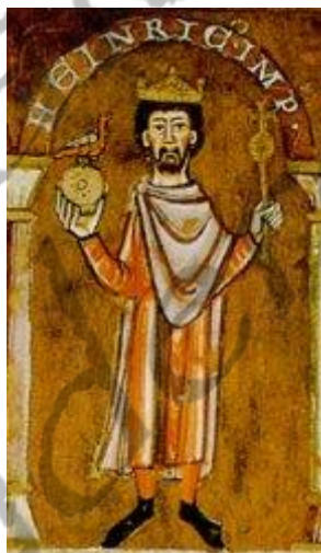
keizer Hendrik IV

Burchard was tijdens de investituurstrijd een aanhanger was van keizer Hendrik IV. Voordat hij door keizer Hendrik IV tot bisschop van Utrecht benoemd werd, was hij domproost van Straatsburg.