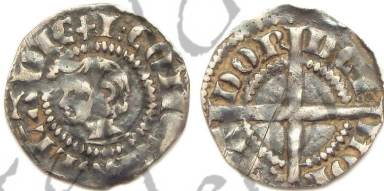
Holland, penning of 'kopje' met portret van Jan I.

In eerste instantie stond de jonge graaf geheel onder invloed van Jan van Renesse. Op 30 april 1297 droeg Jan I, na een machtsstrijd tussen de twee raadsheren, echter het bestuur over aan Wolfert I van Borselen, tot aan zijn 15e verjaardag. Na een conflict met het stadsbestuur van Dordrecht werd Van Borselen op 1 augustus 1299 in Delft vermoord. Hierna benoemden de steden Jan van Avesnes, graaf van Henegouwen, als regent en op 27 oktober 1299 droeg Jan I de regering voor een periode van 5 jaar aan hem over. Twee weken later stierf Jan aan dysenterie, 15 jaar oud, en met hem stierf ook het Hollandse Huis uit. Omdat hij geen directe troonopvolgers had, ging het graafschap naar Jan van Avesnes, graaf van Henegouwen (als Jan II van Holland), zoon van zijn oudtante, Aleid van Holland. Dit was de grondslag voor een personele unie tussen het graafschap Holland en het graafschap Henegouwen, die tot na de Beierse tijd zou duren. Elisabeth keerde in de zomer van 1300 naar Engeland terug. Pas in 1309 werd een regeling getroffen voor de uitbetaling van haar weduwegoed.