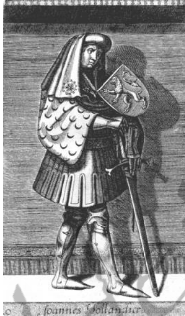
Graaf van Holland

Jan I was graaf van Holland en zoon van Floris V van Holland en Beatrijs van Vlaanderen.