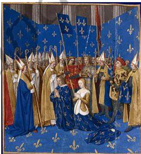
De kroning van Lodewijk VIII en Blanca

Op 23 mei 1200 trouwde Lodewijk op 12-jarige leeftijd met Blanche van Castilië (4 maart 1188 - 26 november 1252).