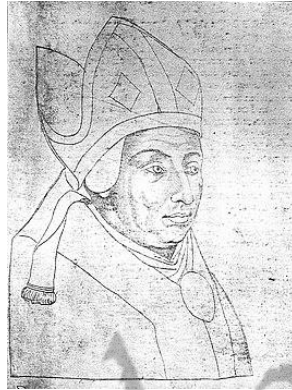
Bisschop van Utrecht

David van Bourgondië was bisschop van Utrecht van 1456 tot 1496. Hij was de langst regerende bisschop van Utrecht, afgezien van Balderik en Willibrord. Hij was ook proost van Sint-Donaas in Brugge.