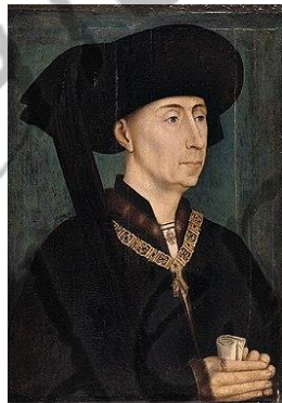
Filips de Goede

David van Bourgondië was een bastaard van de Bourgondische hertog Filips de Goede en Colette Casteleyn.