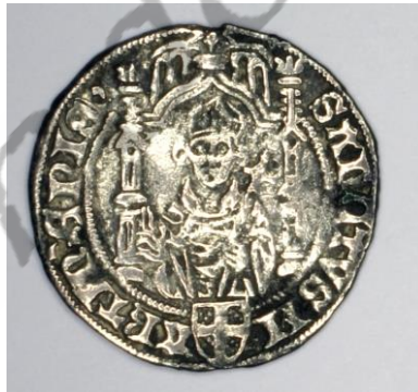
Dubbele stuiver van bisschop David van Bourgondië met dubbele lelie Warburg, 1478