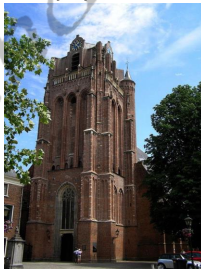
kerk van Wijk bij Duurstede

Met de Slag bij Westbroek heroverde David Utrecht. In 1483 werd hij weer verdreven, wat leidde tot het Beleg van Utrecht. De laatste jaren van David's bewind stonden in het teken van het herstellen van de financiële situatie na de burgeroorlog van 1481-1483 en het laveren tussen de invloed van de Habsburgers, die inmiddels Holland bezaten, en van Gelre. David werd begraven in de kerk van Wijk bij Duurstede.