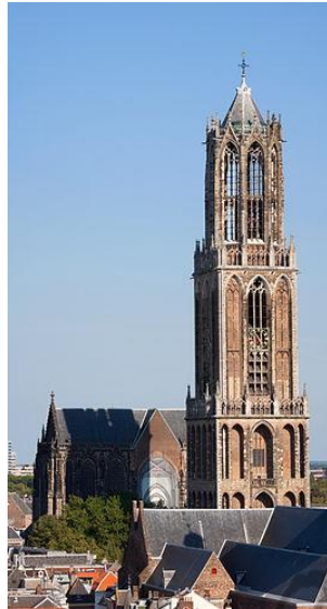
Dom van Utrecht

David van Bourgondië was een prachtlievend vorst die kunstenaars aan zijn hof verbond en een krachtige impuls gaf aan de bouw van de Domkerk in Utrecht.