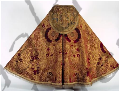
Rode koorkap van David van Bourgondië met goudbrokaten granaatappel- en distelpatroon, ca. 1460, Catharijneconvent, Utrecht

Hij moderniseerde zijn residentie, het Kasteel Duurstede bij Wijk bij Duurstede, en ook de grootse opzet van de kerk in die plaats zal aan hem te danken zijn.