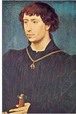
Karel de Stoute

Na de dood van zijn halfbroer Karel de Stoute in 1477 veranderde de situatie.