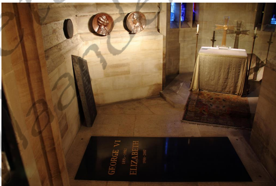
Graf van George VI en The Queen Mother

Op 9 februari 2002 stierf de jongste dochter van George VI, Margaret. Op 30 maart van datzelfde jaar stierf zijn weduwe Elizabeth, vijftig jaar na zijn dood. Zij werden naast hun vader en man bijgezet.