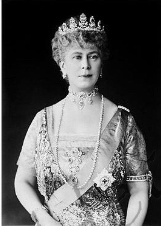
Zijn moeder: Mary van Teck

Als tweede zoon van koning George V was hij aanvankelijk niet voorbestemd om zijn vader op te volgen als koning en stond hij, vooral in zijn jeugd, in de schaduw van zijn oudere broer Eduard (die in de familie en bij zijn vrienden beter bekend was als David). Albert diende tijdens de Eerste Wereldoorlog bij de Royal Navy en na die oorlog nam hij zijn publieke functies waar.