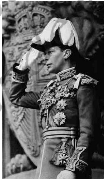
George VI in Canada als Koning van Canada

In 1939 ondernamen de koning en koningin een uitgebreide reis door Canada. Terwijl ze daar waren brachten ze ook een vluchtig bezoek aan de Verenigde Staten. Vanaf Ottawa werd het koninklijk koppel vergezeld door de minister-president van Canada en niet door een Britse minister; dit kwam doordat ze in Canada de titel Koning en Koningin van Canada droegen. George was de eerste regerende monarch van Canada die Noord-Amerika bezocht. Hij was al eerder in Canada geweest, maar toen als prins Albert, hertog van York. De toenmalige Canadese minister-president was William Lyon Mackenzie King, die de koning en koningin ontving in zijn residentie in Rideau Hall.