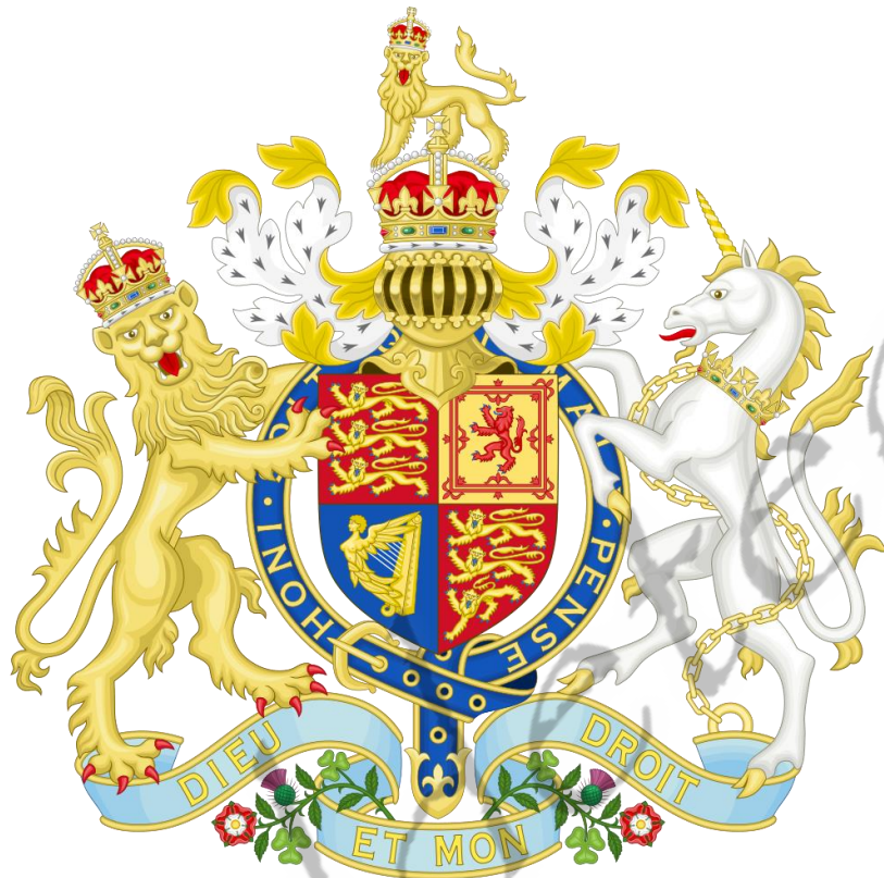
Wapen van George als koning van het Verenigd Koninkrijk