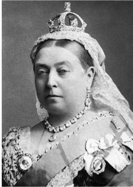
Victoria van het Verenigd Koninkrijk