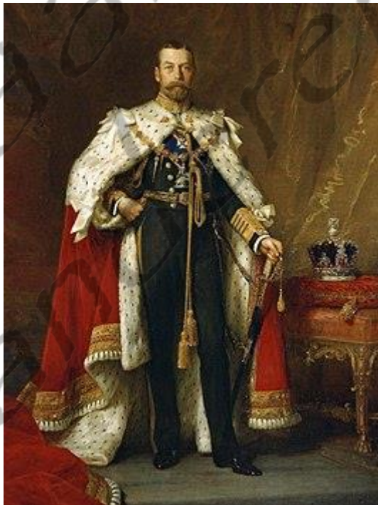
Zijn vader: George V van het Verenigd Koninkrijk

Als tweede zoon van koning George V was hij aanvankelijk niet voorbestemd om zijn vader op te volgen als koning en stond hij, vooral in zijn jeugd, in de schaduw van zijn oudere broer Eduard (die in de familie en bij zijn vrienden beter bekend was als David). Albert diende tijdens de Eerste Wereldoorlog bij de Royal Navy en na die oorlog nam hij zijn publieke functies waar.