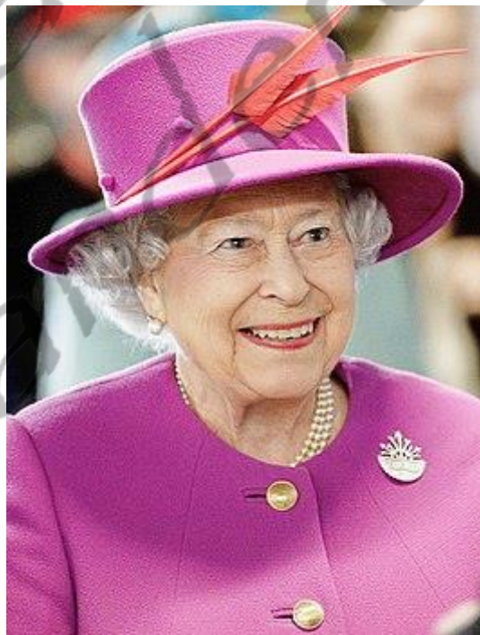
Elizabeth II van het Verenigd Koninkrijk

De hertog en hertogin van York kregen twee kinderen, Elizabeth (die vaak "Lilibet" werd genoemd door de familie) werd geboren op 21 april 1926, zij volgde haar vader op als Elizabeth II, en Margaret, geboren op 21 augustus 1930.