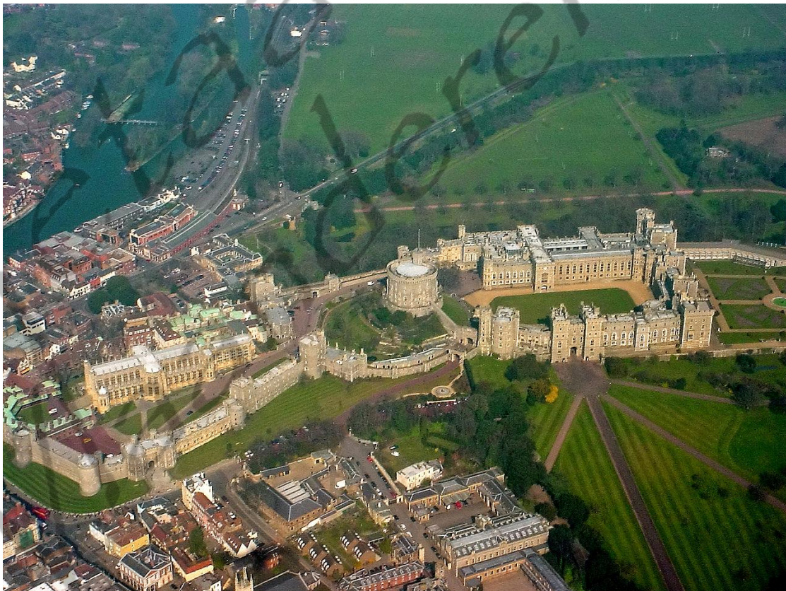
Luchtfoto van Windsor Castle