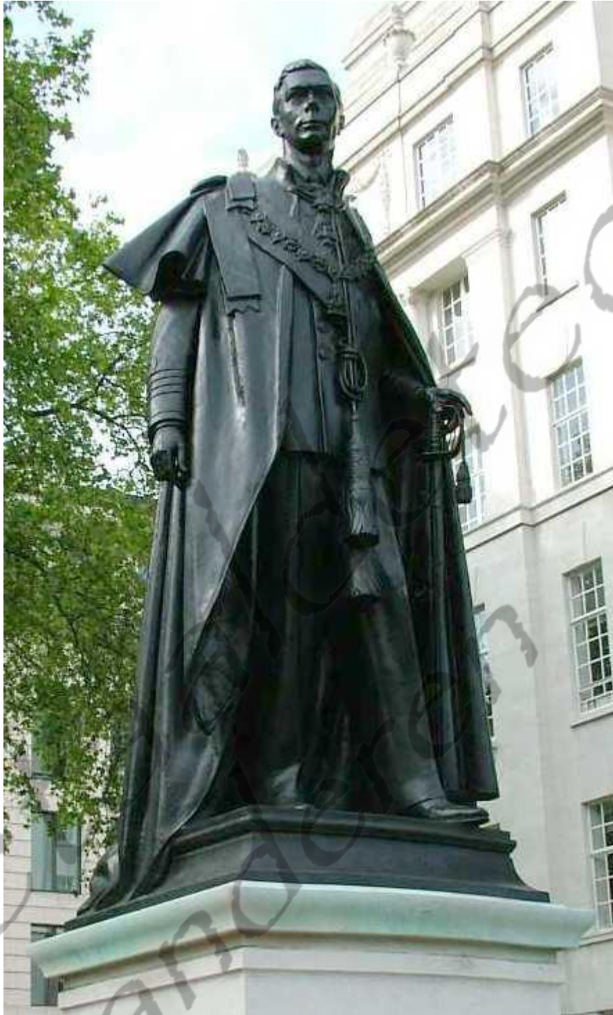
Standbeeld van Koning George VI, Carlton House Terrace, Londen. De koning is afgebeeld in de mantel van de Orde van de Kouseband. De koning was erg gehecht aan deze middeleeuwse ridderorde.