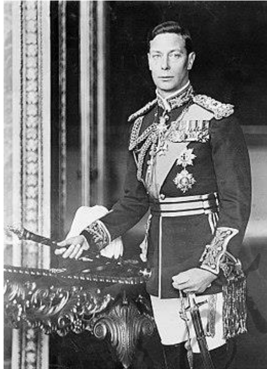
Koning George VI

In 1939 ondernamen de koning en koningin een uitgebreide reis door Canada. Terwijl ze daar waren brachten ze ook een vluchtig bezoek aan de Verenigde Staten. Vanaf Ottawa werd het koninklijk koppel vergezeld door de minister-president van Canada en niet door een Britse minister; dit kwam doordat ze in Canada de titel Koning en Koningin van Canada droegen. George was de eerste regerende monarch van Canada die Noord-Amerika bezocht. Hij was al eerder in Canada geweest, maar toen als prins Albert, hertog van York. De toenmalige Canadese minister-president was William Lyon Mackenzie King, die de koning en koningin ontving in zijn residentie in Rideau Hall.