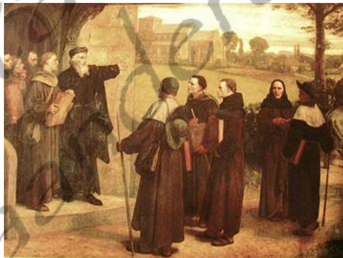
John Wycliffe geeft zijn Bijbelvertaling aan Lollardaanhangers

Nadat hij een opstand van de Lollards (of Lollarden, een radicale afsplitsing van de beweging van John Wyclif) onder John Oldcastle had onderdrukt, trok hij naar Frankrijk.