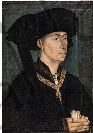
Filips de Goede

In augustus 1417 keerde Hendrik terug naar Frankrijk en veroverde hij stelselmatig Normandië. Na de dood van Jan zonder Vrees bemiddelde diens zoon Filips de Goede tussen Hendrik en de Franse koning Karel VI.