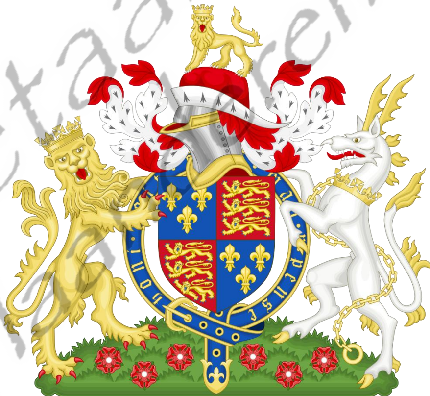
Wapen van Hendrik als koning van Engeland