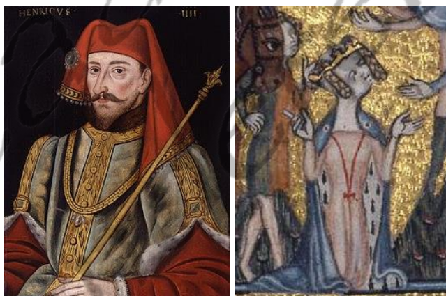
Vader en moeder: Hendrik IV en Maria de Bohun.

Als kind genoot Hendrik onderwijs aan de Universiteit van Oxford. Op 2 juni 1420 trouwde Hendrik met Catharina van Valois, de dochter van koning Karel VI van Frankrijk. Het echtpaar kreeg één kind: