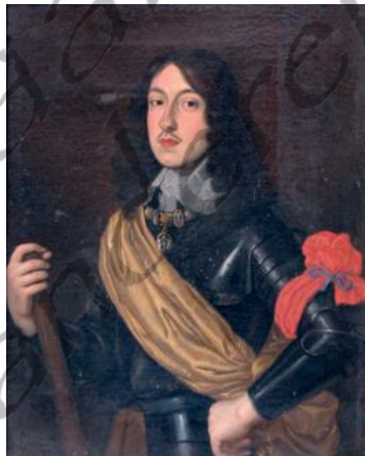
Carlo III Gonzaga

In september 1637 stierf Carlo op 57-jarige leeftijd. Omdat zijn zoon en erfgenaam Carlo II reeds overleden was, werd hij als hertog van Mantua en Monferrato en als graaf van Nevers en Rethel opgevolgd door zijn kleinzoon Carlo III.