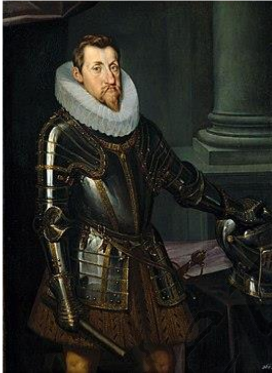
Keizer Ferdinand II