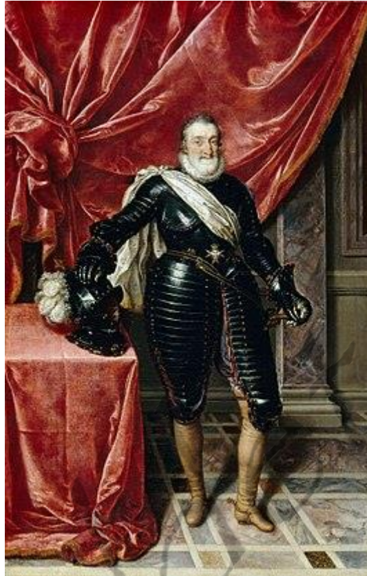
Hendrik IV van Frankrijk

In 1612 claimde Carlo, die een verre afstammeling was van de Byzantijnse keizer Andronikos II Palaiologos, de troon in Constantinopel, op dat moment de hoofdstad van het Ottomaanse Rijk. Hij begon samen te zweren met Griekse rebellen op het schiereiland Mani, die hem koning Constantijn Palaiologos noemden. Toen de Ottomaanse autoriteiten dit te weten kwamen, stuurden ze een leger van 20.000 man en 70 schepen om Mani binnen te vallen. Dit leger verwoestte Mani en vervolgens legden de Ottomanen de inwoners hoge taken op. Karel besloot vervolgens om een kruistocht tegen de Ottomanen te lanceren en stuurde afgevaardigden naar Europese hoven om steun te vinden. Hij slaagde erin om tegen 1619 zes schepen en 5.000 manschappen te rekruteren, maar werd gedwongen om zijn missie stop te zetten wegens het begin van de Dertigjarige Oorlog.