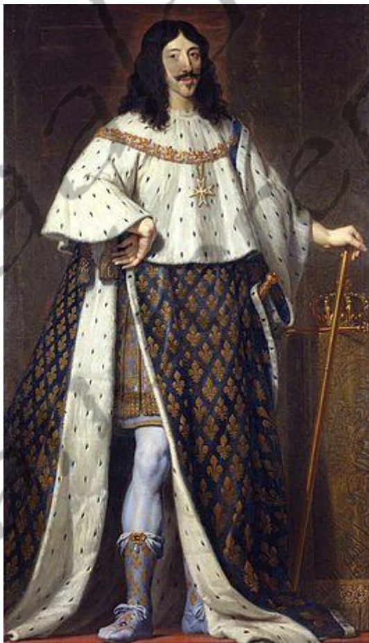
Lodewijk XIII van Frankrijk

Nadat de Fransen erin slaagden om de belegerde stad Casale Monferrato te ontzetten, kon Carlo, die naar de Pauselijke Staten was gevlucht, in 1631 terugkeren naar zijn hertogdom.