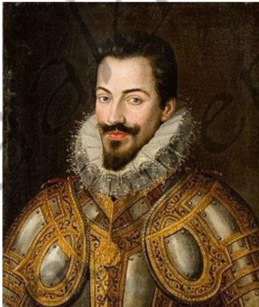
Karel Emanuel I van Savoye

In 1629 stuurde keizer Ferdinand II een leger van Duitse landsknechten naar Mantua om te stad te belegeren. Omdat de beloofde steun van koning Lodewijk XIII van Frankrijk uitbleef, moest Carlo het bij dit beleg alleen op nemen tegen het huis Habsburg. In juli 1630 werd Mantua ingenomen en zwaar geplunderd.