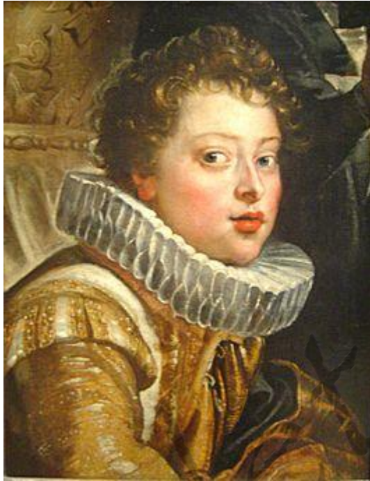
Vincenzo II Gonzaga als jongeman, door Peter Paul Rubens. Kunsthistorisches Museum, Wenen.