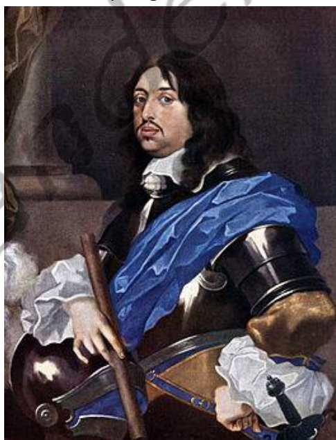
Karel X Gustaaf van Zweden