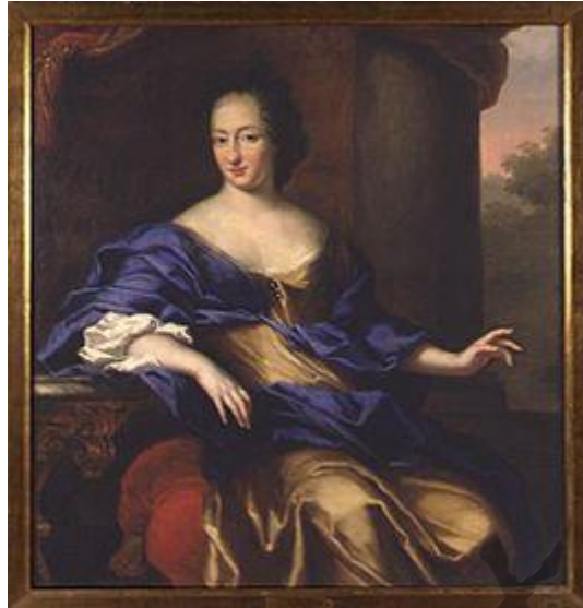
Ulrika Eleonora van Denemarken