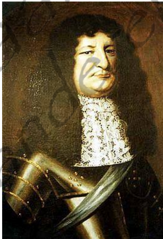
Frederik Willem I van Brandenburg

Frederik Willem I van Brandenburg, de keurvorst van Brandenburg-Pruisen, veroverde Stettin, Stralsund, Greifswald en Rügen (1678).