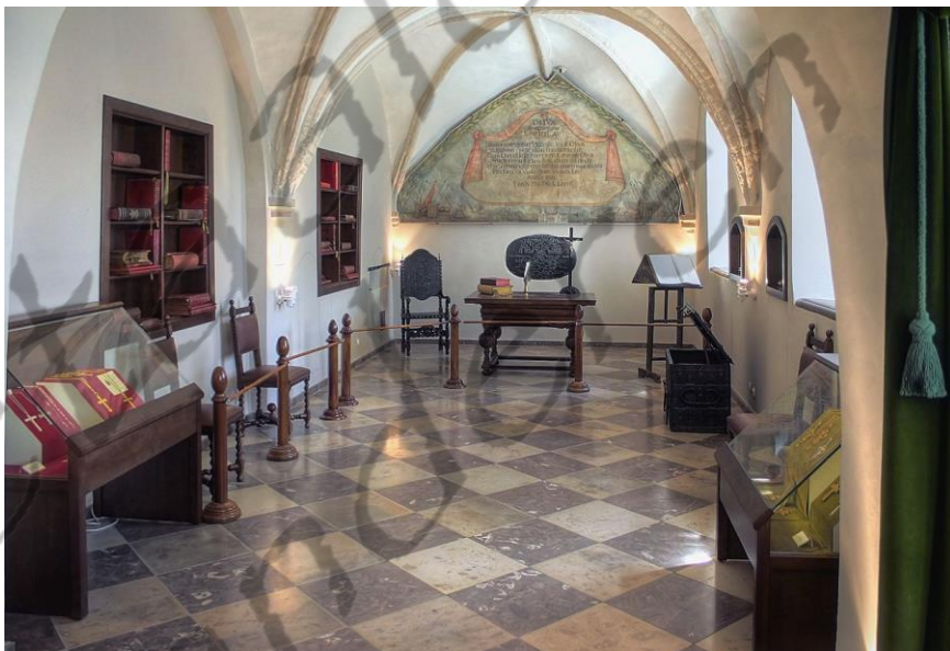
Kamer in het klooster van Oliwa waar het verdrag werd getekend

Nog minderjarig volgde Karel XI zijn vader op. Het regentschap, waaronder zijn moeder, sloot de vrede van Kopenhagen met Denemarken en het Verdrag van Oliva met Polen en Brandenburg, na het beëindigen van de Tweede Noordse Oorlog.