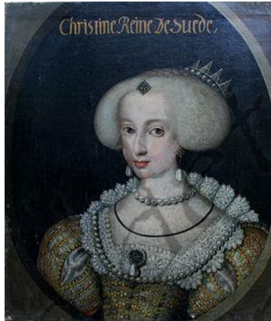
Christina I van Zweden

Na de vrede wijdde Karel XI zich aan het herstel van Zweden. Door beschermende maatregelen werd de industrie bevorderd, nieuwe mijnen ontgonnen en de financiële toestand verbeterd door de reduktionen, dit wil zeggen het terugdraaien van belastingen en onteigening van onder Christina I van Zweden verkochte domeinen, in het bezit gekomen van de adel.