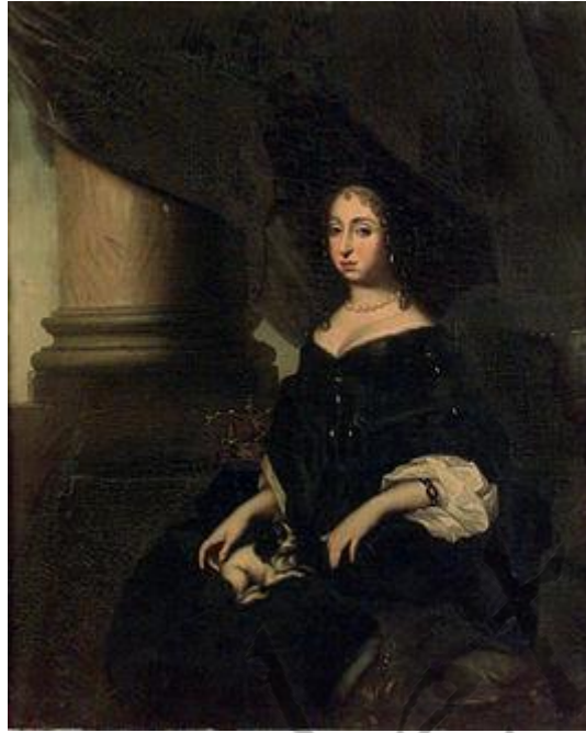
Hedwig Eleonora van Sleeswijk-Holstein-Gottorp

Nog minderjarig volgde Karel XI zijn vader op. Het regentschap, waaronder zijn moeder, sloot de vrede van Kopenhagen met Denemarken en het Verdrag van Oliva met Polen en Brandenburg, na het beëindigen van de Tweede Noordse Oorlog.