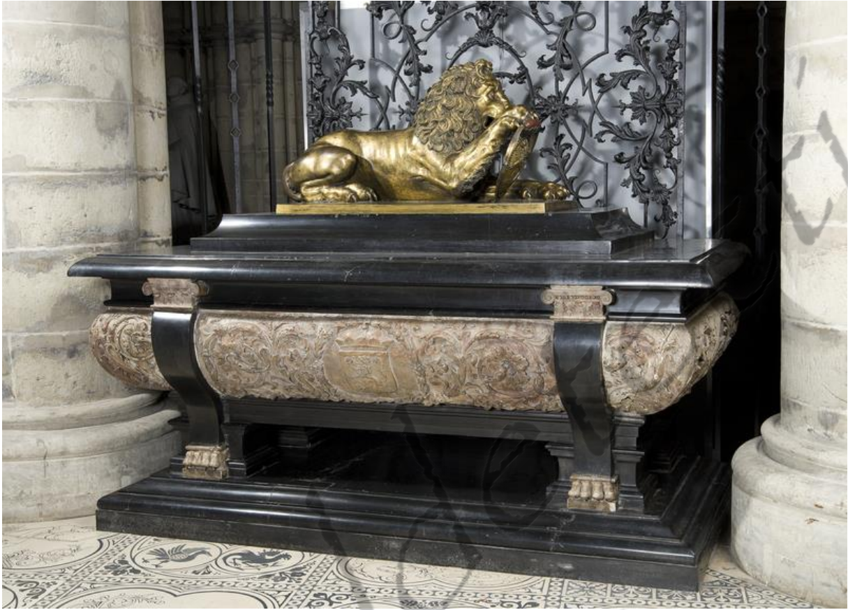
Graftobe Hertog Jan II van Brabant