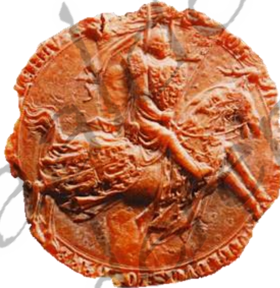
Zegel van Jan II

Bij het gemeentehuis te Nuenen staat een beeld van hertog Jan II. Op 23 april 2001 is dit beeld onthuld.