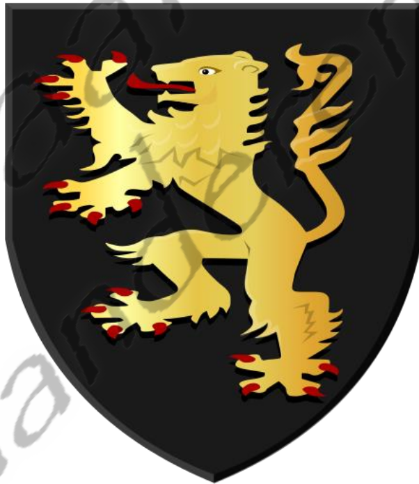
Wapen van Jan II

Hij is bijgezet in de Kathedraal van Sint-Michiel en Sint-Goedele te Brussel.