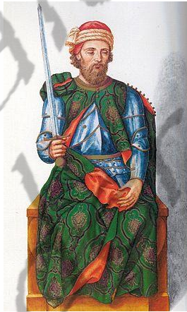
Hendrik II van Castilië

Het laatste deel van zijn regering werd vooral beheerst door de politieke intriges en de oorlog met zijn zoon Peter. De burgeroorlog in Castilië tussen koning Hendrik II van Castilië en Peter de Wrede deed vele edelen naar Portugal vluchten.