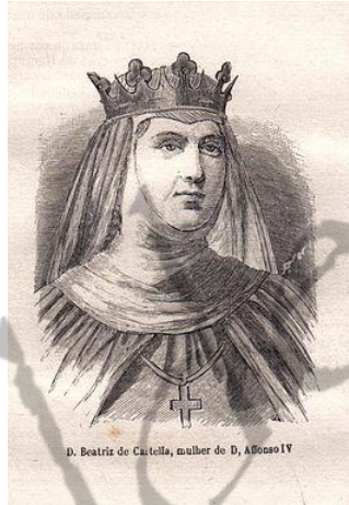
Beatrix van Castilië

Volgens sommige bronnen gaf zijn vader echter de voorkeur aan zijn halfbroer, Alfonso Sanchez. De rivaliteit tussen de twee halfbroers laaide zo hoog op dat een burgeroorlog dreigde. Op 7 januari 1325 stierf Dionysius, en werd Alfons koning. Deze nam meteen wraak door Alfonso Sanchez naar Castilië te verbannen en alles wat deze van zijn vader had geërfd in beslag te nemen. Alfonso Sanchez gaf zich echter niet zonder meer gewonnen en ondernam vanuit Castilië in Spanje verschillende pogingen om zijn broer van de troon te stoten. Uiteindelijk werd via bemiddeling van moeder Isabel vrede gesloten. In 1309 trouwde Alfonso IV met prinses Beatrix van Castilië, de dochter van koning Sancho IV van Castilië, de Dappere, en diens echtgenote Maria van Molina.