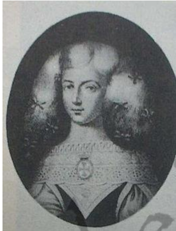
Inês de Castro

Daar wisten deze edelen belangrijke posities aan het hof te verkrijgen. Toen de zoon van Alfons IV, Peter, een verhouding begon met Inês de Castro, nam de invloed van deze Castiliaanse lobby nog toe, en vreesde Alfons IV dat hem de macht ontnomen zou worden. Hij liet Inês de Castro vermoorden, waarop hij in een oorlog met zijn zoon geraakte.