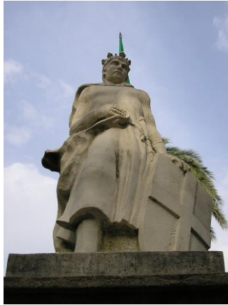
Standbeeld van Alfons XI van Castilië

In 1336 regelde Alfons een huwelijk tussen zijn zoon Peter en Constance Manuel van Castilië. Dit huwelijk had Alfons geregeld met de bedoeling de banden tussen Portugal en het koninkrijk van Castilië te verstevigen, en zich van een bondgenoot in de strijd tegen de Moren te verzekeren. Het huwelijk werd op 24 augustus 1339 in Lissabon voltrokken. In 1340 werd een belangrijke overwinning behaald door de troepen van Castilië en Portugal in de slag bij de rivier Salado.