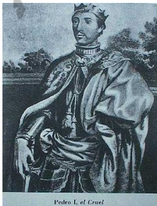
Peter I van Castilië, bijgenaamd 'de Wrede'