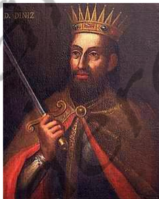
Dionysius van Portugal

Alfons was de enige wettige troonopvolger uit het huwelijk tussen Dionysius van Portugal en diens echtgenote Isabel van Aragón.