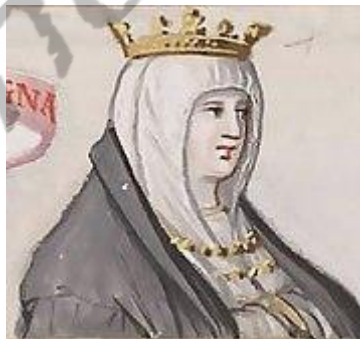
Maria van Portugal

In 1328 trouwde een dochter van Alfons IV van Portugal, Maria, met Alfonso XI van Castilië.