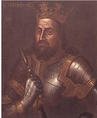
Koning van Portugal

Alfons IV bijgenaamd de Dappere, was koning van Portugal van 1325 tot aan zijn dood.