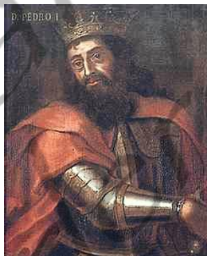
Peter I van Portugal

Ferdinand I, ook wel genoemd Ferdinand de Schone (in het Portugees: O Formoso) is de tweede (maar wel eerst overlevende) zoon van Peter I van Portugal en Constance Manuel van Peñafiel.