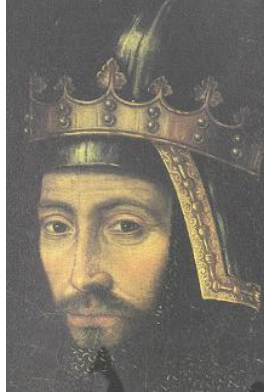
Jan van Gent

Nadat Hendrik II van Castilië na veel strijd eindelijk de kroon van Castilië en León had veroverd en zijn broer Peter van Castilië in 1369 om het leven had gebracht, maakte ook Ferdinand aanspraak op het koninkrijk. Ook de koningen van Aragon en Navarra maakten aanspraak op Castilië en León, net als Jan van Gent, de hertog van Lancaster, die in 1370 met de oudste dochter van Peter was getrouwd.