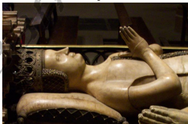
Eleonora van Castilië