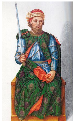
Hendrik II van Castilië

Ferdinand was ook een kleinzoon van Sancho IV, koning van Castilië en León (1257-1295).