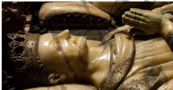
De graftombe van Karel III van Navarra in Pomplona

Aan het Portugese Hof veroorzaakte de affaire een regelrechte oproer, maar het had verder geen gevolgen voor de relatie tussen Portugal en Castilië. Hendrik II huwelijkte zijn dochter vervolgens uit aan Karel III van Navarra.