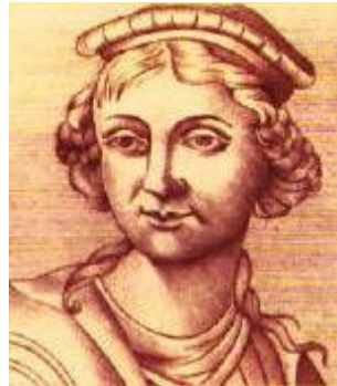
Leonor Teles de Menezes

Voordat het huwelijk kon worden vertrokken, werd Ferdinand echter verliefd op Leonor Teles de Menezes, de vrouw van een van zijn hofridders, en besloot met haar te trouwen.