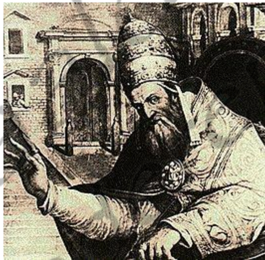
Paus Gregorius XI

Uiteindelijk aanvaardden de strijdende partijen de bemiddeling van Paus Gregorius XI en in 1371 werd een verdrag gesloten waarbij werd besloten dat Ferdinand zou trouwen met Eleonora van Castilië (1362-1416).