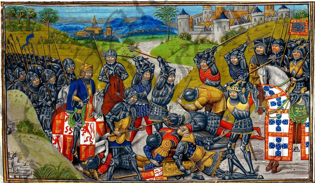
Slag bij Aljubarrota

In oktober 1383 stierf Ferdinand zonder mannelijke troonopvolger waardoor de directe Bourgondische lijn, die sinds 1112 de Portugese kroon in handen had, ophield te bestaan. De dood van Ferdinand luidde een Portugese opvolgingscrisis in omdat de Portugezen beducht waren voor te veel Castiliaanse invloed. In 1385 viel Johan I van Castilië Portugal binnen om de rechten van zijn vrouw te vrijwaren, maar hij werd in hetzelfde jaar verslagen in de Slag bij Aljubarrota.