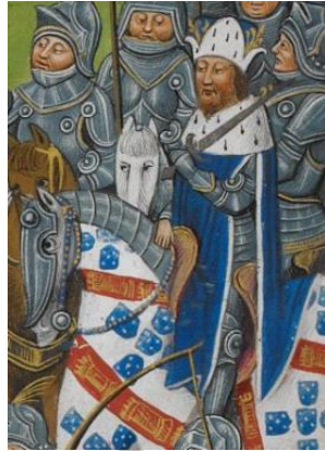
Koning van Portugal

Ferdinand I was koning van Portugal van 1367 tot zijn dood.