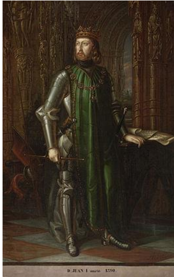
Johan I van Castilië

In oktober 1383 stierf Ferdinand zonder mannelijke troonopvolger waardoor de directe Bourgondische lijn, die sinds 1112 de Portugese kroon in handen had, ophield te bestaan. De dood van Ferdinand luidde een Portugese opvolgingscrisis in omdat de Portugezen beducht waren voor te veel Castiliaanse invloed. In 1385 viel Johan I van Castilië Portugal binnen om de rechten van zijn vrouw te vrijwaren, maar hij werd in hetzelfde jaar verslagen in de Slag bij Aljubarrota.