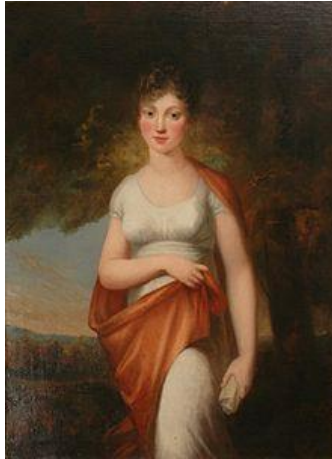
Charlotte Frederika van Mecklenburg-Schwerin