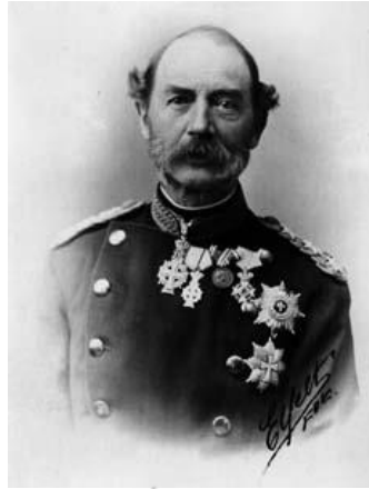
Christiaan IX van Denemarken

voor 'gevallen' jonge vrouwen. Frederik VII stierf zonder wettelijke kinderen (hij had slechts één buitenechtelijke zoon). De vorst werd na zijn dood in 1863 opgevolgd door prins Christiaan (IX) van Glücksburg.