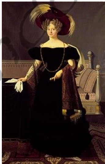
Wilhelmina Maria van Denemarken

Na de dood van zijn vader in 1848 besteed hij als Frederik VII de Deense troon. Op 5 juni 1849 gaf hij Denemarken een grondwet en werd het een constitutionele monarchie. Dit wordt nog altijd gevierd op de nationale feestdag (5 juni) van Denemarken. Hij was in 1828 gehuwd met zijn nicht Wilhelmina Marie, dochter van Frederik VI van Denemarken, en in 1841 met Caroline, dochter van George van Mecklenburg-Strelitz.