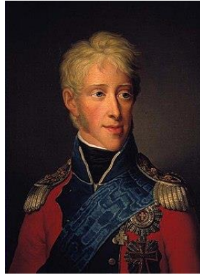
Frederik VI van Denemarken