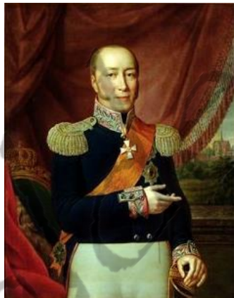
Frederik Frans I van Mecklenburg-Schwerin

Na de dood van zijn vader in 1848 besteed hij als Frederik VII de Deense troon. Op 5 juni 1849 gaf hij Denemarken een grondwet en werd het een constitutionele monarchie. Dit wordt nog altijd gevierd op de nationale feestdag (5 juni) van Denemarken. Hij was in 1828 gehuwd met zijn nicht Wilhelmina Marie, dochter van Frederik VI van Denemarken, en in 1841 met Caroline, dochter van George van Mecklenburg-Strelitz.