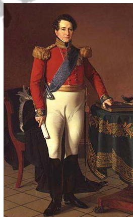
Christiaan VIII van Denemarken

Hij was de zoon van Christiaan VIII van Denemarken en Charlotte Frederika van Mecklenburg-Schwerin, dochter van Frederik Frans I.