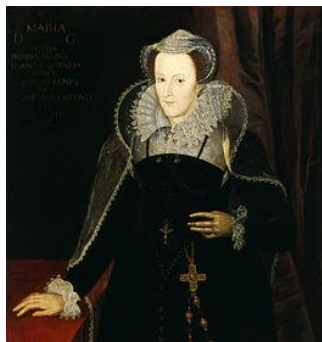
Maria I van Schotland

Algemeen werd aangenomen dat Dudley zijn vrouw had vermoord om Elizabeth te kunnen trouwen. Sommigen beweerden zelfs dat in het geheim al een huwelijk was gesloten. Ironisch genoeg verhinderde de dood van Amy dat Elisabeth en Dudley trouwden. Elizabeth, niet ongevoelig voor de publieke opinie, gaf nooit meer een signaal af dat Dudley weleens haar echtgenoot zou kunnen worden. In 1563 droeg ze Dudley voor als echtgenoot van de Schotse koningin Maria I, maar Mary wees hem af. In datzelfde jaar schonk Elizabeth Dudley de titel van graaf van Leicester.