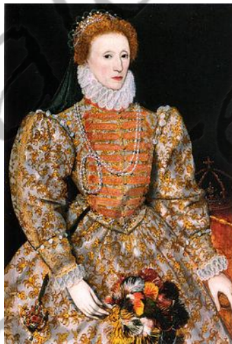
Elizabeth I van Engeland

Leicester was een groot deel van zijn leven vertrouweling en favoriet van de Engelse koningin en het scheelde niet veel of hij was haar echtgenoot geworden.