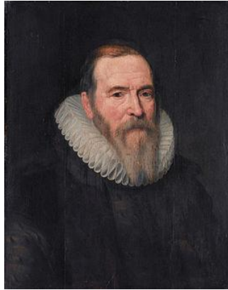
Johan van Oldenbarnevelt

Hierdoor werd Dudley door landsadvocaat Johan van Oldenbarnevelt die de gewesten achter zich wist, in 1587 het bevel over het leger ontnomen en werd hij gedwongen de Nederlanden te verlaten.