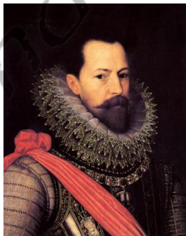
Alexander Farnese (hertog van Parma of kortweg Parma genoemd)

Dudley trachtte in Utrecht een landsbestuur op basis van een sterke centrale macht op te bouwen. Dit werd door de gewesten, gewend als zij waren aan hun autonomie, niet geaccepteerd. Ook het verraad van zijn officieren deels tijdens een verblijf van Dudley in Engeland (1586) gepleegd (Zutphen), alsook het verraad bij Deventer, waarbij in beide gevallen de schansen aan de Spanjaard over werden gedragen, speelde Dudley parten. Daarnaast ging het gerucht dat hij op last van Elizabeth vredesonderhandelingen met de Spaanse veldheer Parma belegd had.