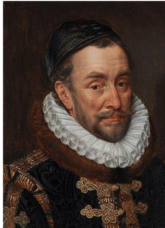
Willem van Oranje

Na de moord op Willem van Oranje (1584) zochten de Staten Generaal steun bij de koningin van Engeland.