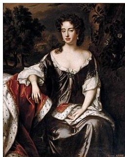
Anna van Groot-Brittannië

In 1714, na de dood van koningin Anna van Groot-Brittannië, besteed hij op 54-jarige leeftijd de Britse troon als de eerste monarch van het Huis Hannover.