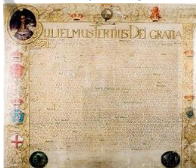
De originele Act of Settlement

Na de dood van zijn moeder, die bij de Act of Settlement als troonopvolgster was aangewezen, gingen haar rechten over op George.