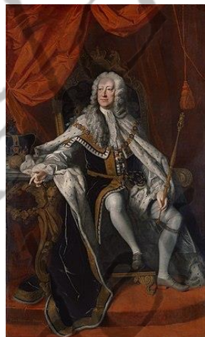
George II van Groot-Brittannië

George leerde nooit goed Engels spreken en verdeelde zijn tijd tussen Engeland en zijn gebied in Hannover, waardoor hij vaak buitenslands was. De verstandhouding met zijn zoon prins George was slecht.