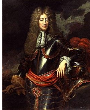
Jacobus II van Engeland

Op 31 oktober 1714 werd hij gekroond tot koning van Groot-Brittannië en Ierland als opvolger van koningin Anna. De Hannoveraars waren de naaste protestantse familieleden. Zij kregen echter te maken met tegenstand van aanhangers van Jacobus Frans Eduard Stuart, de zoon van koning Jacobus II. Hun opstand liep in 1715 op niets uit.