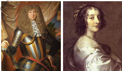
Ernst August van Brunswijk-Lüneburg en Sophia van de Palts

George werd geboren op 28 mei 1660 te Hannover als oudste kind van Ernst August van Brunswijk-Lüneburg en Sophia van de Palts, een dochter van Elizabeth Stuart.