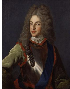
Jacobus Frans Eduard Stuart

Alhoewel er meer dan vijftig nauwere, doch rooms-katholieke, bloedverwanten waren van Anna, verbood de Act of Settlement dat er katholieken op de Britse troon zouden zitten; George was zo, via de familietak van zijn grootmoeder, de dichtst levende protestantse verwant van Anna. In reactie hierop probeerden de jakobieten George af te zetten en hem te vervangen door de katholieke halfbroer van Anna, Jacobus Frans Eduard Stuart, maar dat mislukte.