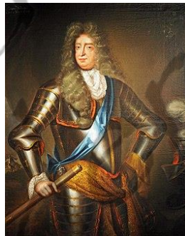
George Willem van Brunswijk-Lüneburg

Vanaf 1698 bestuurde hij het Keurvorstendom Brunswijk-Lüneburg en na de dood van zijn oom en schoonvader George Willem van Brunswijk-Lüneburg in 1705 erfde hij het Hertogdom Brunswijk-Lüneburg.