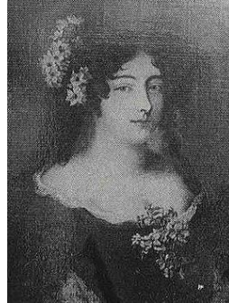
Melusine von der Schulenburg

George sprak Duits en had een aaneenschakeling van Duitse maîtresses. Bij een van hen, Melusine von der Schulenburg, die hij hertogin van Kendall maakte, had hij zeker drie onwettige kinderen.