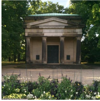
Mausoleum van Herreshausen