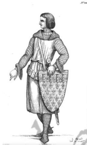
Filips van Artesië

Floris liep in januari 1296 over naar de Franse kant, wat waarschijnlijk de belangrijkste oorzaak is geweest van zijn dood (27 juni 1296). In 1296 versloeg hij de Engelsen in Aquitanië. Op 20 augustus 1297 versloeg hij in Bulskamp bij Veurne de Vlamingen, waarna de Fransen het graafschap bezetten. In die slag raakte zijn zoon Filips dodelijk gewond.