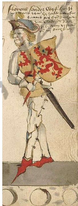
Floris V van Holland