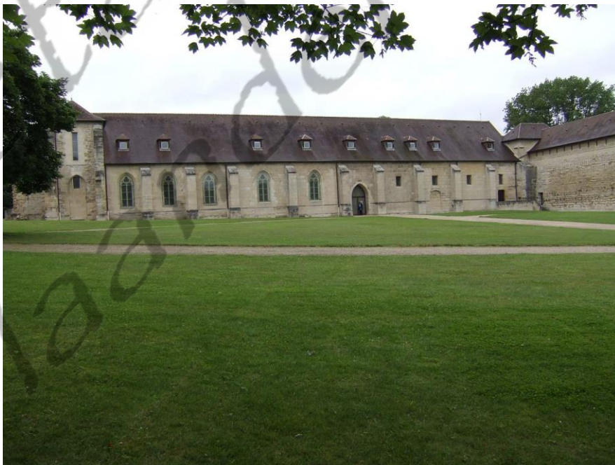
Abdij van Maubuisson

Hij werd begraven in de Abdij van Maubuisson (Frankrijk).