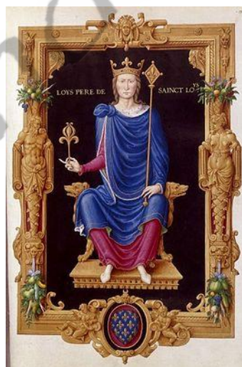
Lodewijk VIII van Frankrijk