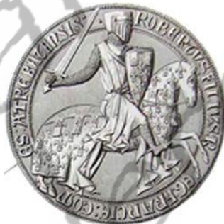
Robert I van Artesië