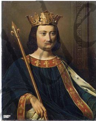
Filips IV van Frankrijk

In 1270 nam Robert deel aan de Achtste Kruistocht naar Tunis. In de zomer van 1295 werd hij er door de koning Filips IV van Frankrijk op uitgestuurd om graaf Floris V van Holland te werven voor de Franse partij.