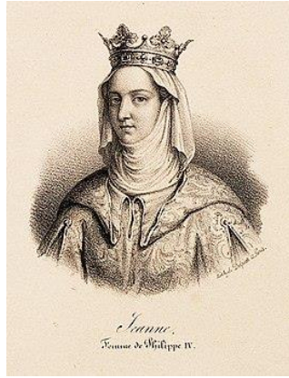
Johanna I van Navarra

In 1270 nam Robert deel aan de Achtste Kruistocht naar Tunis. In de zomer van 1295 werd hij er door de koning Filips IV van Frankrijk op uitgestuurd om graaf Floris V van Holland te werven voor de Franse partij.