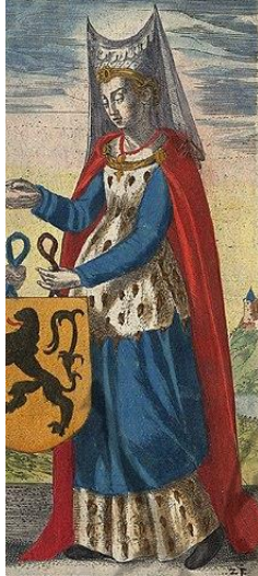
Beatrix van Brabant

Historici stellen zich vragen bij het feit dat hij tijdens die slag zijn cavalerie een aanval liet inzetten dwars over de Grote Beek en de Groeningebeek. Dit terrein bleek namelijk zo drassig dat het de Franse aanval afremde, zodat de Vlaamse linies de ruiters makkelijk konden uitschakelen. Hij moet deze plek nochtans gekend hebben, aangezien hij meermaals in Kortrijk had verbleven bij zijn tante, gravin Beatrijs, die in de Kortrijkse burcht woonde.