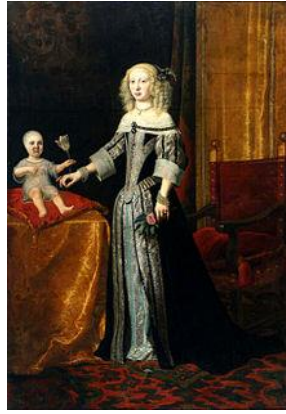
Elisabeth Amalia van Hessen-Darmstadt

Johan Willem werd opgevoed door Jezuïeten en was tamelijk ambitieus. In 1674 maakte hij een Grand tour naar Italië. In 1678 huwde hij met aartshertogin Maria Anna Jozefa van Oostenrijk in Wiener Neustadt. In 1679 verkreeg hij de hertogdommen Gulik en Berg. Door de huwelijken van zijn zusters kreeg hij contacten met de vorstenhuizen in Portugal, Spanje, Parma en Polen. Na het overlijden van zijn eerste echtgenote trouwde hij in 1691 met Anna Maria Luisa de' Medici (1667-1743), dochter van Cosimo III de' Medici, groothertog van Toscane, in Ulm.