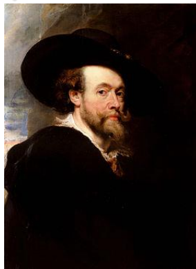
Peter Paul Rubens

Door de Vrede van Rastatt in 1714 kwam er een eind aan de Spaanse Successieoorlog. Oostenrijk en Frankrijk sloten vrede. Johan Willem bevorderde de handel en de ontwikkeling van kunst en cultuur. Op een vleugel van het kasteel met een fraai uitzicht op de Rijn werd tussen 1709 en 1714 een nieuwe etage gezet met een galerij voor meer dan driehonderd schilderijen in vijf zalen. Domenico Zanetti schilderde een aantal plafonds, waarvan de ontwerpen bewaard zijn gebleven. Naast de tientallen Italiaanse schilders, ingebracht door zijn vrouw, waren veel Nederlandse schilders vertegenwoordigd o.a. Gerard van Honthorst, David Vinckboons, Nicolaes Berchem, Rembrandt, Jan Baptist Weenix, Michiel Coxie, Gabriël Metsu, Gerbrand van den Eeckhout, van der Mij, maar vooral Peter Paul Rubens.