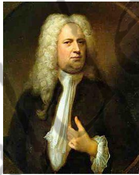
Georg Friedrich Händel

In 1710 kwam Georg Friedrich Händel die op weg was naar Londen langs om voor het vorstelijk gezelschap te spelen. Ook Corelli, Steffani en Veracini bezochten het hof.