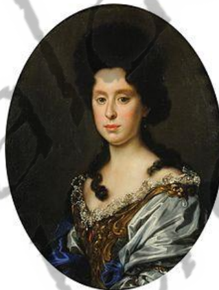
Anna Maria Luisa de' Medici

Johan Willem werd opgevoed door Jezuïeten en was tamelijk ambitieus. In 1674 maakte hij een Grand tour naar Italië. In 1678 huwde hij met aartshertogin Maria Anna Jozefa van Oostenrijk in Wiener Neustadt. In 1679 verkreeg hij de hertogdommen Gulik en Berg. Door de huwelijken van zijn zusters kreeg hij contacten met de vorstenhuizen in Portugal, Spanje, Parma en Polen. Na het overlijden van zijn eerste echtgenote trouwde hij in 1691 met Anna Maria Luisa de' Medici (1667-1743), dochter van Cosimo III de' Medici, groothertog van Toscane, in Ulm.