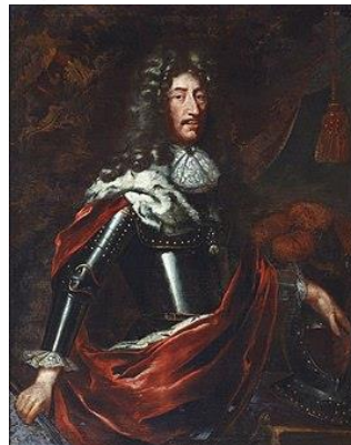
Filips Willem van de Palts