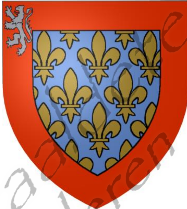
Wapenschild van Maine