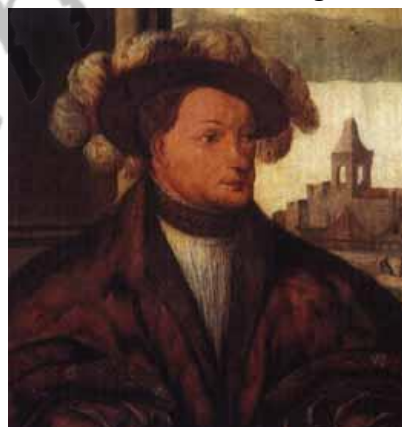
Karel van Gelre