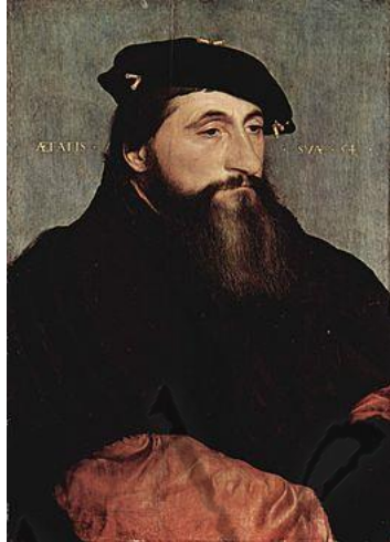
Hertog van Lotharingen

Anton van Lotharingen bijgenaamd de Goede was hertog van Opper-Lotharingen van 1508 tot 1544 in opvolging van zijn vader.