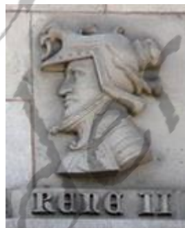
René II van Lotharingen

Hij was een zoon van hertog René II van Lotharingen en Filippa van Gelre, de zuster van hertog Karel van Gelre.