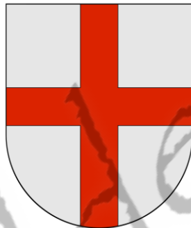
Oud wapenschild van de prins-bisschoppen van Paderborn

In 1495 werd Herman benoemd tot coadjutor van het prinsbisdom Paderborn. Op 7 maart 1498 werd hij met de steun van keizer Maximiliaan I en paus Alexander VI tot bisschop van Paderborn verkozen. Het Rijkskamergerecht handhaafde Hermans jurisdictie over het oostelijke deel van Paderborn. Op 1 oktober 1500 hield hij in Paderborn een zogenaamde Leensdag die de edelen van Paderborn moest toelaten om hem te huldigen. Ook herstelde het Rijkskamergerecht het bezit van het prinsbisdom Paderborn over Helmarshausen en Delbrück.