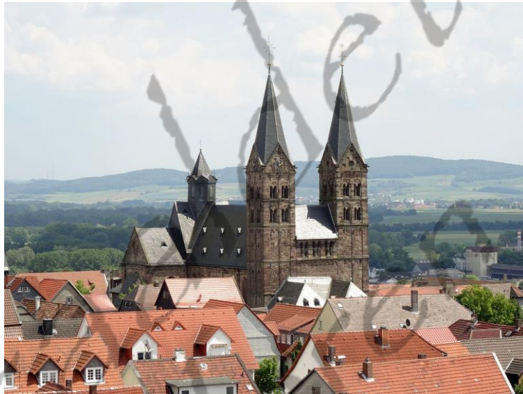
Kathedraal van Fritzlar