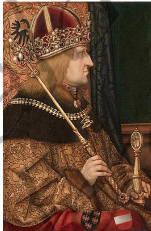
Keizer Frederik III

In november 1475 werd hij door keizer Frederik III benoemd tot Stiftsgubernator.