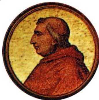
Paus Innocentius VIII

In 1478 wist Herman de controle over de aartsbisdom Keulen te herwinnen na de arrestatie van aartsbisschop Ruprecht van de Palts. Na het overlijden van Ruprecht werd hij op 11 augustus 1480 tot diens opvolger verkozen. In november 1480 werd hij door paus Innocentius VIII officieel benoemd tot aartsbisschop.