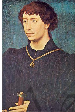
Karel de Stoute

In 1472 deed Herman IV een poging om tot bisschop van Hildesheim verkozen te worden, maar hij diende zich na zijn bisschopsverkiezing terug te trekken omdat hij geen pauselijke erkenning kreeg. In 1473 werd hij diocesaan administrator van het aartsbisdom Keulen. In deze functie raakte hij betrokken bij de Keulse Stiftvete, in de periode dat Karel de Stoute het Beleg van Neuss lanceerde.