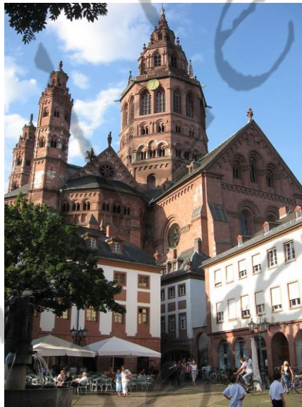
Dom van Mainz