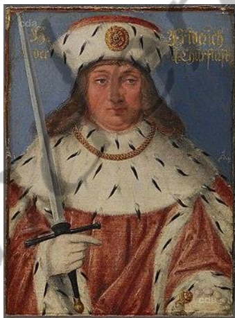
Frederik I van Saksen

Herman IV was de derde zoon van landgraaf Lodewijk I van Hessen en Anna van Saksen, dochter van keurvorst Frederik I van Saksen.